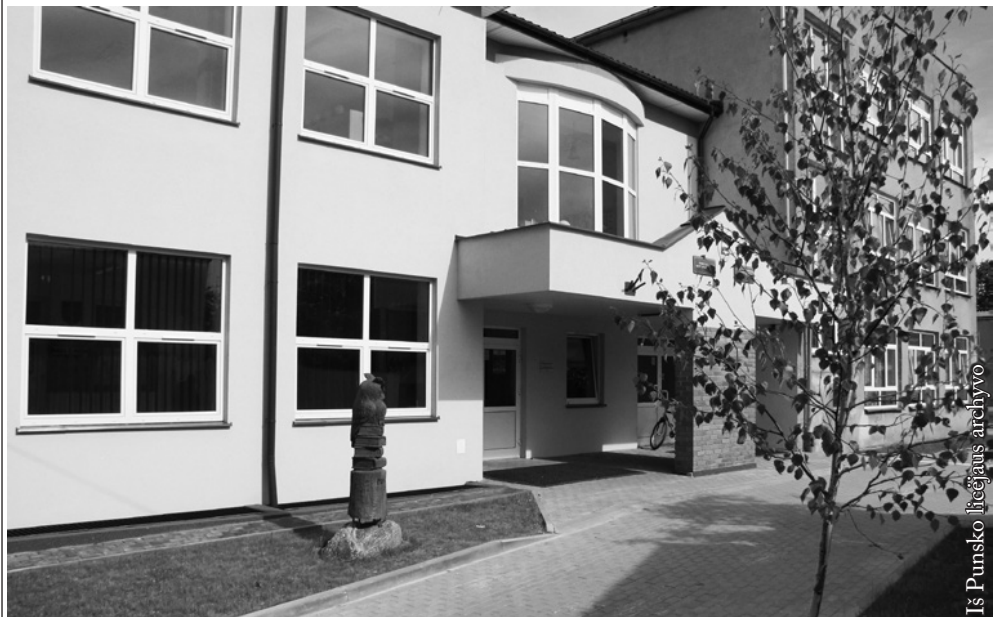
Iš Punsko licejaus archyvo

https://2021.licea.perspektywy.pl/rankings/ranking-podlaski