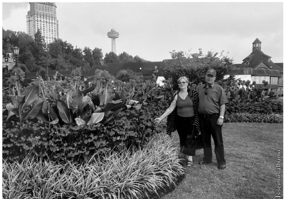
Iš šeimos albumo