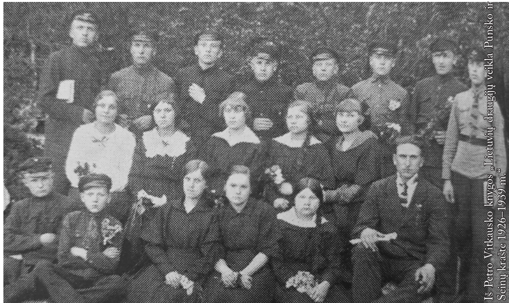
Seinų krašto lietuviai gimnazistai

1924 rugpjūčio 31 Seinų aps. lietuviai „Vilniaus kelio“ Nr. 35 paskelbė protestą prieš Varšuvos lenkų seimo