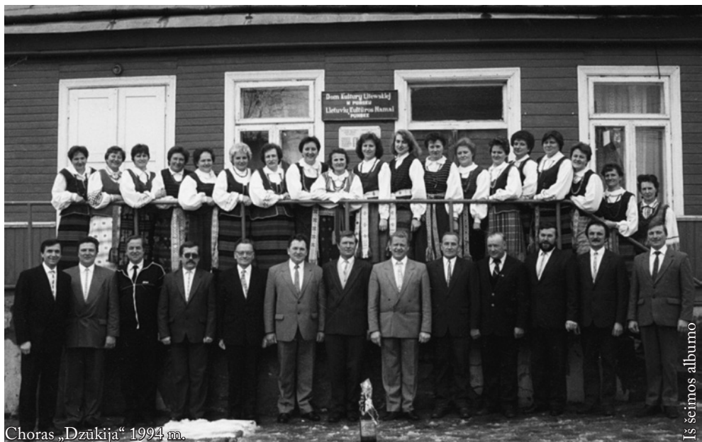
Choras „Dzūkija“ 1994 m.