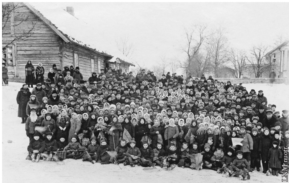
Moksleiviai Kurkliuose (dab. Anykščių raj.) švenčia Vasario 16-ąją, apie 1920-1921 m.

į lietuviškas mokyklas. Suiėškokime visus lietuviukus visuose kampuose. Negailėkime tam nei laiko, nei darbo, nei lėšų. Tačiau, kokia svarbi įstaiga būtų lietuviška mokykla, bet pati viena tokiomis sąlygomis, kokios šiandien yra, ji lietuviško lietuviuko neišaugins. Pati svarbioji šio „mokslo ir meno įstaiga“ yra šeima. Todėl už lietuviybės išlaikymą ji ir neša didžiausią atsakomybę, bet taip pat ir sunkiausią našta.“ Gražūs ir prasmingi žodžiai. Jus perskaitęs iš karto pagalvojau apie Suvalkuose gyvenančius lietuviukus. Juk pirmieji daigai jau išdygo, tačiau kad auginamo derliaus nepasiimtų kaimynai – vėl reikia sėti!