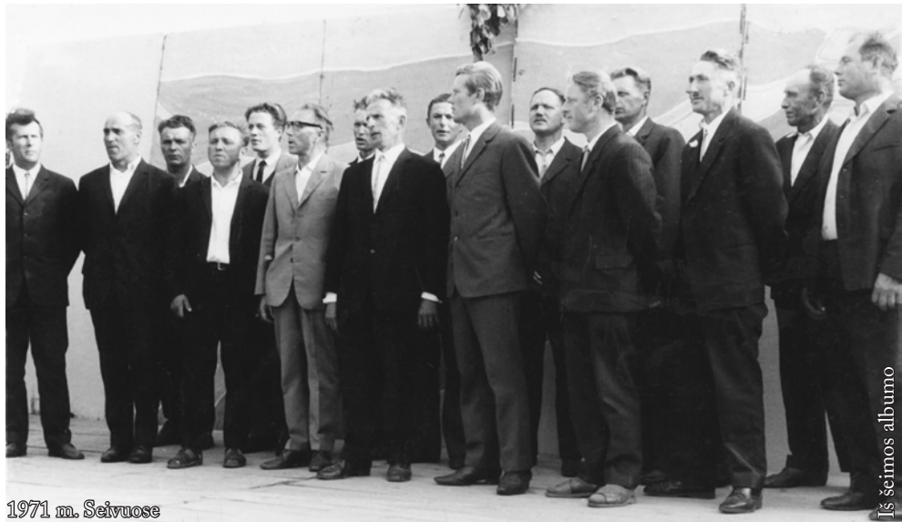
1971 m. Seivuose