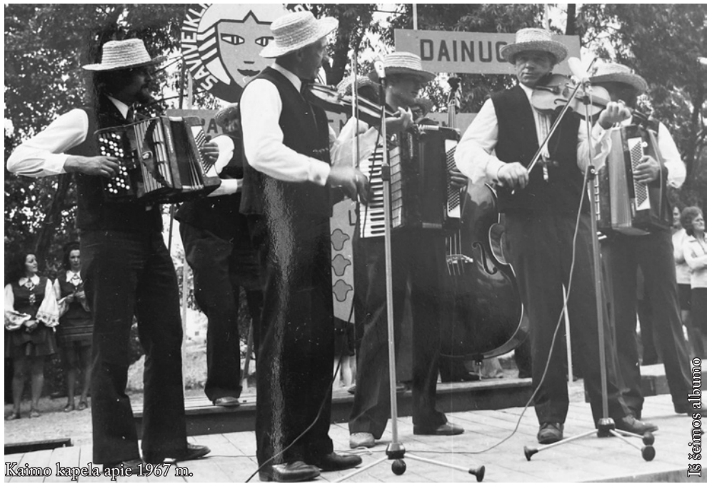
Kaimo kapela apie 1967 m.