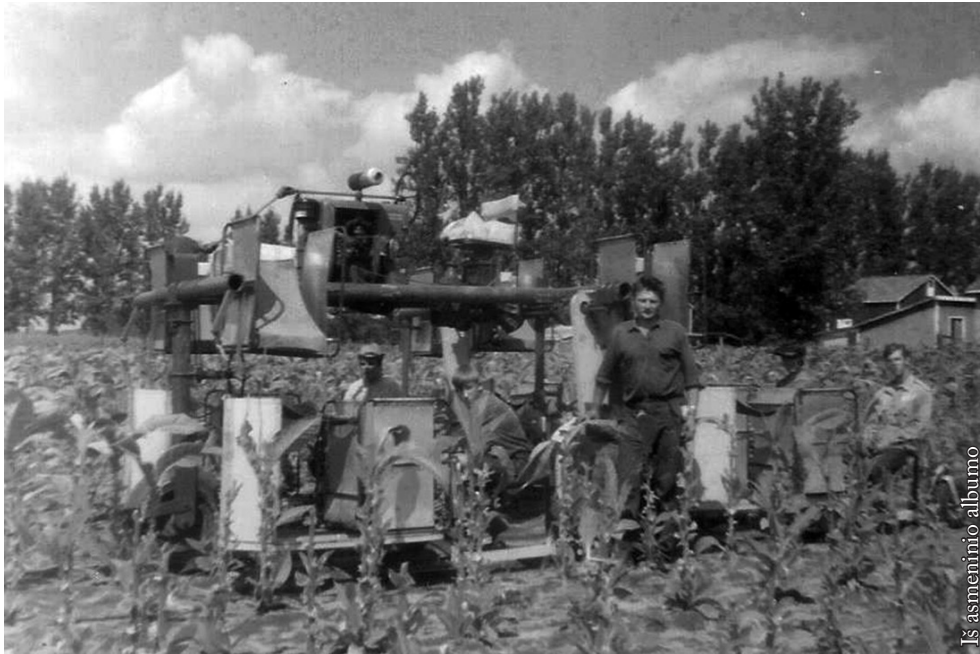
Skynimo mašina, skinant paskutinius lapus

bendravę mano šeimininkai visada mane pagirdavo, kad esu geras darbininkas. Moteris sakydavo, jog kai pusininkas išeis, ji leisianti ateiti man.