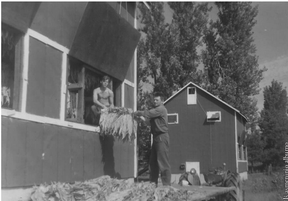
Iš asmeninio albumo

Pradedant gyvenimą mieste žmona laikinai išsidarbino drabužių siuvinijoje, kur siuvėju dirbo mano sesers vyro dėdė (jam padedant žmona gavo šį darbą). Aš chemikalų gamykloje pavadavau darbininką, kuris išvyko šešių savaičių povestuvinei kelionei į Europą. Man tai tiko, nes vasarai planavom vykti į gimtąjį Punsco kraštą. Žinodami, kad gavę nuolatinius darbus neturėsime užtektinai atostogų, nusprendėm pabūti visą vasarą. Pobūvis užsitęsė tris mėnesius. Tuometinis saugumas suko galvą, kodėl taip ilgam parvykom ir koks mūsų buvimo tikslas. Ką teko išgyventi ir kokius tardymus patirti – telieka kitam straipsniui.