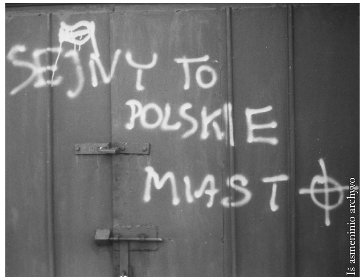
Užrašas Seinuose „Seinai – tai lenkiškas miestas“. 1996 m.

tarkime, kas įvyko 1990 m. kovo 11 d., lietuviai žino ne tik todėl, kad tai buvo svarbus įvykis tautos gyvenime, tam tikro proceso kulminacija, bet ir dėl to, jog daugelis kitų įvykių, kurie jų gyvenime vyko, buvo ir yra susiję su šia data ligi šiandien. Nekalbu apie šventinius koncertus, mitingus ar kitais būdais reiškiamą meilę tėvų ir protėvių žemei. Turiu omenyje labai paprastus dalykus, kurie pakeitė lietuvių gyvenimą. Tarkime, atsirado nepalyginamai didesnės galimybės keliauti, studijuoti, dirbti, pirkti, parduoti, skraidyti, žaisti, planuoti ir t. t. Paskelbus nepriklausomybę šalies transformacijos procesas buvo ir vis dar yra skausmingas, tačiau kad lietuviai 1990 m. pasirinko teisingą kelią, matyt, niekas neabejoja. Lietuvos nepriklausomybės atkūrimas tapo tvirčiausiu pamatu, kuris leido planuoti ir kurti geresnę ateitį. Tai atsispindėjo ir atsispindi