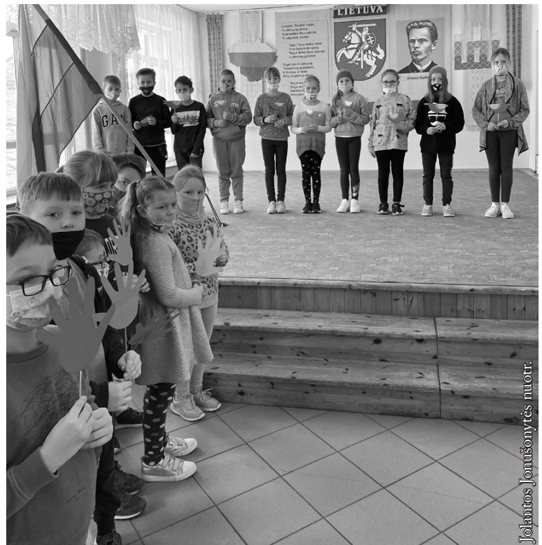
Vasario 16-oji Punsko mokykloje

Pradinių klasių mokytojos vieningai teigia, jog tiesioginis – kontaktinis ugdymas, tai tinkamos emocinės savijautos bei mokymosi sėkmės pagrindas.