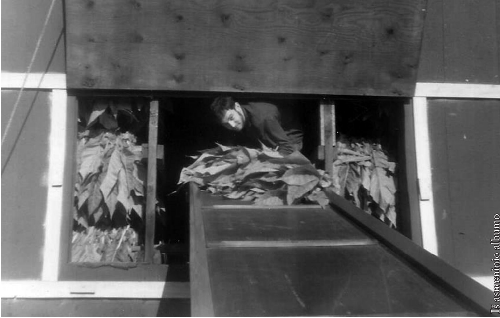
Tabakas kabinamas džiovykloje