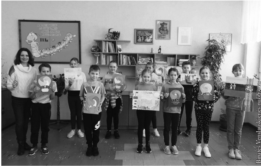
III a kl. mokiniai su auklėtoja

Vasario pradžioje gavome pasiūlymą dalyvauti tarptautinėje pradinėjų klasių mokinių dailės darbų parodoje-konkurse „Čia mano Lietuva“, skirtoje Lietuvos Nepriklausomybės ir Valstybės atkūrimo dienoms paminėti. Šį konkursą surengė Alytaus Likiškėlių progimnazijos mokytojos. Organizatorės sulaukė 987 kūrybinių darbų iš Latvijos, Lietuvos mokyklų bei... mūsų mokyklos darbelių. Mokiniai įvairiomis piešimo technikomis ir raiškos priemonėmis atskleidė Lietuvos istoriją, pavaizdavo krašto grožį, kaimus, miestelius, papročius ir tradicijas bei valstybingumo simbolius, taip išreikšdami meilę ir pagarbą Tėvynei.