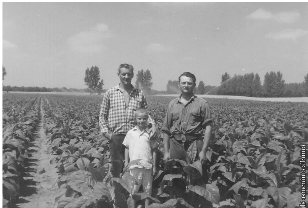
Tabako laukas laistant (matyti purškiamas vanduo)

Kai dirbau pas pirmą ūkininką, šeima bendravo su našle, pas kurią ūkyje augino pusininkas. Savininkė dengė ūkio išlaidas, o pusininkas – darbo išlaidas. Už paruoštą tabaką gautus pinigus pasidalindavo per pusę. Su ūkio savininke artimai