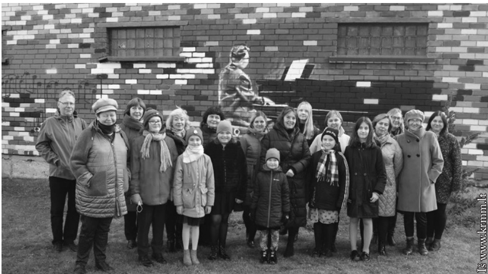
Prie Kazlų Rūdos muzikos mokyklos pastato