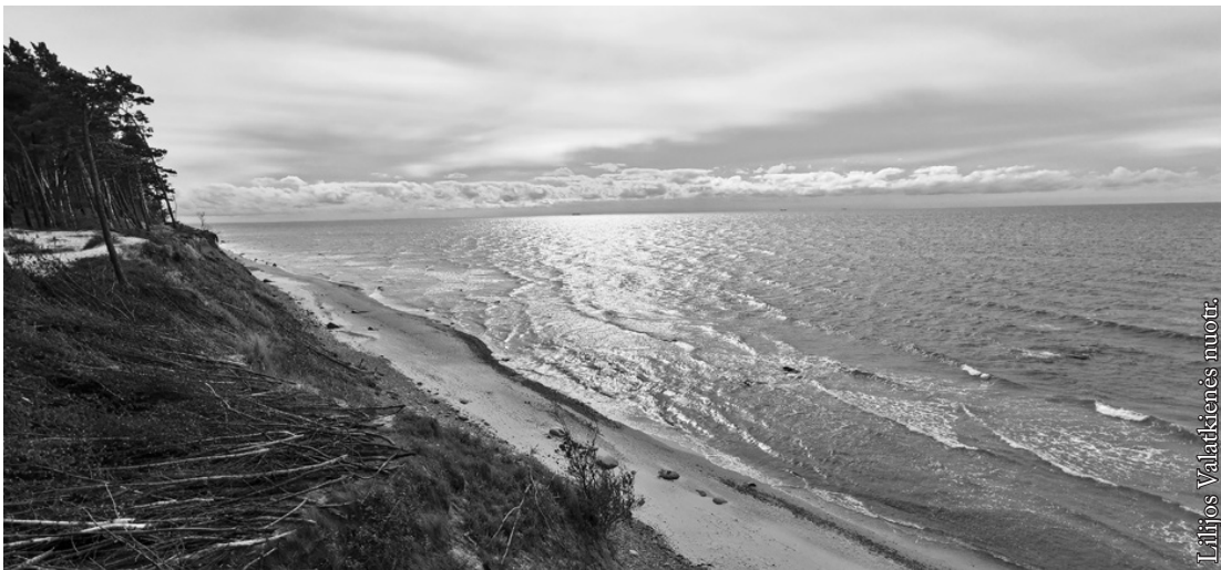
Nuo Olando kepurės skardžio plačiai atsiveria jūra