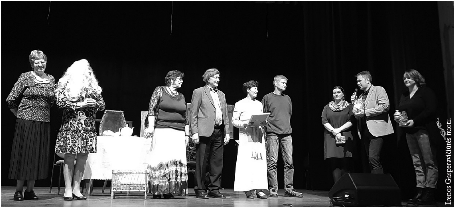
Seinų mėgėjų teatras „Kultuvė“