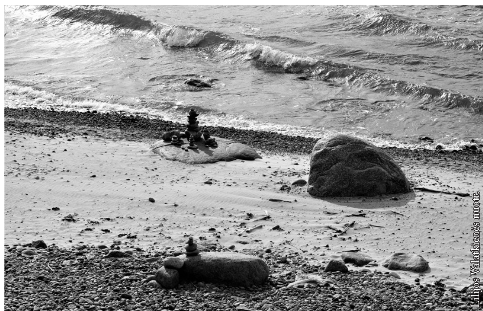
Iš plokščių akmenėlių knieti bokštus sudėlioti

Žygeivius Litorinos pažintinis takas veda skardžiais Baltijos jūros pakrantėje. Šie skardžiai – tai išlikusi