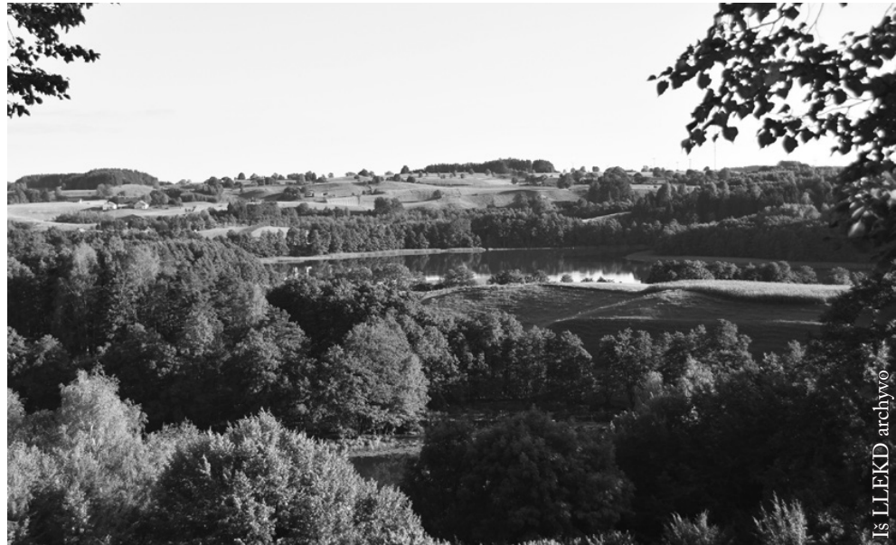
Vaizdas nuo Šiurpilio

Mūsų tyrinėjimų teritorijoje yra didingas Šiurpilio piliakalnis, nuo kurio atsiveria platus apylinkės vaizdas. Tai buvusi pagrindinė sūduvių gyvenvietė. Natūralios gamtinės kliūtys ir įrengti įtvirtinimai sudarė visą platų gynybinį kompleksą, kuris, manoma, prilygo kitoms panašioms vietoms tuometinėje Lietuvoje. Nepaisant to, XIII a. pabaigoje ši pilis buvo kryžiuočių užkariauta. Melno sutartimi 1422 m. ši teritorija atiteko Lietuvos didžiajam kunigaikščiui. Po to į ją pradėjo keltis lietuviai nuo kairiojo Nemuno kranto. Jie atsinešė ir daugelį pavadinimų. Iki šių dienų Suvalkų kraštovaizdžio parke ir apylinkėse išlikę vietovių ir vandenių pavadinimai stebina ne vieną keliautoją.