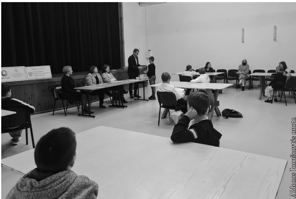
Lietuvių kalbos ir literatūros konkursas