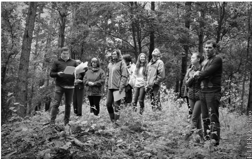
Lankome Paseinėlių piliakalnį

Projektą finansavo Lietuvos kultūros taryba.