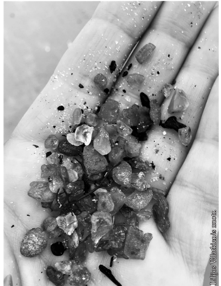
Gintarėliai delne – džiaugsmas širdyje

Olando kepurės vieta pradėta žymėti maždaug XVII amžiaus pabaigoje,