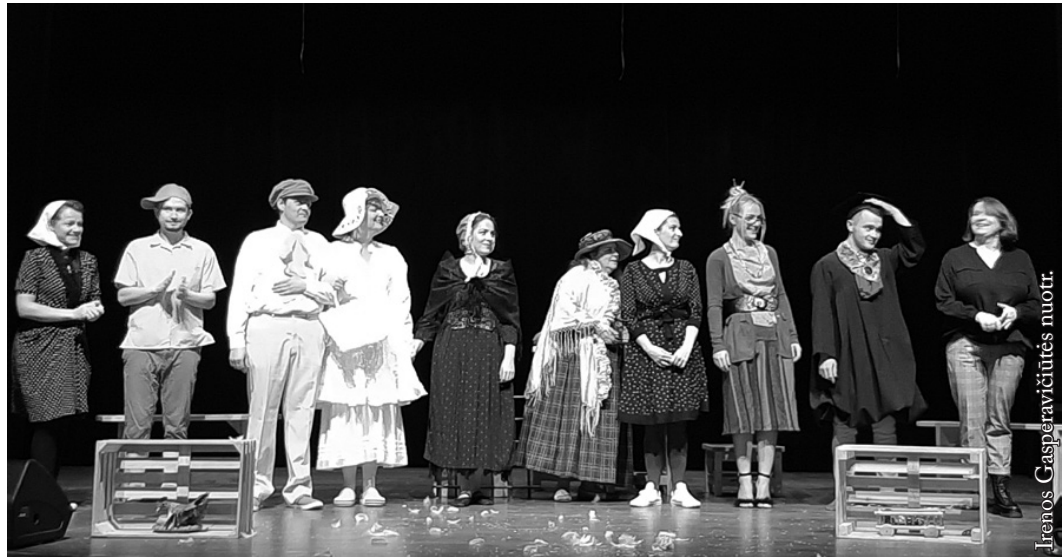
Punsko lietuvių kultūros namų klostimo teatras