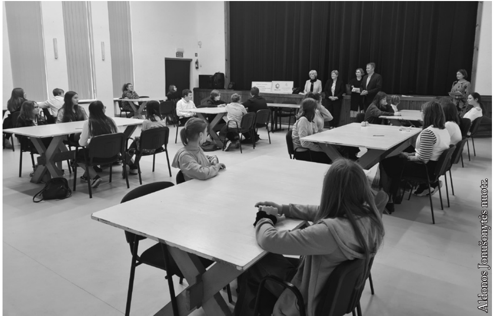
Lietuvos istorijos konkursas

Jau daugelį metų Lenkijos lietuvių draugija (LLD) rūpinasi lietuvių švietimu mūsų krašte. Skatina mokinius domėtis lietuvių literatūra, Lietuvos geografija ir istorija, ugdo pilietiškumą, puoselėja tautinius jausmus ir istorinę atmintį. Todėl Punsko-Seinų-Suvalkų krašto lietuviškų švietimo įstaigų (vaikų darželių, pagrindinių mokyklų, licėjaus) mokiniams organizuoja dailiojo žodžio, lietuvių kalbos, Lietuvos istorijos ir geografijos konkursus. Jų tikslai: skatinti vaikų ir jaunuolių susidomėjimą lietuvių literatūra, gilinti jų žinias apie lietuvių rašytojus; gilinti žinias apie istorinę šalies praeitį bei geografiją; tobulinti lietuvių kalbos įgūdžius, skatinti taisyklingai kalbėti; skiepyti meilę gimtajam kraštui ir Lietuvai; ugdyti jaunimo pilietiškumą; skatinti ir tvirtinti Lenkijos lietuvių vaikų ir jaunimo tautinį tapatumą.