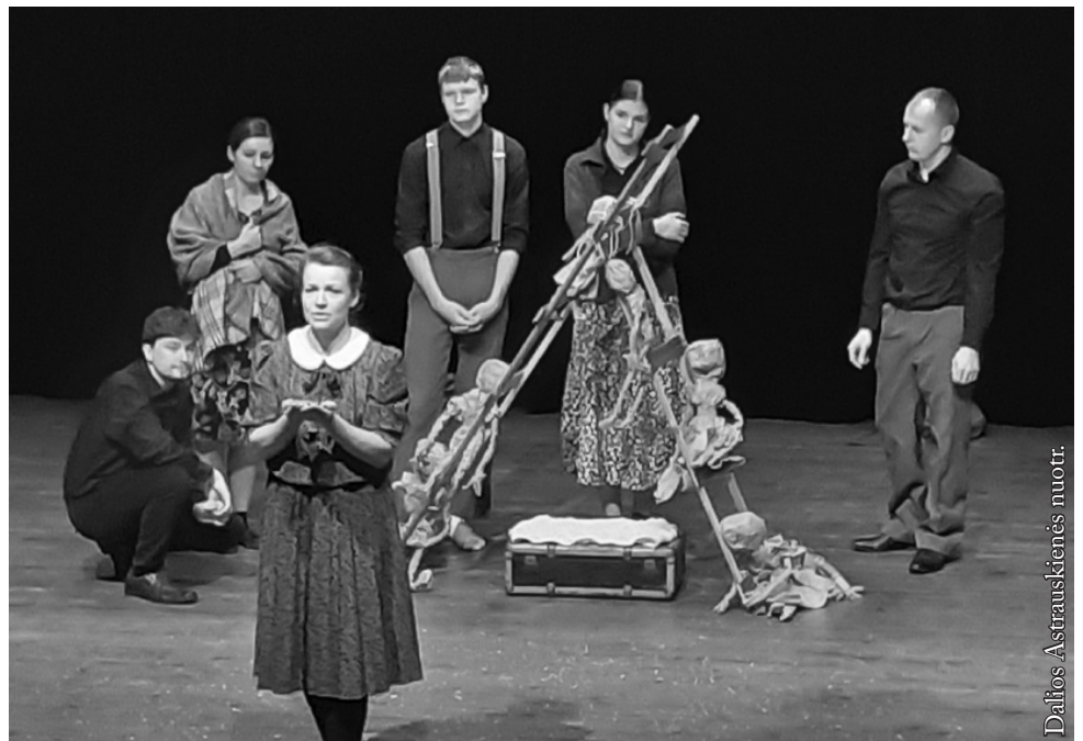
Suvalkų lietuvių teatras „Sūduva“

išmoksta vaidmenis ir kasmet naują veikalą parodo scenoje. Patys dvasiškai atsigaivindami vis nori ir kitus įtraukti ar bent pralinksminti. Ačiū, kad esate, susitinkate, vieni kitiems patariate, repetuojate, vaidinate. Sėkmės ir džiaugsmo lai Jums netrūksta.