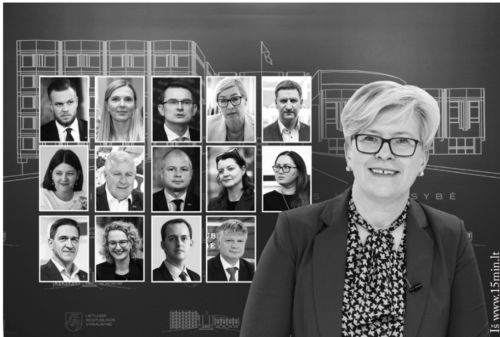
Patvirtinta Ingridos Šimonytės vyriausybė

smarkiai apsijuokė. Pasirodo, sankcijos lyg ir paskelbtos, bet trąšos ir toliau gabenamos (ir bus gabenamos) Lietuvos geležinkeliais ir per Klaipėdos jūrų uostą. Tokios pasirašytos sutartys, kurios numato ir šimtamilijonines baudas jas nutraukiančiai pusei. Lietuva, nutarusi būti sankcijų paskutiniam Europos diktatoriui smaigalyje, smarkiai apsisikaičiavo. Pasirodo, tų sankcijų esą keletas rūšių: yra europietiškos, yra amerikietiškos. Bet net JAV, smarkiausiai baranti A. Lukašenką už grubų kitaminčių slopinimą, žada pirkti baltarusiškas trąšas bent jau iki kitų metų pavasario!