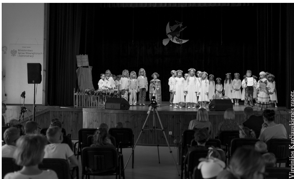
XXX vaikų teatrų festivalio „Raganė“ akimirka

Nuoširdžiai dėkojame visiems rėmėjams. Be Jūsų paramos nebūtume galėję tiek nuveikti.