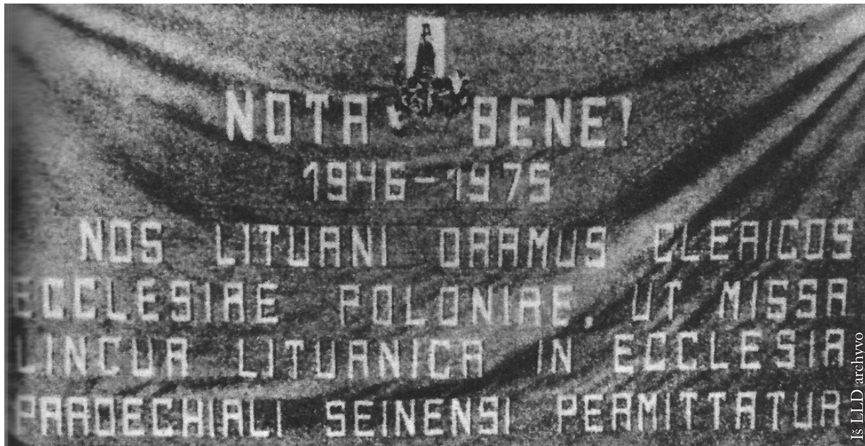
Plakatas su užrašu: „Įsidėmėk! 1946–1975 m. mes, lietuviai, meldžiame Lenkijos bažnyčios dvasininkiją, kad Seinų parapijos bažnyčioje mišios būtų laikomos lietuvių kalba“

parapijai. Tai truko iki 1983 m. Nei Lenkijos saugumas, nei Bažnyčios hierarchai nesugebėjo tokia neįprasta forma reiškiamo protesto užgniaužti ir nuslopinti. Šiandien jau pasiekiami archyviniai šaltiniai atskleidžia analogų neturinčius faktus. Gilaus socializmo metais Bažnyčios atstovai ryždavosi kreiptis net į Liaudies Lenkijos saugumo tarnybą (tą tarnybą, kuri juos pačius persekiojo) ir prašyti pagalbos užgniaužti lietuvių maldas Seinų bazilikoje.