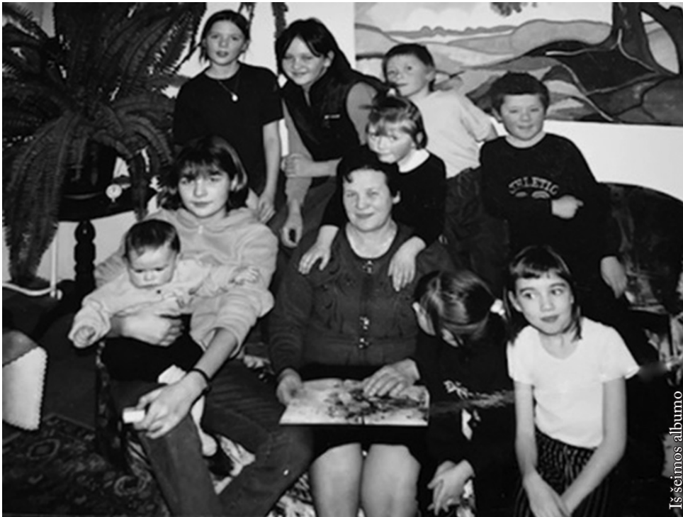
Su anūkais 2002 m.