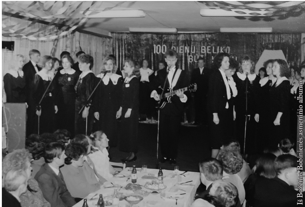
Šimtadienis 1992 m.

L aikas bėga nenumaldomai. Neįstengiamo jo sustabdyti. Tai gal nėra blogai, nes net ir gražiausios akimirkos – jeigu mes jas imtume ir sustabdytume – ilgainiui taptų paprastos ir nebeįdomios. Taip ir mums, tėvams, tie 18 ar 19 metų auginant vaikus prabėgo akimirksniu. Gal dėl to, kad vejami kasdienių džiaugsmų ir rūpesčių buvome įpratę nuolat gyventi judėjime vaikus auklėdami. Kaip keista suktis gyvenimo sukury: atrodo, vakar tuos savo mažylis gimdėme, sūpavome, nešiojome ant rankų, už rankutės paėmę vedėme į darželį, paskui mokyklą, o galiausiai – jau iš tos mokyklos išlydime... Buvo smalsu ir gera stebėti, kaip jie augo, vystėsi, kaip kiekvieną dieną mokėsi žengti vis naujus žingsnius, stiebėsi subrendusio žmogaus pasaulio laipteliais... O grįžtant dar daugiau į praeitį – rodo, dar taip neseniai mes patys, dabartinių abiturientų tėvai, su