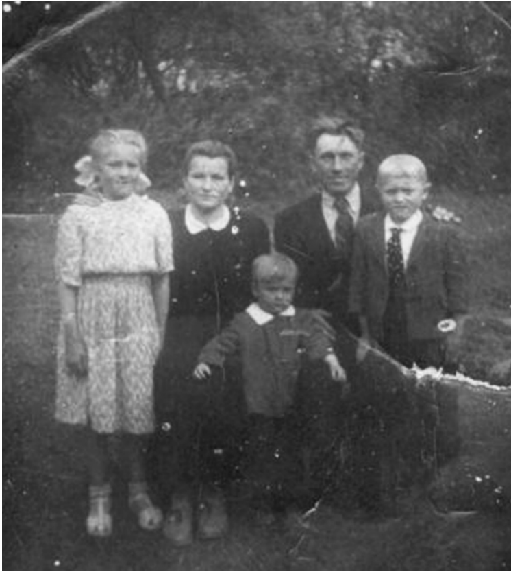
Mažas Jurgis su tėvais

Rakucevičius vis manį prašė siūc, tai pora nedėlių nuveina, kol šaimynų apsiuvu, bagi dzidelės šaimynos visur.