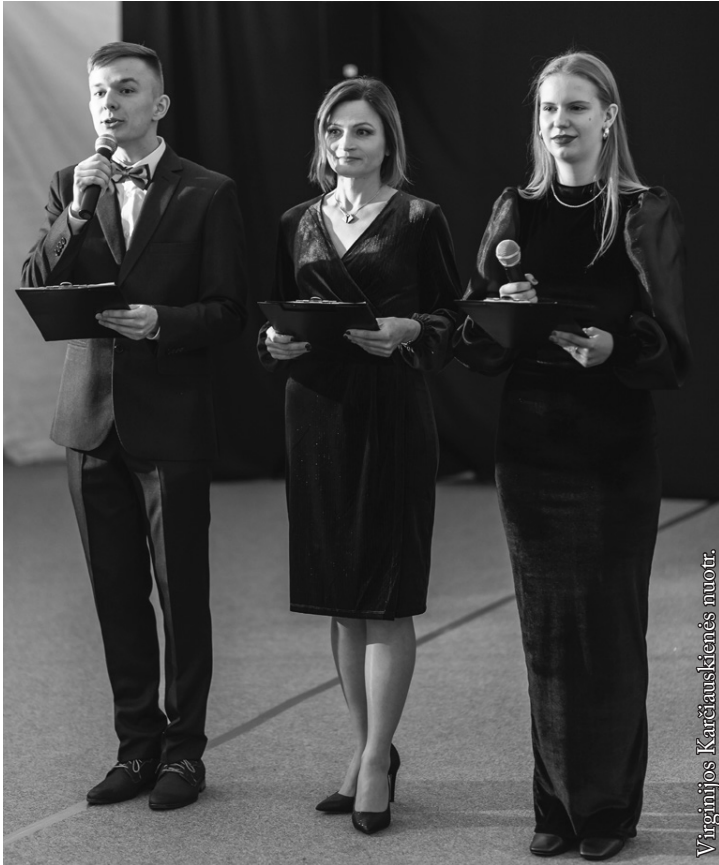
Susirinkusius pasveikino abiturientų ir tėvų atstovai