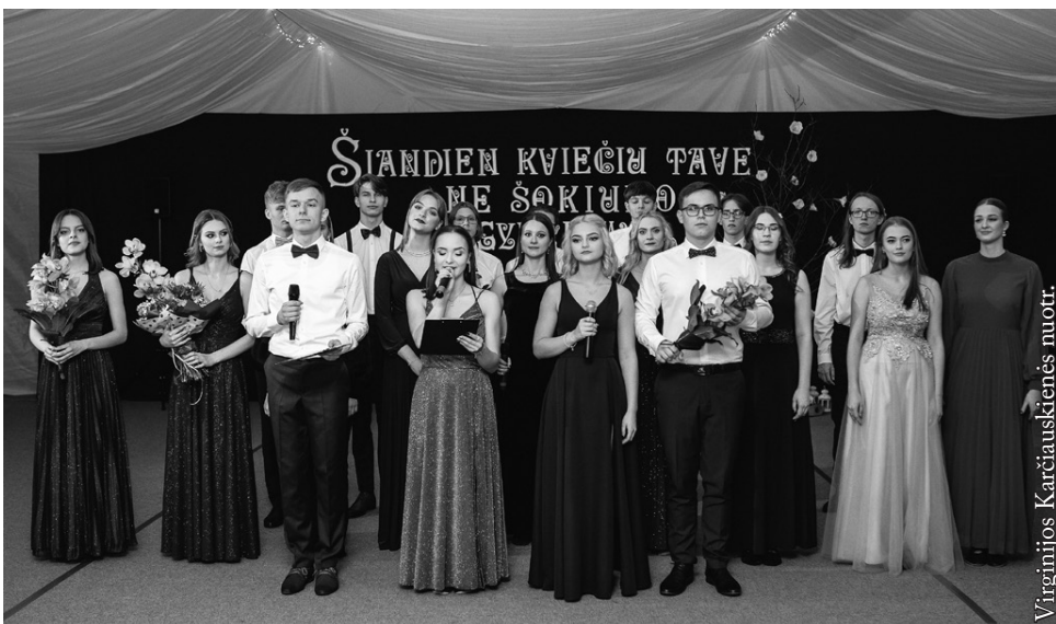
Šimtadienis 2022 m.

Mano Šimtadienis įvyko lygiai prieš 30 metų, 1992-aisiais, kai pasaulis atrodė dar visai kitaip nei dabar. Keistai nuskambėjo, ar ne? Lyg tai būtų buvę kitam amžiuje... Bet juk ir buvo... Prisimindama savo klasės Šimtadienį ir žiūrėdama to įvykio išlikusias tik kelias nuotraukas, lyginu jį su tuo, ką patyriau š. m. sausio 22 d. per savo dukros ir jos draugų šventę. Tai man savotiška retrospekcija, bet ir kiek daug skirtumų įžvelgiu!