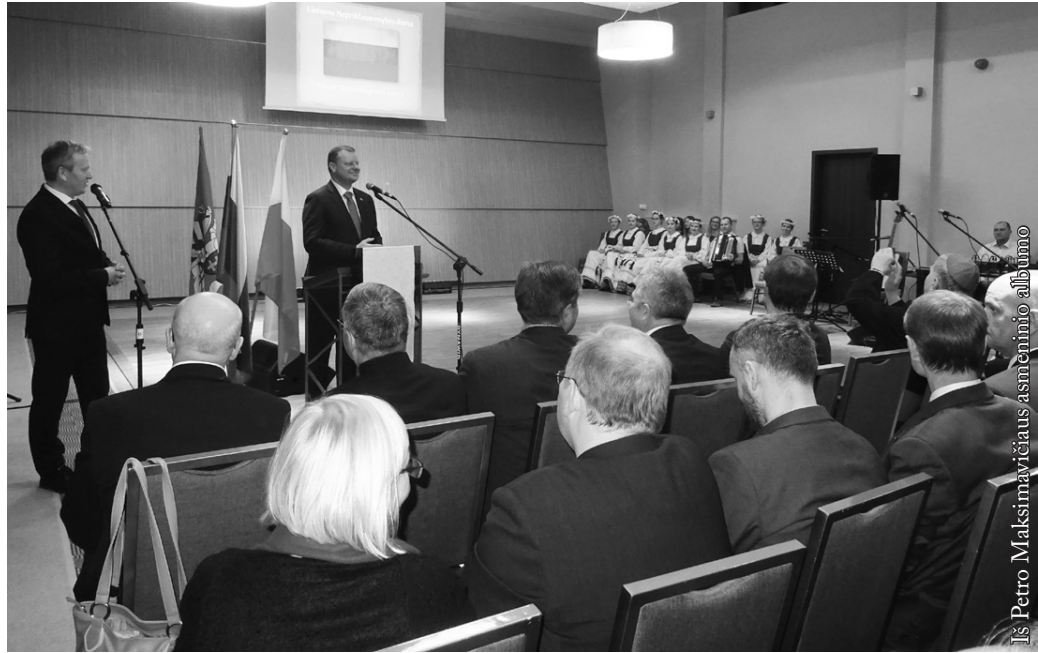
Vasario 16-osios minėjimas Suvalkuose 2019 metais. Kalba LR Ministras Pirmininkas Saulius Skvernelis

Jau daug metų šventėme Vasario 16-ąją ir dažnai banaliai kartojome žodžius apie nepriklausomybę. Ir štai dabar staiga tie žodžiai įgauna kitokią prasmę. Neseniai su savo pažįstamu diskutavome, kiek lietuvių stotų ginti Lietuvą ištikus nelaimėi. Nekalbu tik apie tiesioginį dalyvavimą ginkluotame pasipriešinime, bet apie visas įmanomas pasipriešinimo formas. Gal klystame, bet priėjome išvadą, kad abejingų labai mažai būtų. Net tas jaunimas, į kurį kartais žiūrime skeptiškai, kritikuojame, kad išskyrus mobiliųjų