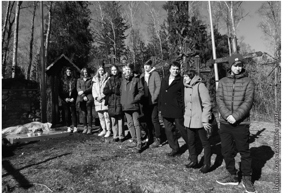
Seinų lietuvių „Žiburio“ aštuntokai Kalniškės mūšio vietoje