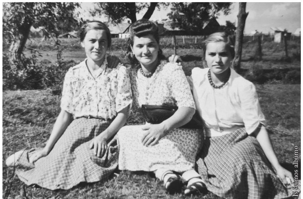
Iš šeimos albumo