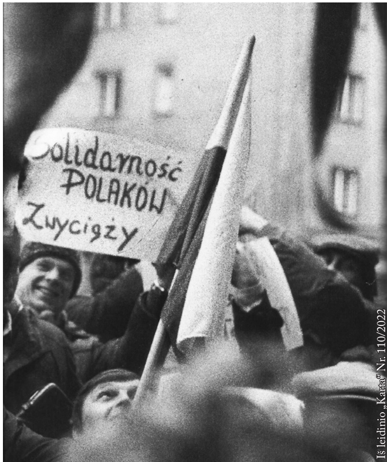
„Solidarność“. Varšuva, 1980 m.

1980-ųjų buvo europinio masto reiškinys ir toks išliko iki pat 1990 m. Tai nebuvo iš anksto sugalvotas politinis projektas. Jame masiškai dalyvavo eiliniai lenkai. Tik vėliau, kaip ir Lietuvoje, politinė poliarizacija šių pavadinimų supratimą gerokai sujaukė.