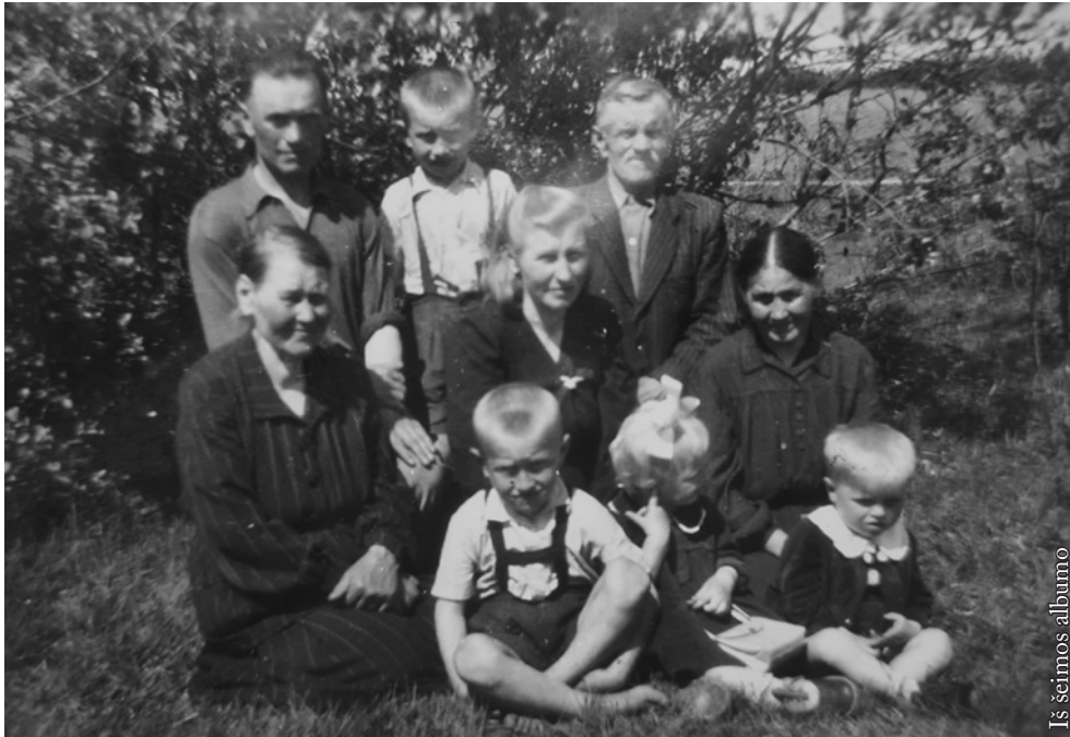
Iš šeimos albumo