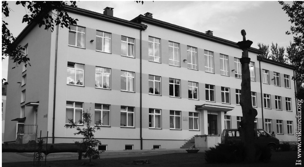
Vilniaus lietuvių namai

Iš Seinų lietuvių „Žiburio“ mokyklos konkurse dalyvavo pirmos,