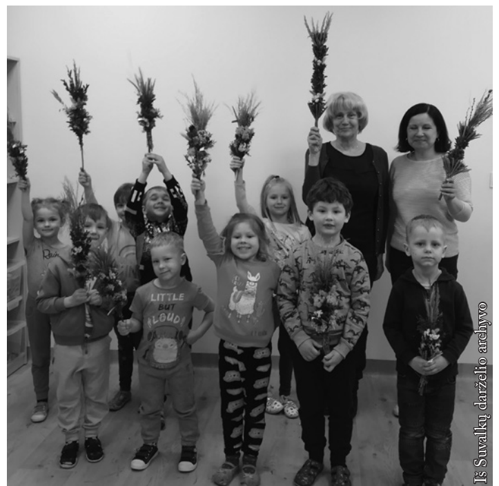
Iš Suvalkų darželio archyvo

Tai tik keletas tradicinių margučių raštų reikšmių. Jų yra daug daugiau. Svarbu išsaugoti juos kasmet marginant ir perduodant kitoms kartoms savo šeimose. Svarbu dalintis raštais ir marginimo būdais savo bendruomenėje, kad tame mažame ir trapiame daiktelyje išlaikytume dalį tautos savasties.