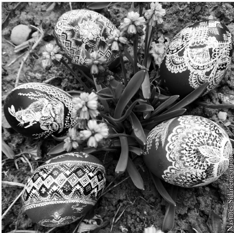
Izabelės Filevičienės margučiai

lietuvų juoda, ruda ir jų atspalviai. Tai žemės spalvos. Žemė duoda derlių, augina maistą žmonėms ir gyvūnams.