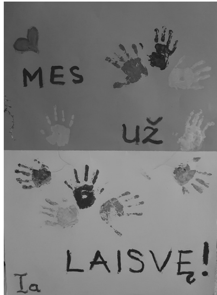
Punsko mokyklos I a kl. piešinys

J. S.: Nepykite, kad klausiu, bet ar Jūs įsivaizduojate, kas bus toliau? Nebijote pamatyti kitokią šalį? Ką Jūs dabar apie visa tai galvojate?