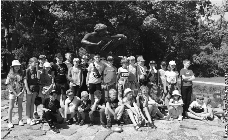
Prie skulptūros „Eglė žalčių karalienė“

basomis paplūdiniu Palangos tilto link. Dingo visas dienos nuovargis.