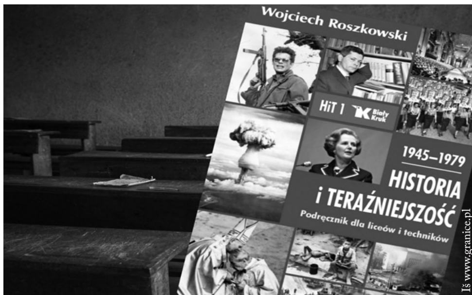
Vadovėlis „Istorija ir dabartis“

iškrypimai“ nereikėtų vadovėlyje vartoti, kadangi tai politinės publicistikos sąvoka ar autoriaus politinių pažiūrų perteikimas, o ne raginimas kritiškai vertinti tai, kas vyksta europinėje erdvėje ar Europos Sąjungos administracinėse struktūrose. Jie taip pat atkreipia dėmesį, kad vadovėlyje propaguojamas euroscepticizmas, gan neigiamai aprašomas Vokietijos vaidmuo kuriant ir plečiant Europos Sąjungą.