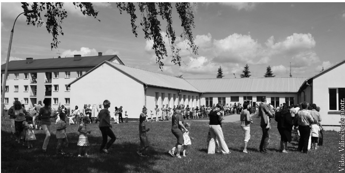
Pirmoji šeimos šventė

Kiekvienos šeimos gyvenimas yra toks skirtingas, kaip skirtingas esąs pievos gėlių margumas. Galime bandyti lygintis,