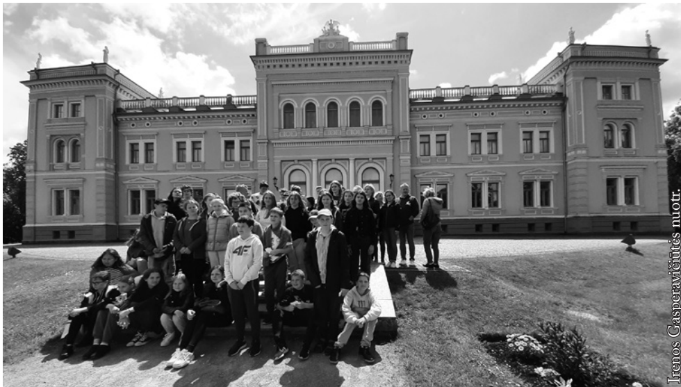
Prie Oginskių rūmų Plungėje