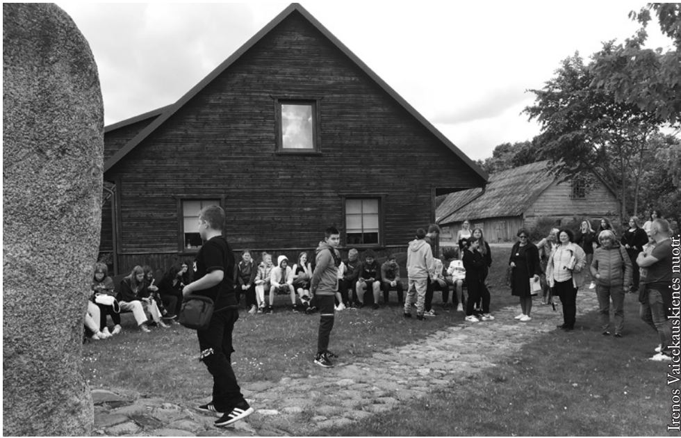
Vytauto Mačernio muziejuje Žemaičių Kalvarijoje