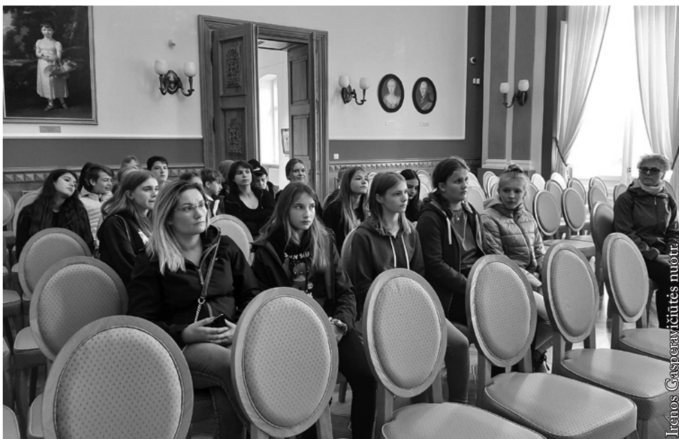
Edukacija „Ponų rūmų laisvalaikis“ kunigaikščio M. Oginskio rūmuose