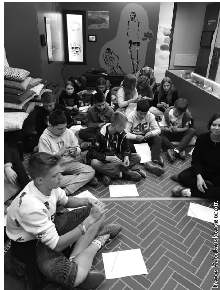
Edukacija „Kas mes? Nuo akmens amžiaus iki kuršių genties“ Plungėje

Kupini naujos patirties, pavargę, bet laimingi nuvažiuojame į Mingės kaimą, kur apsistojome nakvoti. Per kaimą teka upė Minija. Ji įteka į Kuršių marias. Kitą dieną nuplaukėme į Nidą. Lipome į kopas, žavėjomės nuostabiais vaizdais. Parnidžio kopa – tikras gamtos stebuklas. Ant jos 53 metrų aukštyje įrengtas Saulės