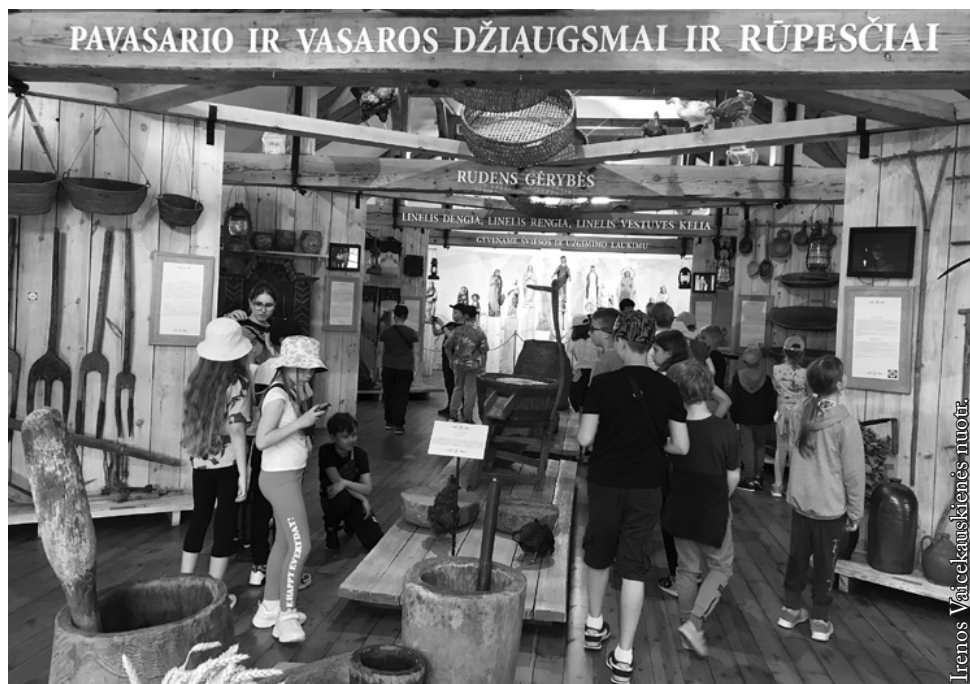
I–IV klasių mokinių išvykos akimirka

Birželio 9–10 dienomis Seinų lietuvių „Žiburio“ mokyklos I–IV klasių mokiniai dalyvavo ekskursijoje į Lietuvos pajūrį. Pažintinės edukacinės išvykos metu aplankėme grafų Tiškevičių dvarą Kretingoje. Palangoje lankėme grafo Felikso Tiškevičiaus ir jo šeimos dvarą, kuriame šiuo metu įkurtas Palangos gintaro muziejus. Susipažinome su gintaro istorija ir jo savybėmis. Didžiausią išpūdį paliko gintaro inkluzų paroda. Pasivaikščiujome viename iš gražiausių Šiaurės Europoje Birutės parke, užkopėme į Birutės kalną ir nusileidome tiesiai prie jūros. Buvo labai smagu ir įbristi į jūrą, ir keliauti