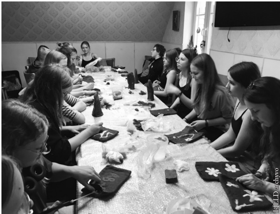
Edukaciniai užsiėmimai – vilnos vėlimas

karaimų atsiradimo Lietuvoje istoriją ir per pietus teko pažinti jų virtuvės paslaptis, ekskursijos dalyviai paragavo karaimų pyrago kiubėtė.