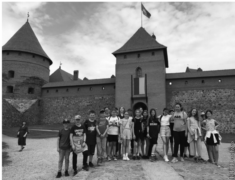
Lankėme Trakų pilį

Šių metų balandžio ir gegužės mėn. Lenkijos lietuvių draugija surengė dailiojo žodžio, lietuvių kalbos ir literatūros, Lietuvos istorijos ir geografijos konkursus. Juose dalyvavo visų mūsų krašto lietuviškų mokyklų mokiniai ir darželių auklėtiniai. Jauniausieji laureatai laimėjo dovanas, vyresniųjų klasių mokiniai – kelialapius vykti į ekskursiją.