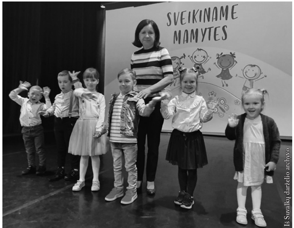
Iš Suvalkų darželio archyvo