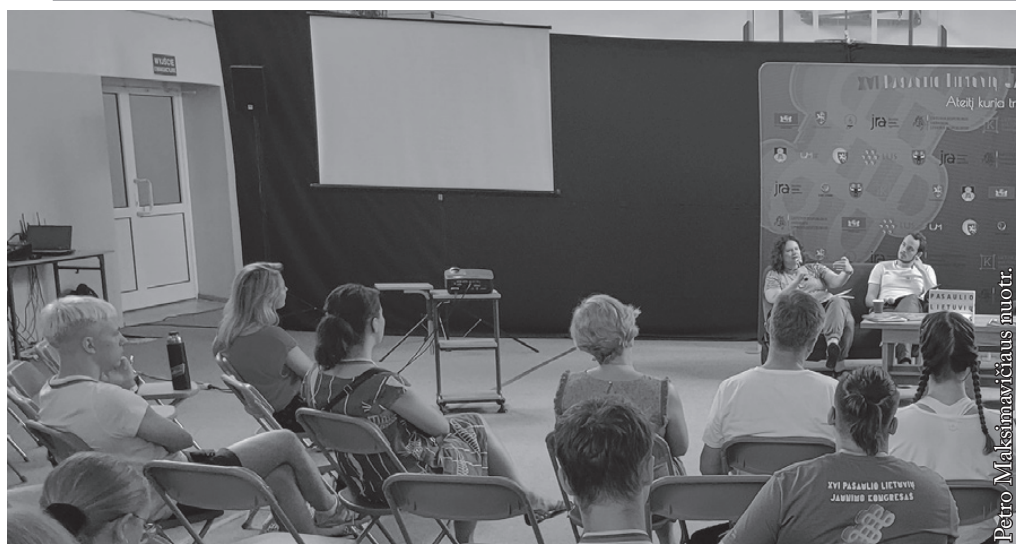
PLJK forumas Punske

girdimi, ir ne tik „Boružėlėje“, bet taip pat kitose parduotuvėse, turgavietėje, degalinėse, gatvėje... Prisiminęs kokius, tarkim, 1986 m., galiu drąsiai sakyti, jog įvyko didžiuliai pakitimai. Jau niekas gatvėje ar parduotuvėje išgirdęs kalbant lietuviškai neatkreipia dėmesio, kad Seinuose viešose vietose reikia kalbėti valstybine kalba. Šiandien toks „reikalavimas“ atrodytų juokingas ir būtų visiškai beprasmiškas. Buvęs ir kitas gretutinis poveikis. Lankydami parduotuvėje dažniau išgirstame, kad „bulkutės“ tai bandelės, o „makrelė“ tai skumbė ir t. t. Žinoma, Seinai tai ne Punksas, nors ir Punske dažniau išgirsti taisyklingesnę lietuvių kalbą niekam nepakenktų.