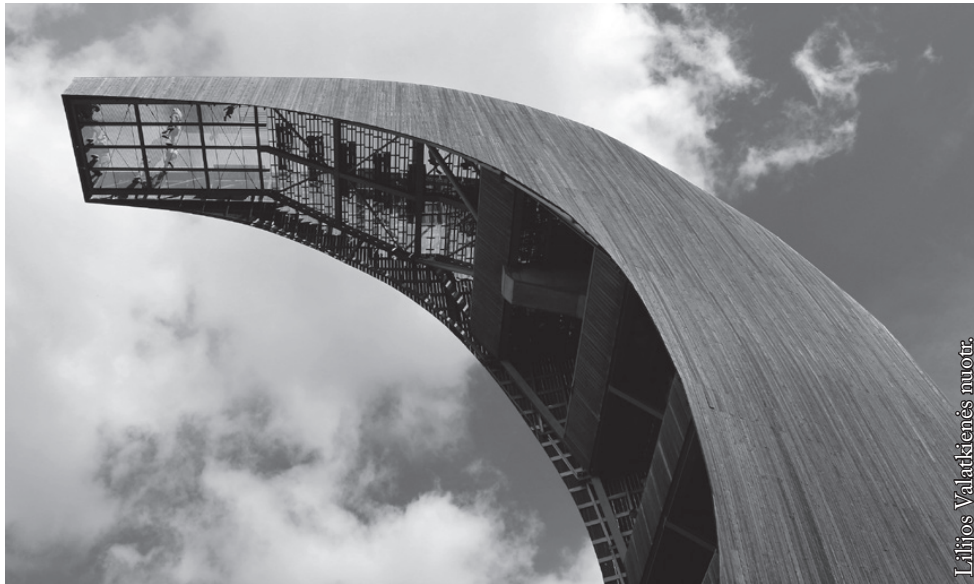
Įlipę į išpūdingą apžvalgos bokštą, pasijusite pasiekę debesis