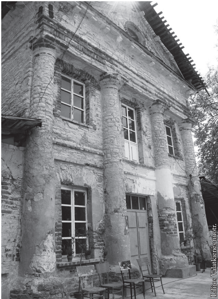
Restauruojamas Mantagailiškių dvaras