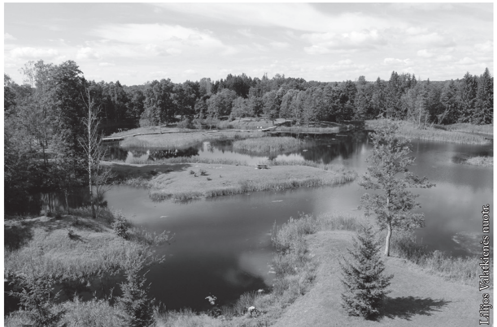
Kirkilų ežerėliai susiformavo iš smegduobių

Karvės ola yra karstinė smegduobė su ola – unikalus Biržų apylinkių gamtos paminklas. Spėjama, kad jai apie 200 metų. Ji atrodo kaip didelė duobė su uolienų fragmentais