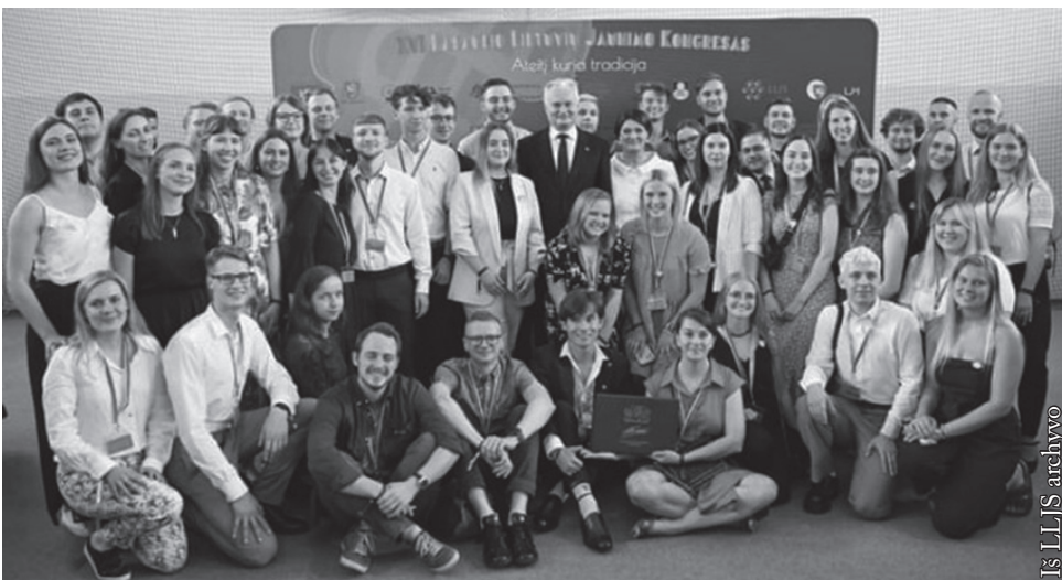
PLJK dalyviai su LR prezidentine pora Gitanu ir Diana Nausėdomis