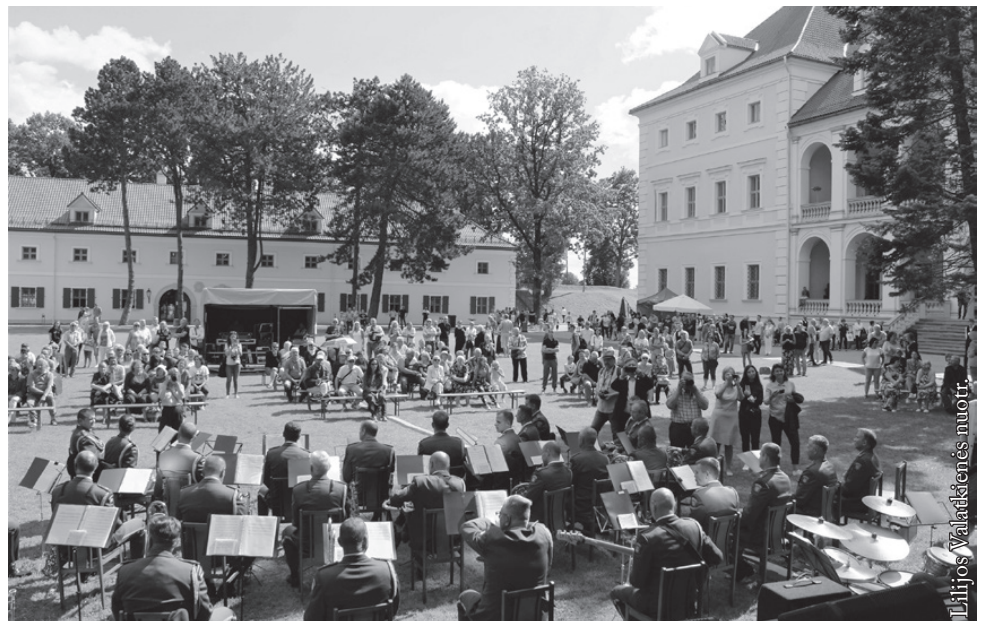
Biržų pilies kieme vyksta vasaros šventės

Kunigaikščio Kristupo II Radvilos iniciatyva 1637 m. prasidėjo didžiuliai tvirtovės pertvarkymo darbai. Tai buvo ne tik pilies atstatymas, bet ir perstatymas, pasikeitė fortifikacijos