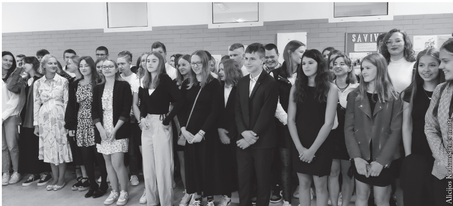
Mokslo metų pradžia Punsko licėjuje

projektas, finansuojamas Lenkijos vyriausybės lėšomis. Jį įgyvendinant I–V klasių mokiniams bus parūpinta vaisių, daržovių ir pieno.