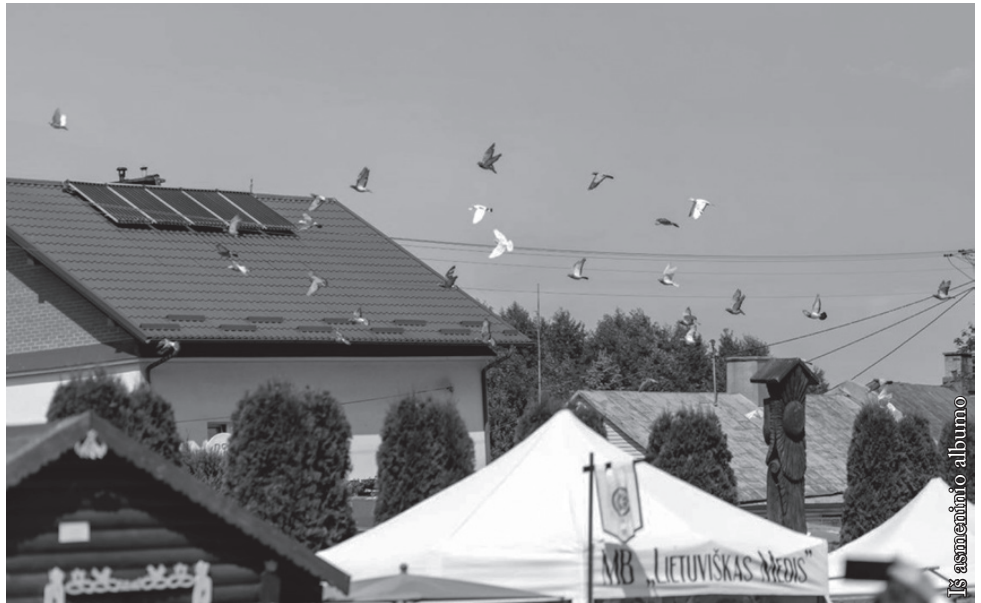
Balandžiai Punsko padangėje