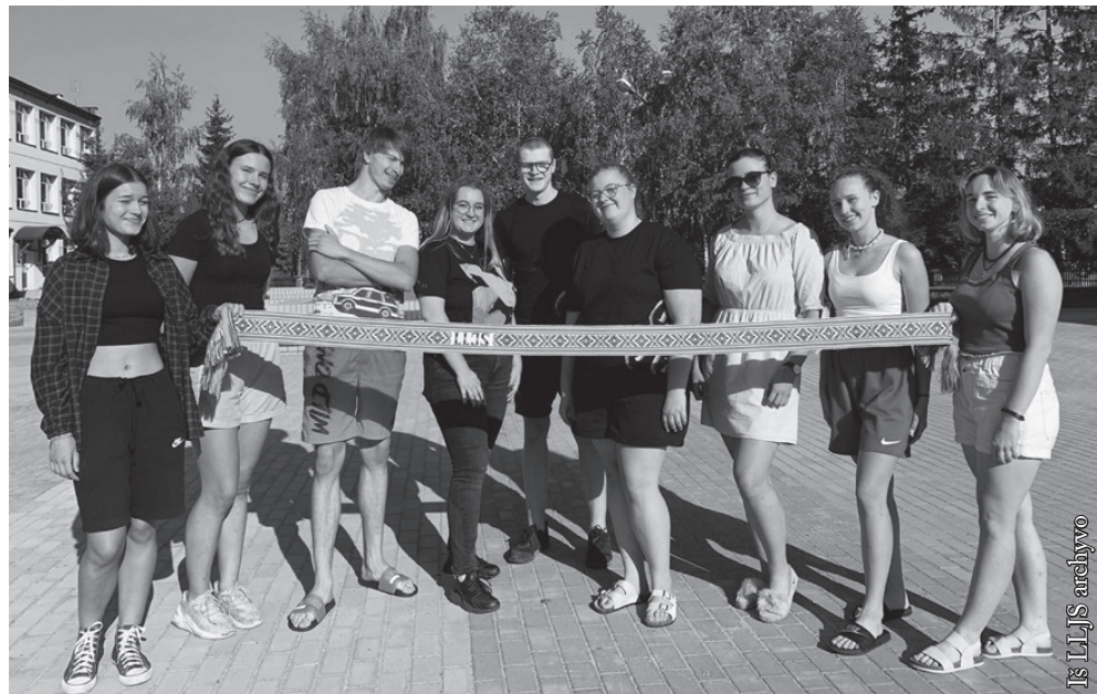
Naujai išrinkta LLJS valdyba