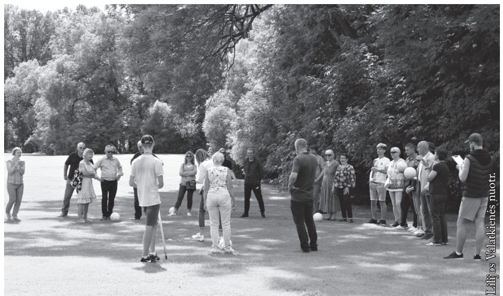
Komandos pasiruošusios montebolo žaidimui

Rezervuokite savo dieną geriausiems išpūdžiams Biržuose!