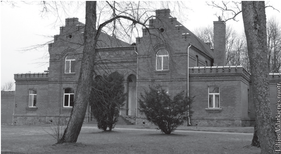
Butautų dvaras stovi visai netoli Latvijos sienos

žvejai, jaunavedžiai, vietiniai gyventojai, norintys pasigrožėti miestu, ežero ramybe ir su vėjeliu pasivaikščioti iki Astravo dvaro.