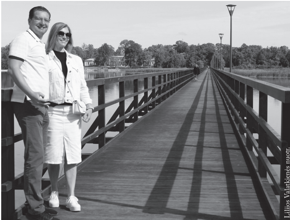
Ilgiausias Lietuvoje pėsčiųjų tiltas veda į Astravo dvarą

tipas, vietoj itališkojo buvo panaudotas nyderlandiškasis, kur pagrindinė detalė yra tvirtovę juosiantys žemių pylimai ir bastionai.