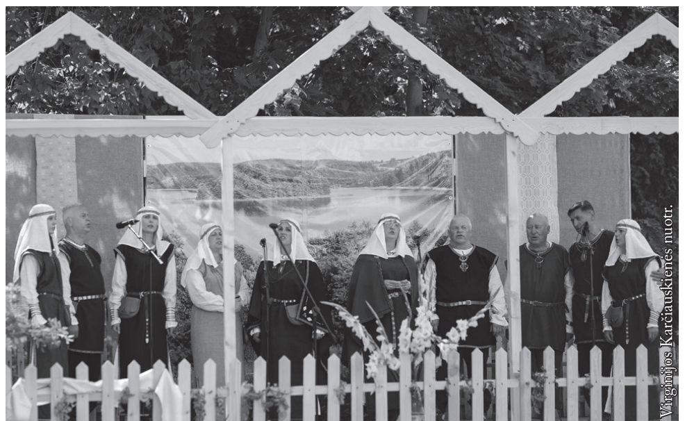
„Dainuviai“ iš Lazdijų kultūros centro

Festivalis prasidėjo bendra daina „O kieno žali sodai, Sūduvos žali sodai“. Ją išmoko visi draugijos folkloro kolektyvai. Po šios dainos vyko festivalio atidarymas. Pirmiausia pasirodė sutartinių giedotojos ir kanklininkės. Sutartinės – tai vienas seniausių lietuvių dainavimo būdų. Reikia manyti, kad jos skambėjo ir prieš 600 metų. 2010-aisiais lietuviškos sutartinės įrašytos į UNESCO nematerialaus kultūros paveldo sąrašą. Kitų ansamblių dainos buvo susijusios su karo tema. Nors karas