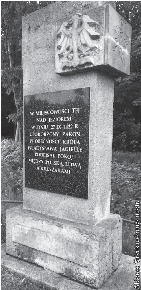
Paminklas pastatytas prieš penkiasdešimt metų

vok. Graudenz, lot. Graudentum arba Grudentia) apskrčiai. Pasibaigus paliauboms po Žalgirio mūšio Vytautas ir Jogaila vėl pradėjo karą prieš Ordiną. Šis, nesulaukdamas Vakarų ir popiežiaus pagalbos, buvo priverstas prašyti taikos. Kryžiuočiai įsipareigojo grąžinti Lietuvos Didžiąjai Kunigaikštystei senus dokumentus, kuriuos jie anksčiau buvo gavę ir kuriais grindė savo pretenzijas į žemes. Pagal Melno