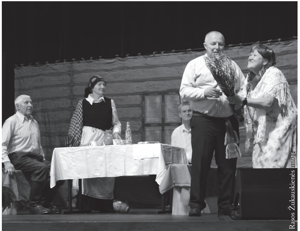
Seinų „Lietuvių namų“ klijimo teatras „Kultuvė“

Punsko kultūros namų klijimo teatras nukėlė žiūrovus į tarpukario Lietuvą. Jis parodė Kazio Binkio „Kriaučių Motiejų“. Pagrindinis veikėjas siekė karjeros, net norėjo