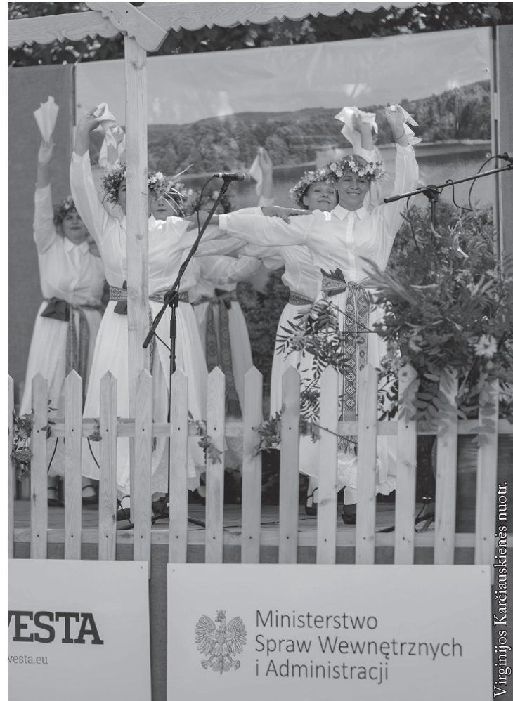
Suvalkų „Sūduvos“ ansamblis