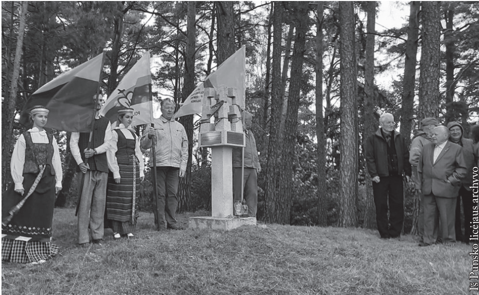
Lietuvos partizanų žūties vietoje Šlynakiemyje

direktoriaus šiltu priėmimu, kai kurie trumpai pasidalijo savo gyvenimo ir tremties prisiminimais.