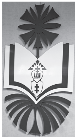
Garliavos Juozo Lukšos gimnazijos herbas