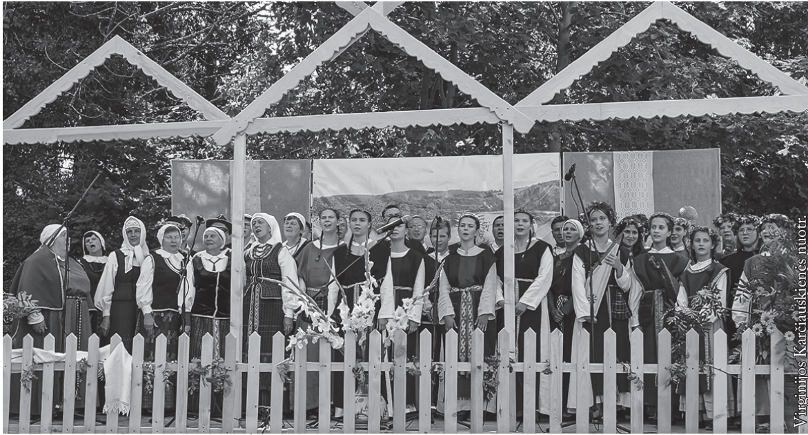
Lenkijos lietuvių etninės kultūros draugijos ansambliai

taiką ginčytinos žemės pripažintos Lietuvos Didžiai Kunigaikštystei. Kryžiuočių ordinui Melno taika buvo didelis smūgis, nes jis galutinai atsisakė pretenzijų į Žemaitiją. Taip pat buvo atskirti Kryžiuočių ir Livonijos ordinai. Kadangi Melno taika buvo nepatenkinti imperatorius Zigmantas ir popiežius, ji ratifikuota metais vėliau, 1423 m. gegužę, Veliuonoje, abiem šalims padarius nuolaidų. Imperatorius Zigmantas Melno taiką patvirtino 1423-03-30, sutartis įsigaliojo 1424-06-07. Ja nustatytos Didžiosios Lietuvos sienos be didesnių pakeitimų išsilaikė iki 1920 m. Ši taika nulėmė Mažosios Lietuvos raidą ir ilgaamžį jos gyvavimą. Civilizacijos požiūriu Melno taika buvusi lemtinga – baltų žemės buvo perskirtos pusei tūkstančio metų (iki 1919 m. Versalio taikos sutarties ir Klaipėdos krašto atskirimo 1920 m.), senosios Prūsos žemės (ir būsima Mažoji Lietuva) atsidūrė Šiaurės Vakarų Europos civilizacijos areale, o Didžioji Lietuva liko Vidurio ir Rytų Europos areale.