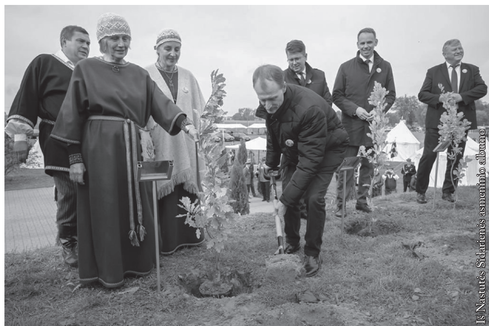
Sodiname Punsko ąžuoliuką

Kitą dieną traukėme namų link, bet pakeliui norėjome aplankyti kuo daugiau senųjų objektų. Sustojome prie Kvidzino pilies. Įspūdingas kryžiuočių statinys! Statyta XIV a. kvadrato formos su kampiniais bokštais