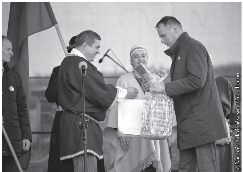
Sveikiname su lauktuvėmis Grutos viršaitį

Prasmingai praleidome dvi dienas Prūsų žemėje. Raginu ir kitus lietuvius nepamiršti senosios mūsų LDK istorijos, jos sienų ir didingos praeities. Kviečiu kuo dažniau lankyti šį kraštą. Dėl to, kad ten nuvykome, šventės metu skambėjo lietuviškas žodis (sveikinimus patys vertėme į lietuvių kalbą) ir daina. Manau, kad mūsų abu apsilankymai, susitikimai su Grutos viršaičiu duos vaisių ir ateityje, kad ant naujo paminklo, kurio kertinis akmuo pašventintas iškilmių metu, tikrai atsiras užrašas ir lietuvių kalba.