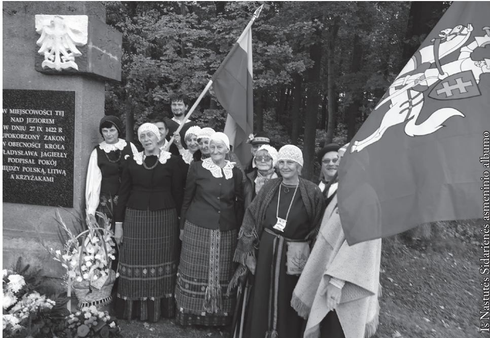
Padėjome gėlių prie Melno taikos sutarties paminklo

Po sveikinimų visi nuėjome sodinti atminimo ąžuoliukų. Vieną iš keturių pasodino mūsų delegacija. Prie ąžuoliuko metalinėje lentelėje įrašyta: