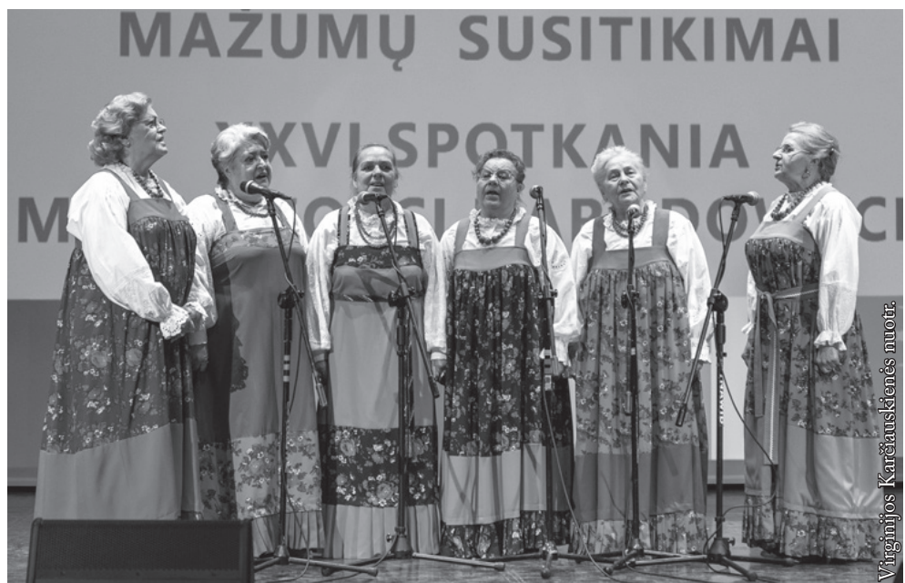
Rusių (sentikių) folkloro ansamblis „Riabina“ iš Antrojo Žarnovo