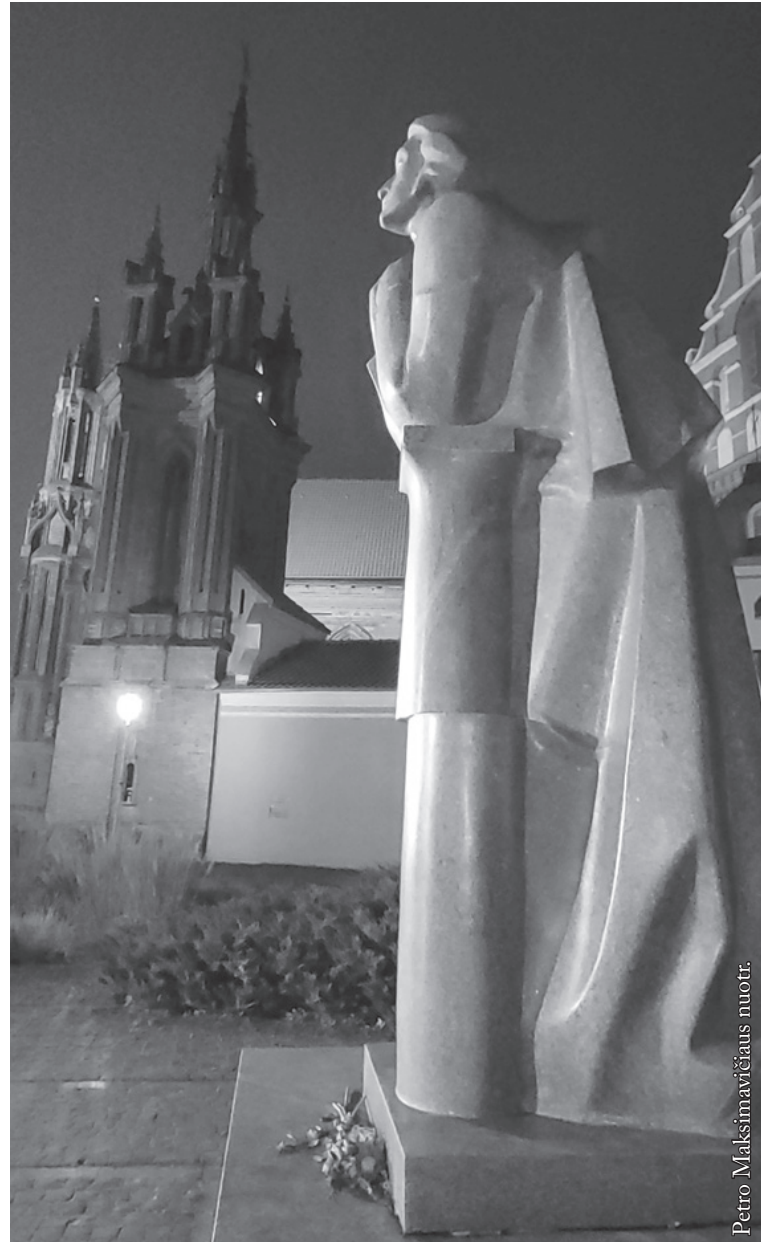
Adomo Mickevičiaus paminklas Vilniuje

Kodėl taip manė, ligi šiol nežinau, juolab kad praėjus daugeliui metų matyti, jog taip nenutiko. Vietoj paminklo Baranauskui siūlė Seinų centre pastatyti paminklą Lenkijos maršalui J. Pilsudskiui, kuris, pasak jo, labai mylėjo Lietuvą ir žymiai labiau ir ilgiau rūpinosi dviejų broliškų tautų likimu nei A. Baranauskas. Rodydamas Lietuvai ir lietuviams palankumą, paminklą A. Baranauskui siūlė statyti šalia statomų „Lietuvių namų“, bet jokių būdu ne