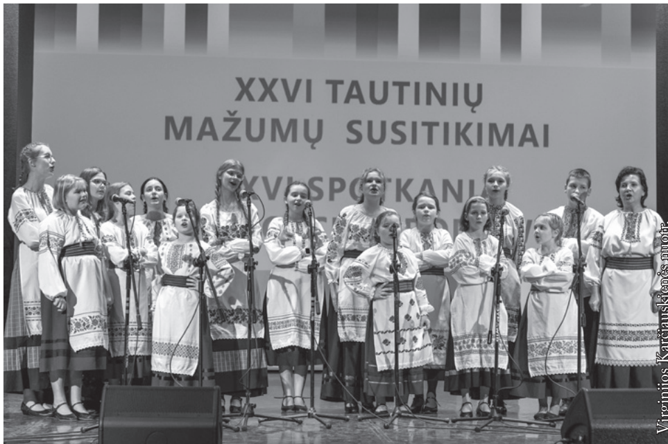
Ukrainiečių vaikų ir jaunimo folkloro ansamblis „Hiločka“ iš Čeremchos

ukrainiečių reakcijos. Nors jos labai smerkia Putino sužvėrėjimą, gyvena su kaltės jausmu dėl tokių niekšiškų savo tautiečių ir tautos vadų veiksmų. Pasidaliję savo nuoskaudomis ir baime dėl ateities visi priėjome prie išvados, kad besąlygiškai smerkiame Rusijos agresiją Ukrainoje, tačiau gyvendami vieni šalia kitų privalome rodyti pavyzdį, kaip tautos gerbia viena kitą, liudyti, kad žmogui svarbiausia yra taika, laisvė, kad niekas neturi teisės atimti jos iš kitų, spręsti už kitą tautą ar norėti ją išbraukti iš pasaulio žemėlapiu. Todėl mūsų renginys vyko sklandžiai ir taikiai.