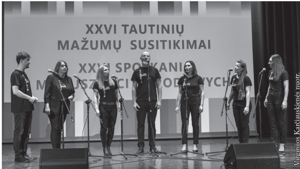
Suvalkų lietuvių ansamblis „Sūduva“ (vokalinė grupė)