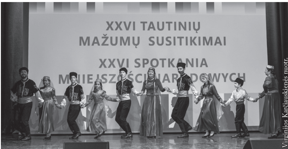
Totorių vaikų ir jaunimo folkloro ansamblis „Bunčuk“ iš Balstogės

Šie metai buvo ypatingi dar ir kitu atžvilgiu. Ukrainoje vyksta karas. Tai žiauri, pilna neapykantos ir nužmogėjimo Rusijos agresija, nukreipta prieš savarankišką ir nepriklausomą Ukrainos valstybę. Mes į Punską kvietėme tiek vienos, tiek kitos tautos atstovus – ir ukrainiečius, ir rusus. Ukrainiečiai važiavo pas mus drąsiai, didžiuodamiesi savo tautos didvyriais. O rusės sentikės tik atvykusios išsipašakojo, kad į Punską važiavo nedrąsiai, bijodamos ir publikos, ir pačių