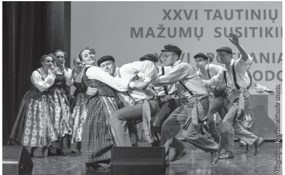
Punske LKN jaunimo šokių grupė „Vyčiai“

Tautinių ir etninių mažumų susitikimų tikslas – parodyti, kokioje įvairiakalbėje ir daugiakultūroje aplinkoje gyvename, ką turime bendro, kas mus skiria. Palenkės vaivadija – tarsi vitražas, nušvintantis įvairiomis spalvomis,