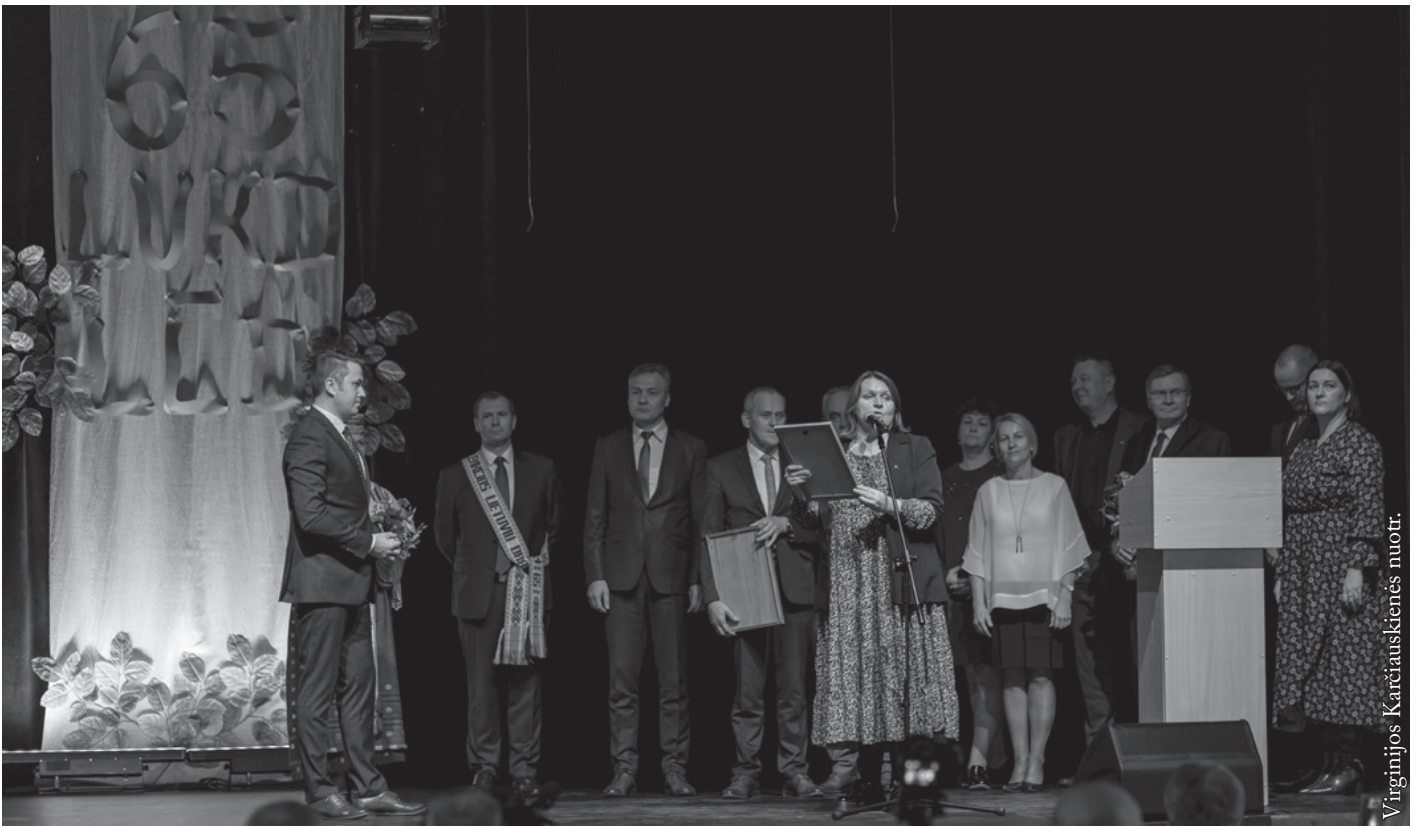
LLD jubiliejaus proga sveikina visų lietuviškų organizacijų ir mokyklų atstovai

darbą kuriant lietuviškas klases Krasnagrūdės mokykloje. Pirmininkas perskaitė tokio turinio raštą: „Ačiū už Jūsų iniciatyvą Seinų krašte, Krasnagrūdės mokykloje, įkurti lietuviškas klases. Tai buvo esminė po ilgų dešimtmečių pertraukos lietuviybės atgimimo pradžia šiame krašte. Dėkojame už Jūsų nuolatinį rūpinimąsi lietuvių kalba ir kultūra, indėlį rengiant Vėlinių koncertus Seinuose, vertingus straipsnius „Aušros“ puslapiuose.“