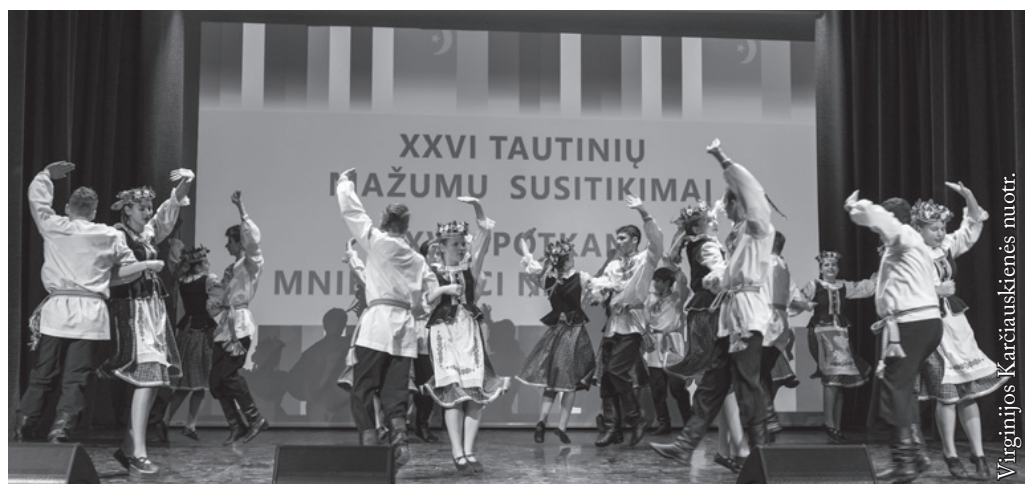
Baltarusių šokių ansamblis „Lavonicha“ iš Hainuvkos

Ministerstwo Spraw Wewnętrznych i Administracji