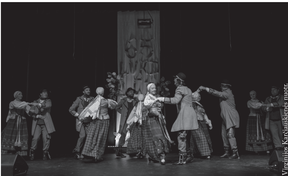
LLD jubiliejuje pasirodė „Seinos“ šokėjai