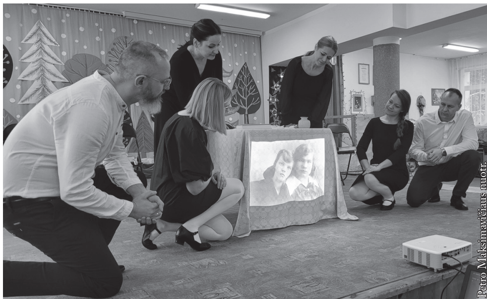
Suvalkiečių meno kompozicija apie Vincą Mykolaitį-Putiną

Diskutuota apie lietuviškų pamaldų Seinų bazilikoje atnašavimą. Pastebėta, kad vis dažniau pasitaiko atvejų, jog vienintelės sekmadienį lietuviškos šv. Mišios atnašaujamos lietuvių ir lenkų kalbomis. Taip pat svarstyta, kaip išvengti galimų nesutarimų įsteigus Seinuose vadinamąjį „Kresų muziejų“. Svarstyta, kaip atgauti priėjimą prie „Lietuviškos menės“ Seinų kunigų seminarijoje ir atnaujinti planus su Trakų muziejumi įrengti ją. Be to, siūlyta raštu kreiptis į Seinų miesto savivaldybę, kad būtų pasirūpinta A. Barausko paminklo apšvietimu. LLB pirmininkė pasiūlė 2023 metais minint Lenkijos lietuvių bendruomenės 30 metų jubiliejų surengti forumą ir jo metu diskutuoti svarbiausiais Lenkijos lietuviams klausimais. Pasak jos, toks forumas būtų naudingas rengiant šio krašto plėtros strategiją, išryškintų, kokia mūsų bendruomenė galėtų būti po 10–15 metų.