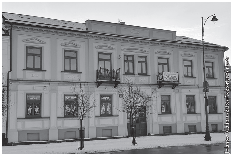
Būsima Suvalkų lietuvių mokykla iš gatvės pusės

Apie lietuvišką švietimą Suvalkuose kalbėta jau nuo seniai. 2017 m. vyko pirmi susitikimai su tėvais, siekta įsteigti lietuviškus kultūrinius vaikų būrelius, svajota apie vaikų darželį. Lietuvos Vyriausybės ir ŠMSM dėka nuo 2020 m. sėkmingai veikia Suvalkų lietuvių vaikų darželis. Šiuo metu jį lanko 25 vaikučiai, kurie ateityje tęs mokslus Suvalkų lietuviškoje mokykloje. Labai raginame Suvalkuose gyvenančius lietuvius leisti vaikus mokytis gimtąja kalba.