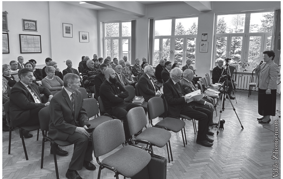
„Terra Jatwezenorum“ pristatymas Punsco valsčiaus konferencijų salėje

Pernykštę konferenciją atidarė, atvykusius svečius ir kitus dalyvius pasveikino istorijos paveldo metraščio