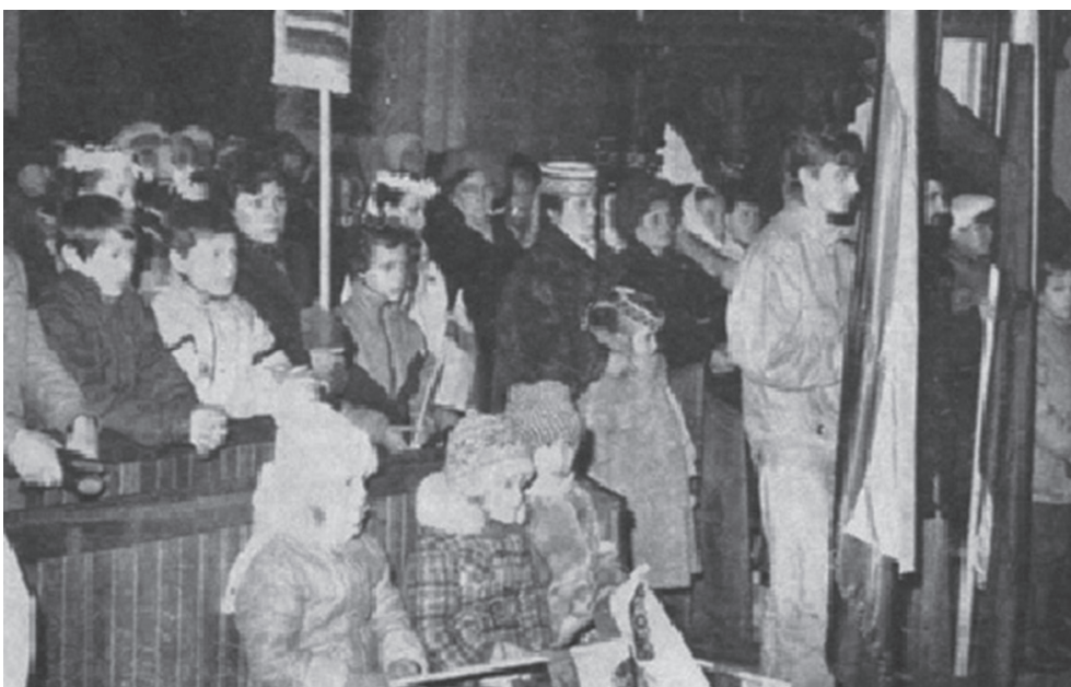
Šv. mišios Punsko bažnyčioje