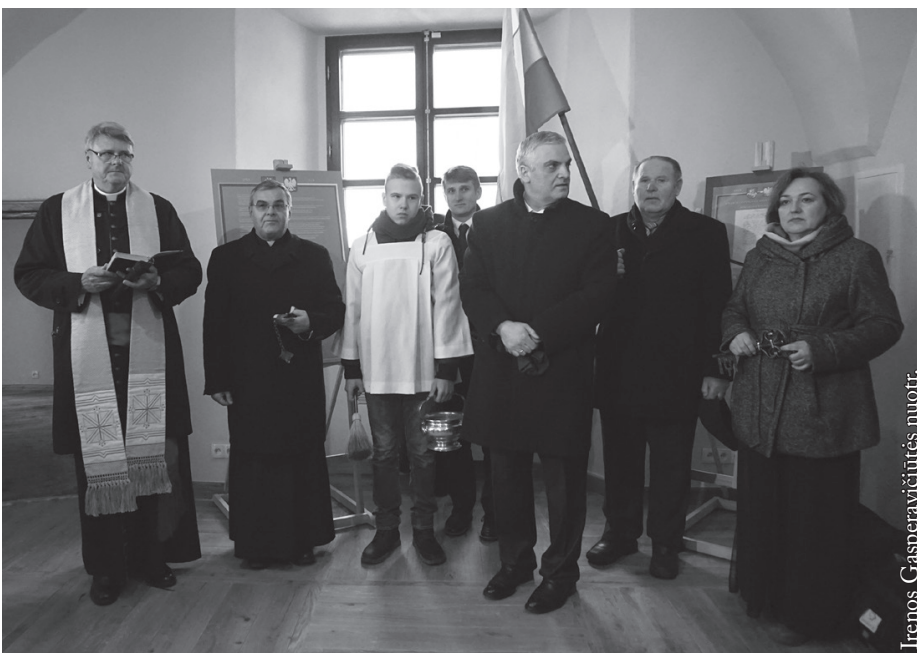
„Lietuviškos menės“ atidarymas ir pašventinimas 2018 m.