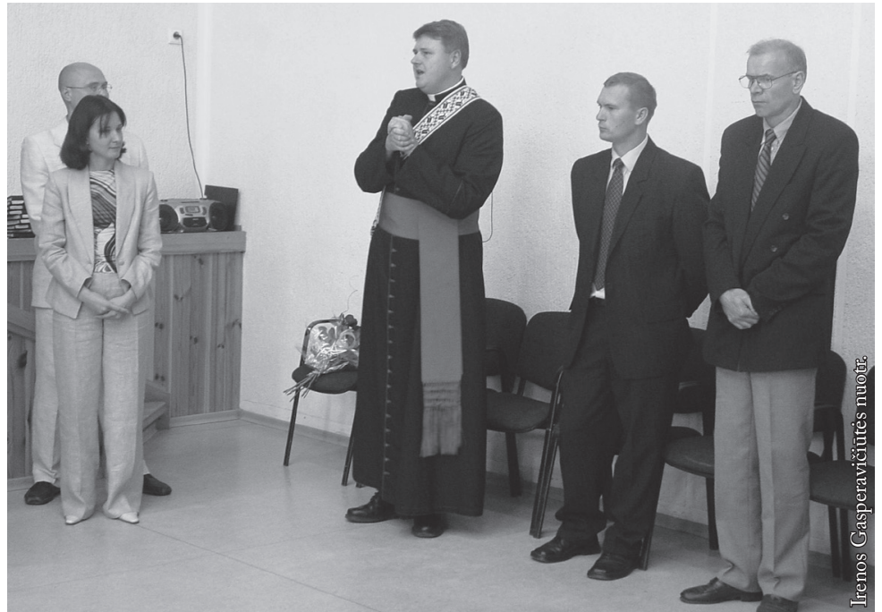
Seinų „Lietuvių namuose“ 2004 m.