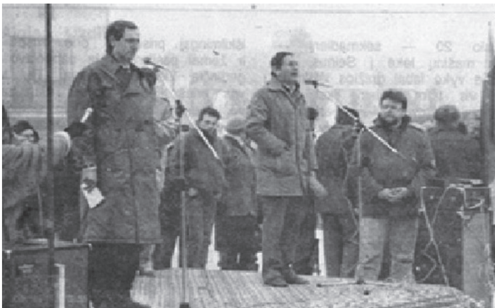
Demokratiųjų jėgų mitingas Punske