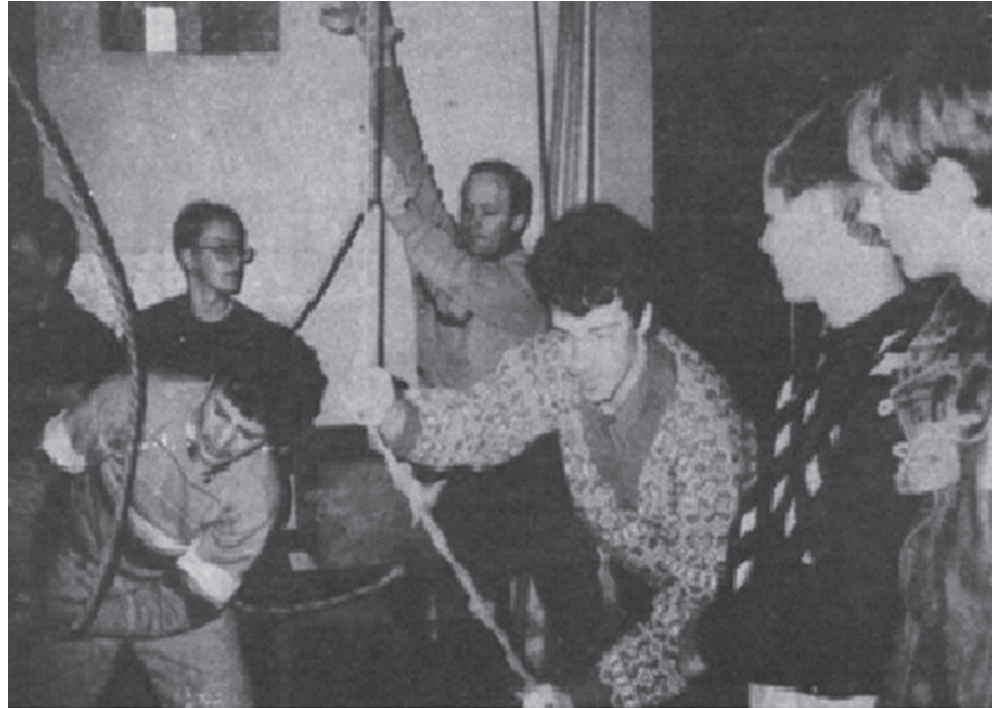
Punskiečiai skambina bažnyčios varpais

Lietuvos žmonių valia buvo išbandyta 1991 metų sausį, Tarybų Sąjungos karinės agresijos prieš Lietuvos valstybę metu. Tūkstančiai beginklių žmonių stojo prieš tankais ir automatais ginkluotus sovietų desantininkus, budėjo prie laužų Nepriklausomybės aikštėje. Sovietų Sąjungos karinė agresija prieš Nepriklausomybę atkūrusią Lietuvos valstybę truko beveik devynis mėnesius. Tuo sunkiu laikotarpiu lietuviai parodė ryžtą bei atkaklumą, gindami savo Nepriklausomybę. Minėdami šiuos tragiškus įvykius, susimąstome apie svarbiausią žmogaus ir tautos vertybę – Laisvę. Sužavėtas laisvės gynėjų ryžtu, labai sujaudintas ir sunerimęs dėl 2022 m. vasario 24 d. prasidėjusio Rusijos ir Ukrainos karo, nusprendžiau parašyti šį straipsnį. Papasakosiu, kaip