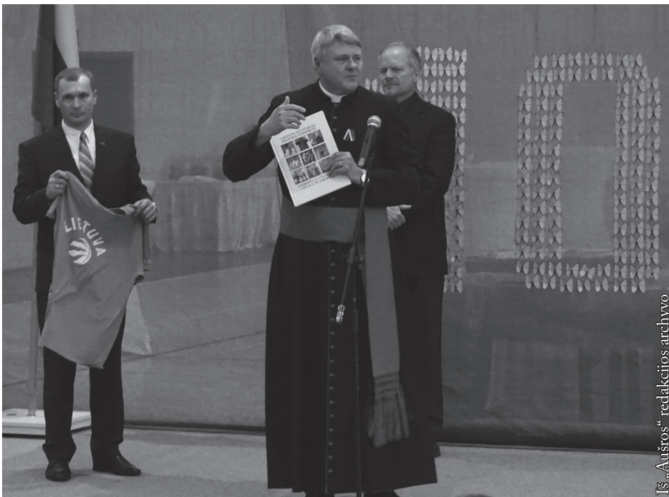
„Žiburio“ mokykloje minint Lietuvos 100-metį