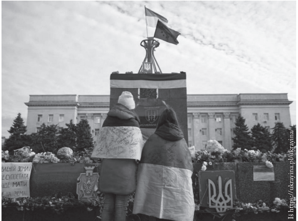
Chersono centras. Tūkstančiai žmonių atėjo pasveikinti kareivius. Visi džiaugiasi, gieda: „Слава Україні! Героям слава!“

Taip baigėsi pirmasis karo etapas, kuriame Ukrainai pavyko išsaugoti