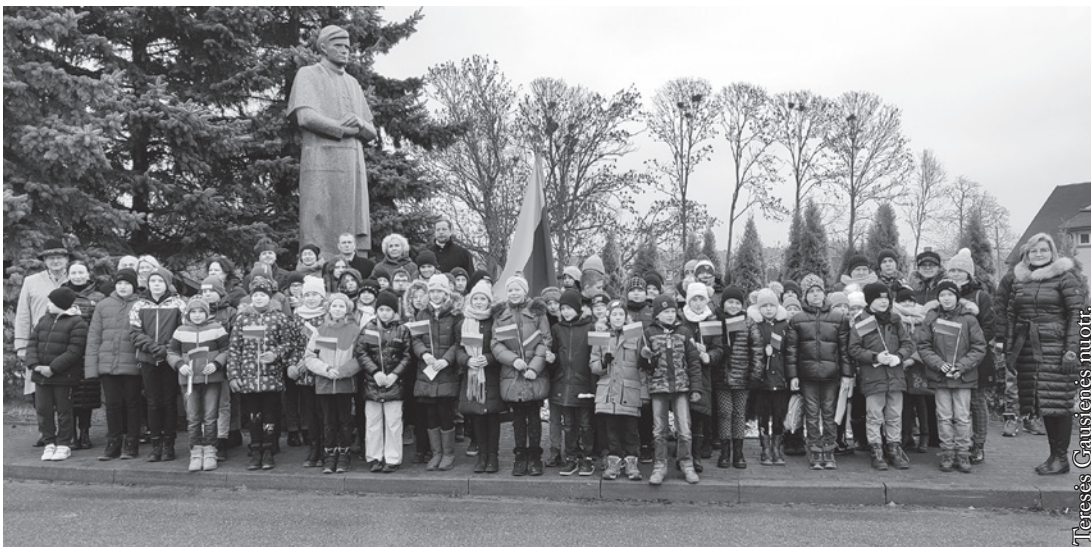
Po šv. Mišių prie A. Baranausko paminklo