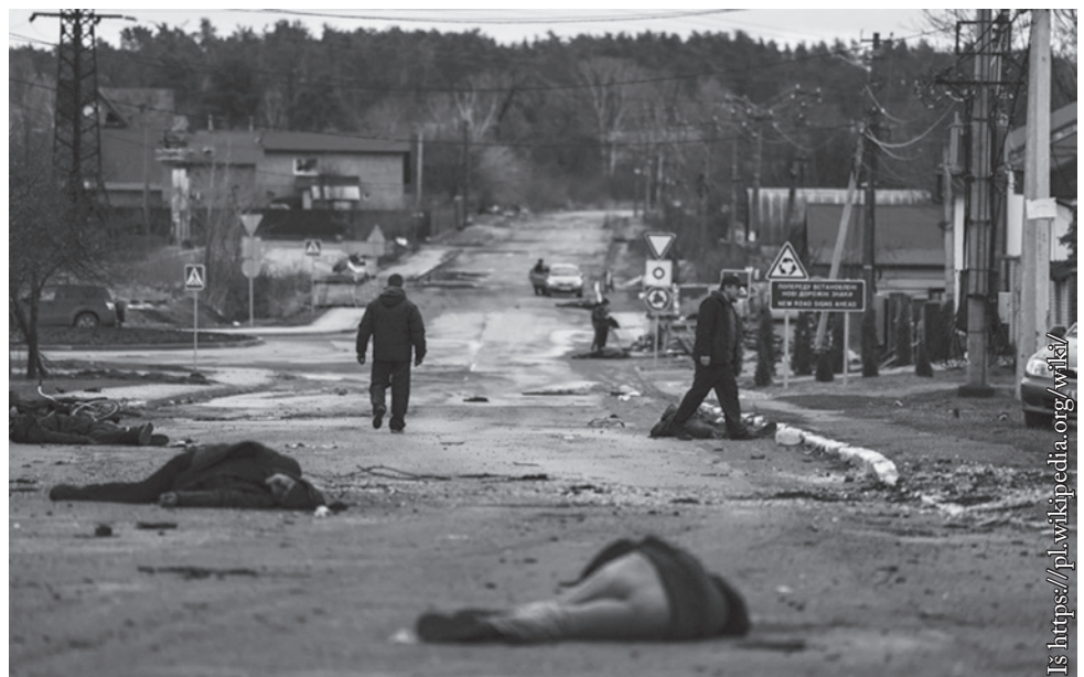
Nužudyti Bučios gyventojai. Taip atrodo Rusijos „išlaisvinimas“

Rusai pietuose ir rytuose norėjo pasiekti du svarbius tikslus – sukurti „koridorių“ į Krymą ir užimti Donbasą. Liūdnas dalykas