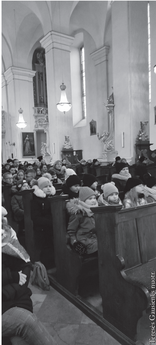
Šv. Mišios Seinų bazilikoje