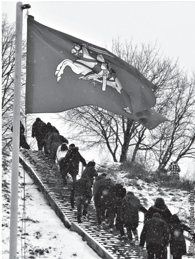
Į Merkinės piliakalnį