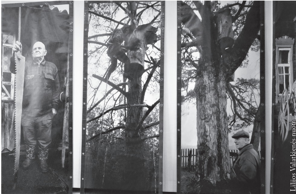
Drevinės bitininkystės parodoje

magistratas, rūmų menėse šoko gražiausios Lietuvos, kartu ir Europos moterys.