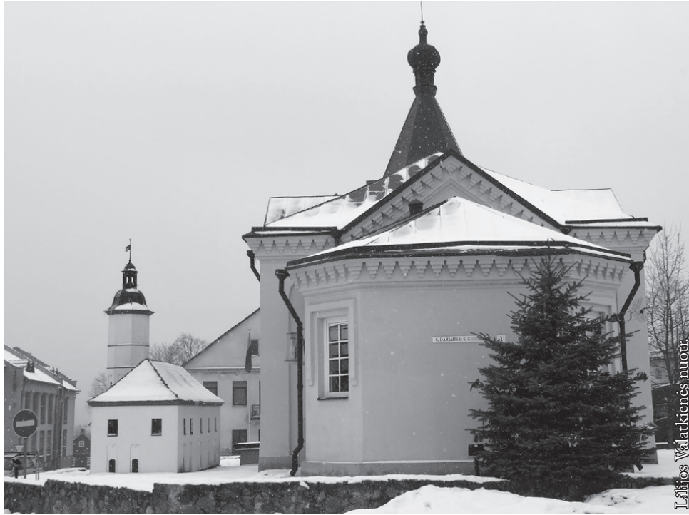
Merkinės krašto muziejus

fon Elnerio, įžygiavusi į Lietuvą, Merkinės pilies neįveikė, bet sudegino papilį. Ne kartą kryžiuočių pultą pilį 1394 m. atsitraukdami Vilniaus gynybai sudegino patys lietuviai. Atstatytą 1403 m. dar kartą sudegino kryžiuočiai.