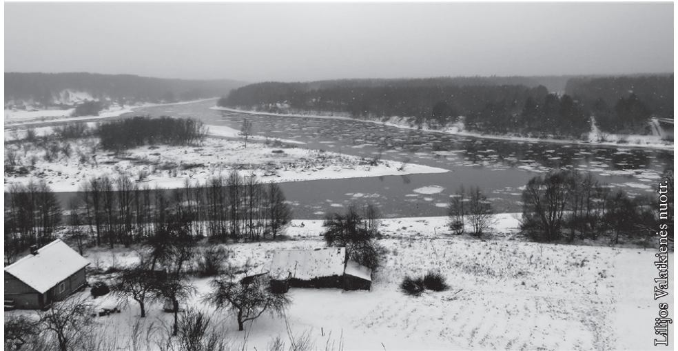
Nuo Merkinės piliakalnio

Sakysite, kad ne pats gražiausias laikas tolimesnei kelionei į gamtą. Sniego dar nemažai, upės iš ledų vaduojasi, gūsingas vėjas sniego pažeria, bet kaip liaudies išmintis byloja – nėra blogo oro, tik bloga apranga. Dzūkijos nacionalinis parkas yra bene arčiausiai Lenkijos sienos, tad aplankyti jį galima savaitgalį ir smagiai pakeliavus vakare grįžti namo. Šis parkas yra didžiausia saugoma teritorija Lietuvoje. Jis įsteigtas 1991 m., jo plotas – 58 452 ha. Parkas turi misiją saugoti ir puoselėti Dainavos upių santakos gamtos ir kultūros vertybes, sudaryti sąlygas poilsiui ir pažintiniam turizmui. Jame gausu šaltinių ir upių,