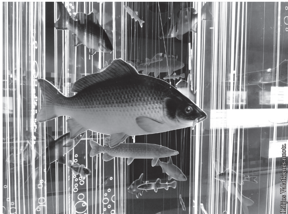
Žuvų ekspozicija lankytojų centre

IX tūkstantmetyje prieš Kristų Nemuno, Merkio, Stangės ir Straujos upių santakoje įsikūrė bene pirmieji Lietuvos gyventojai. Merkinės pilis XIV–XV a. dažnai minima Vygardo Marburgiečio ir Jono iš Posilgės kronikose, kryžiuočių kelių aprašymuose. Merkinės apylinkių miškuose medžiojo karaliai ir kunigaikščiai, mieste skambėjo keturių bažnyčių, cerkvės varpai, dviejuose vienuolynuose vienuoliai alumnus mokė lotynų kalbos, poetikos ir retorikos, nuo XVII a. pradžios į sinagogas melstis rinkosi žydai, rotušėje posėdžiavo