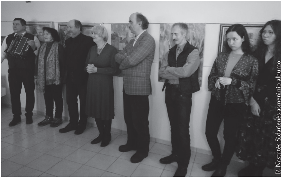
Parodos atidarymo dalyviai