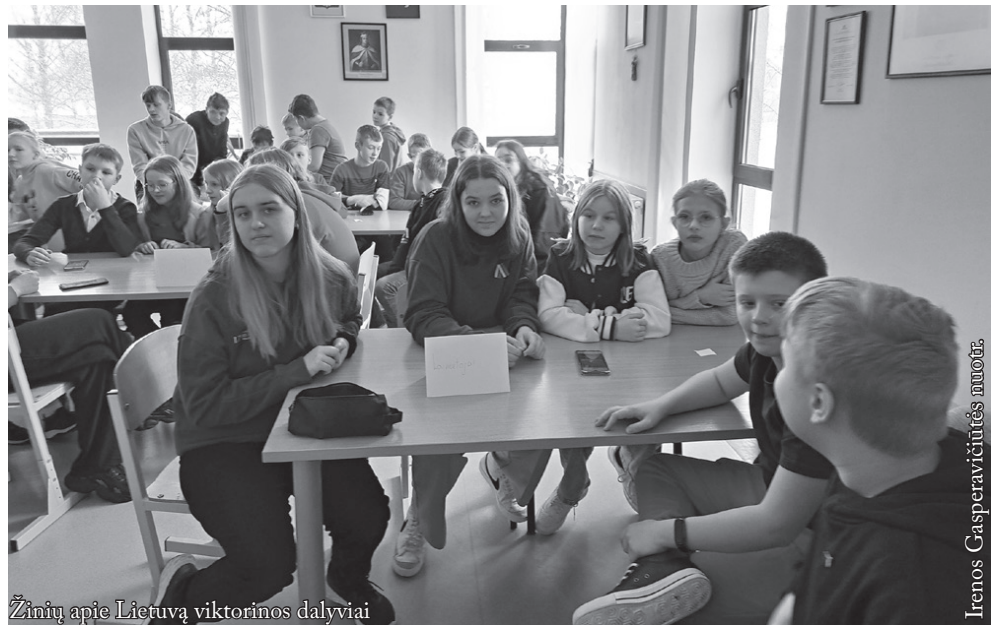
Žinių apie Lietuvą viktorinos dalyviai

Šiais metais Kovo 11-ąją minėjome iš pradžių tradiciškai – visa mokykla