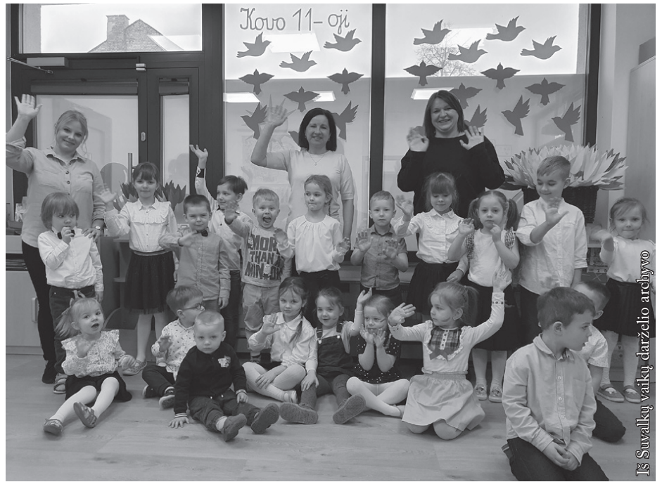
Kovo 11-oji Suvalkų lietuvių vaikų darželyje

Suvalkų lietuvių bendruomenė Lietuvos Nepriklausomybės atkūrimo dieną minėti susirinko kovo 11-osios vakarą į viešbutį „Loft“. Susirinkusiuosius pasveikino LR