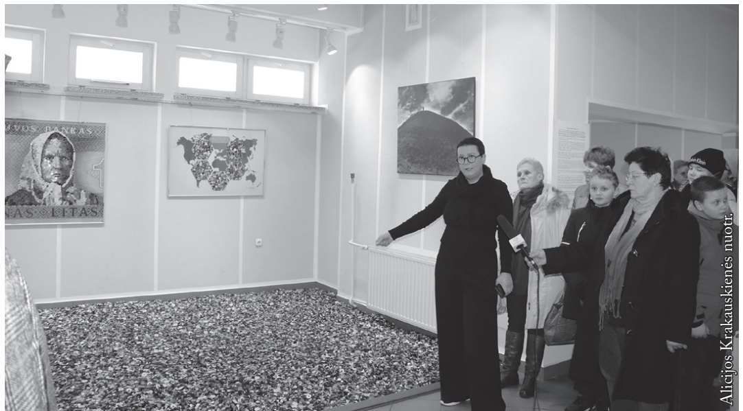
„Sagų sala“ simbolizuoja emigracijos mastą

Pagrindinė komunikacijos priemonė – saga. Per paprastą sagą (kiekviena saga simbolizuoja emigravusį į užsienį Lietuvos pilietį) siekiama įtvirtinti universalų pasakojimą.