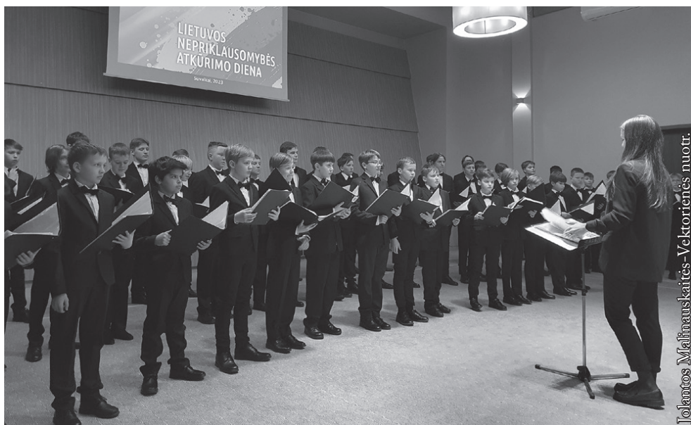
Kauno berniukų choras „Varpelis“