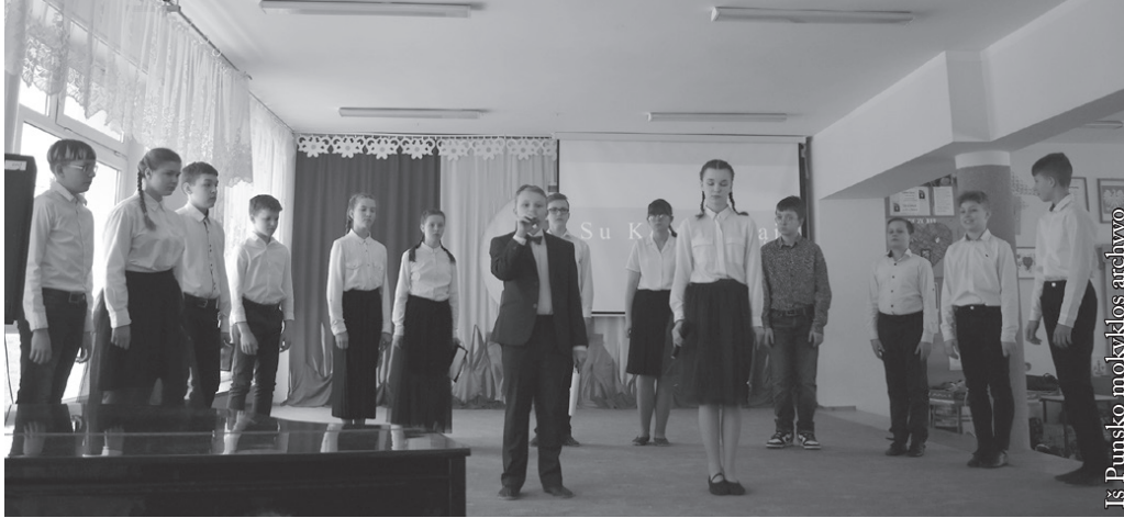
Kovo 11-osios minėjimas

su auklėtoja paruošė minėjimą. Iškilmingai šventės pradžioje visi sugiedojo Lietuvos himną. Moksleiviai pasakojo apie šventės svarbą ir istoriją. Skyrė tėvynei gražiausias lietuvių poetų eiles, patriotines dainas, muzikinį kūrinį.