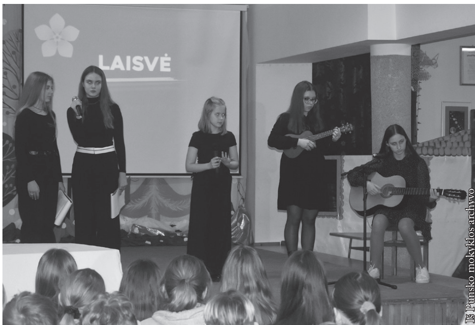
Sausio 13-osios minėjimo akimirka

Vasario 16-ąją mūsų mokykloje šventėme Lietuvos valstybės atkūrimo dieną. Septintokai drauge