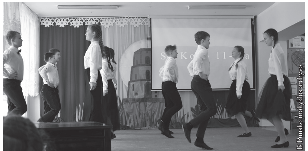
Kovo 11-osios minėjimo akimirka

Neišsemti žodžių – Meilė, Lietuva, Tėvynė, Kaip ir žodžių – Laisvė, Motina ir Duona.