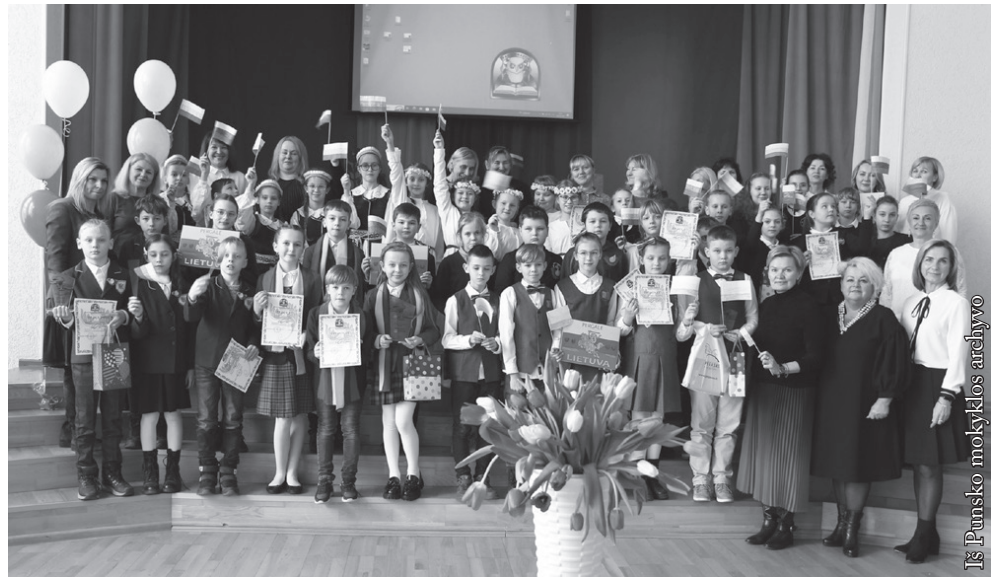
Iš Punsko mokyklos archyvo

Pradžioje visus pasveikinome: „Sveiki gyvi, Jūs visi! Mės gimėm gražam Pūncko krašti. Ca augam ir buojam. Mokam šokc, dainuoc ir pieśc. Esam draugiški, linksmi,