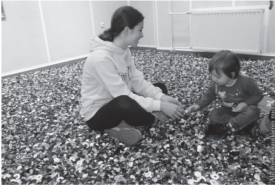
„Sagų saloje“ kaip smėlio dėžėje...

Projekto tikslas – iškelti vis dar aktualų Lietuvos piliečių emigracijos klausimą, įvairiomis meninės raiškos priemonėmis paanalizuoti minėtą problemą ir paskatinti visuomenę diskusijai, o politikus – kviesti emigrantus sugrįžti atgal.