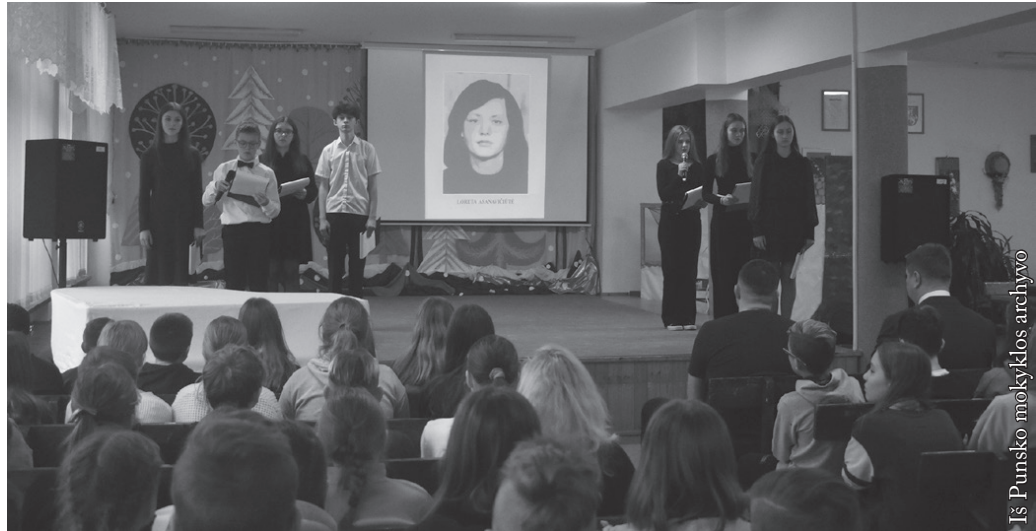
Sausio 13-osios minėjime prisiminti laisvės gynėjai

Sausio 13-osios data žymi svarbų, o gal net ir esminį, momentą atkuriant nepriklausomą Lietuvos valstybę. Per Sausio 13-osios įvykius Lietuva pademonstravo, kad ne tik siekia nepriklausomybės, bet ir ryžtasi ją apginti. Tai tikrai buvo itin svarbu. Vienas dalykas – deklaruoti