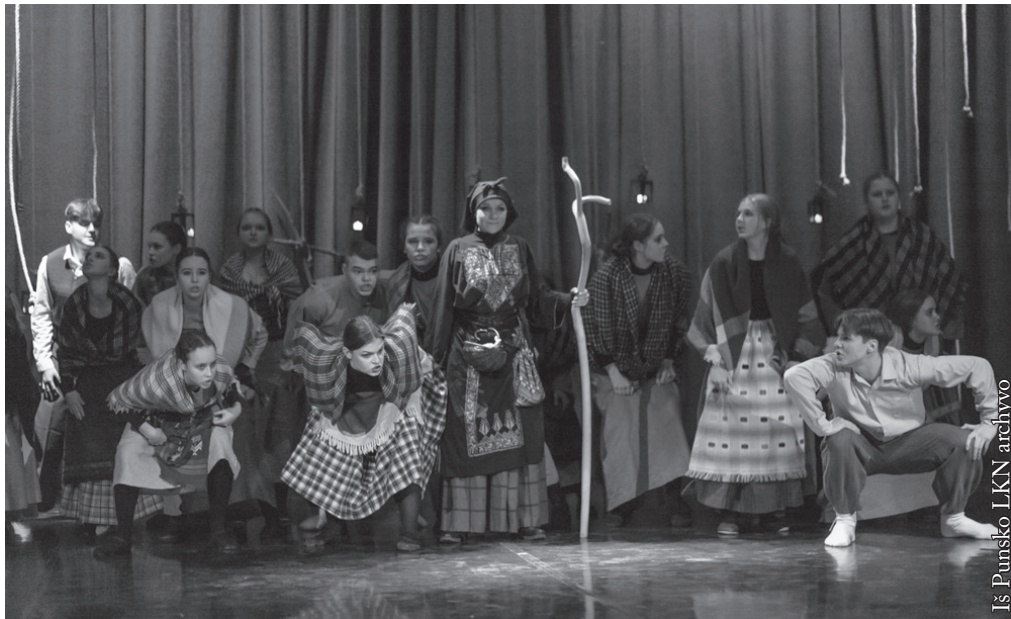
A. Mickevičiaus „Vėlinių“ prapremjera