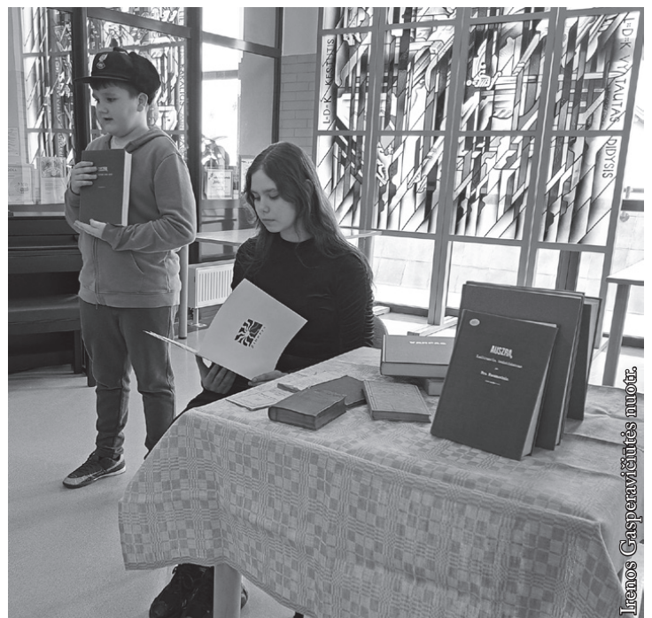
Knygnešių dienos minėjimas Seinų „Žiburio“ mokykloje

Vaikai sužinojo, kad pasipriešinimas carinės Rusijos vykdomai lietuviškos spaudos draudimo politikai ir aktyvi knygnešių veikla garantavo lietuvių kultūros ir švietimo gyvavimą. Labai svarbus vaidmuo šioje srityje atiteko tuomet Seinų kunigų seminarijoje besimokiusiems dvasininkams.