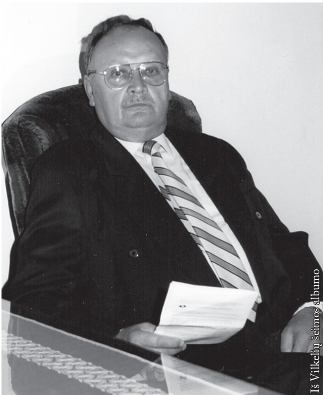
Iš Vilkelių šeimos albumo