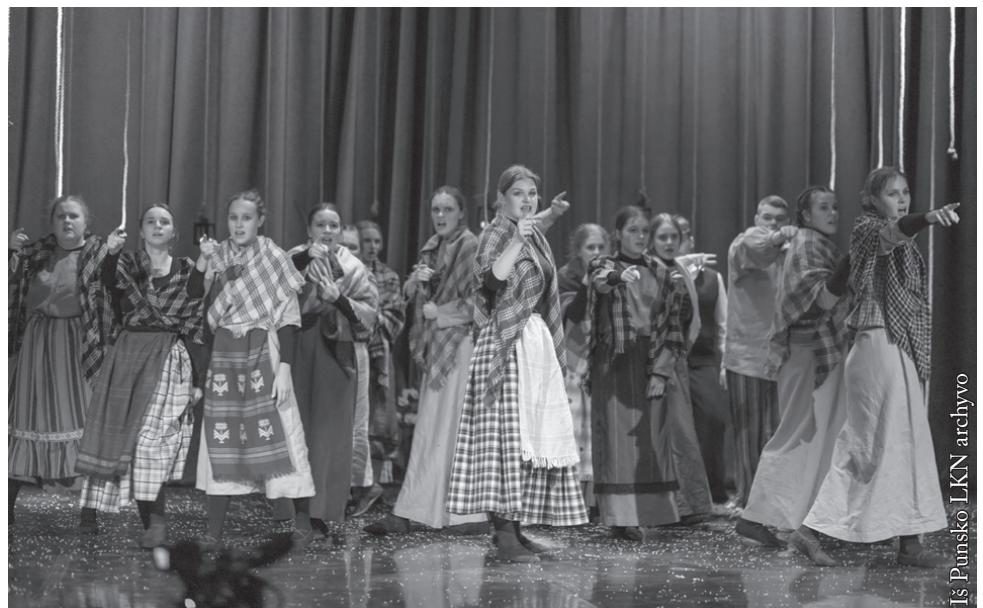
A. Mickevičiaus „Vėlinių“ scena

Ministerstwo Spraw Wewnętrznych i Administracji