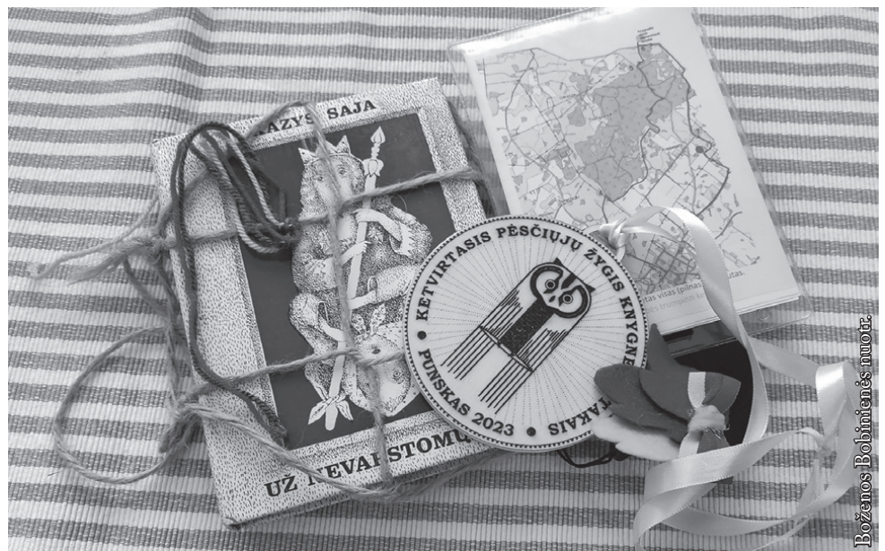
Knygnešių žygio suvenyrai

Janytės sodybėlės židiny užgeso, o laikas sustojo. Bet ši vieta dar neapsitraukė visiškai voratinkliais, nenugulta dulkių, neužako krūmais ir žolėmis. Dar nenugriuvo. Dairaisi po kiemą ir pastebi, kur buvusios šeiminių vaikščiota, kur ranka prisiliesta, kur akis užmesta. Po šitiek metų!