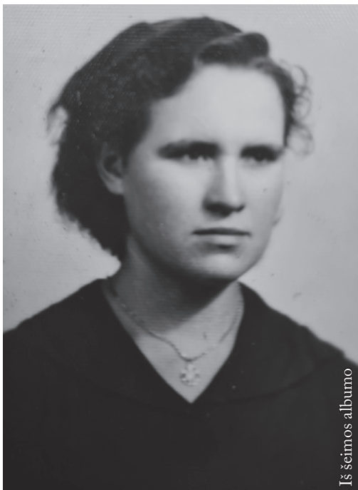
Iš šeimos albumo