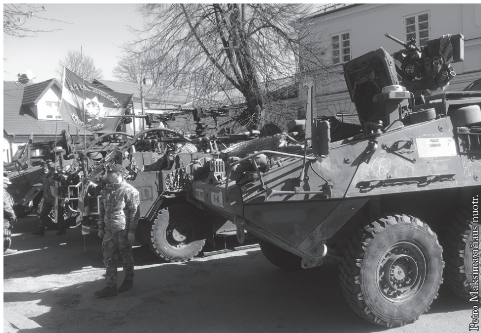
NATO kariai Seinuose

į Vilnių, esantį 30 kilometrų nuo rytinės NATO sienos. Vilniuje bus priimami sprendimai, kuriais NATO tęs savo persiorientavimą kolektyvinei gynybai. O tai ypač svarbu taip pat mums.