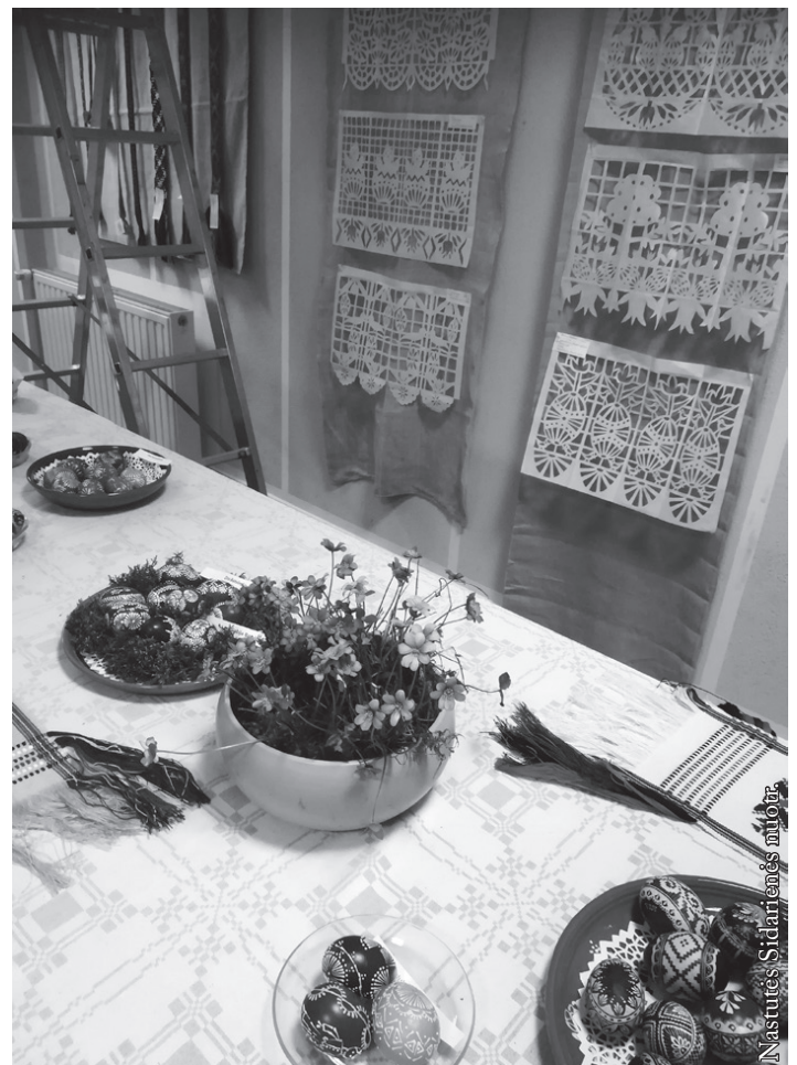
Velykinė paroda. Seinų „Žiburio“ vaikų karpiniai ir suaugusiųjų margučiai

LLEKD dėkoja visiems tautodailininkams, panorėjusiems dalyvauti Velykinėje parodoje, visiems, padėjusiems ją suorganizuoti, parodos atidarymo dalyviams, pasirodžiusiems scenoje, Punsko lietuvių kultūros namų darbuotojams, rėmėjams ir atvykusiesiems į parodos atidarymo iškilmes bei jos lankytojams.