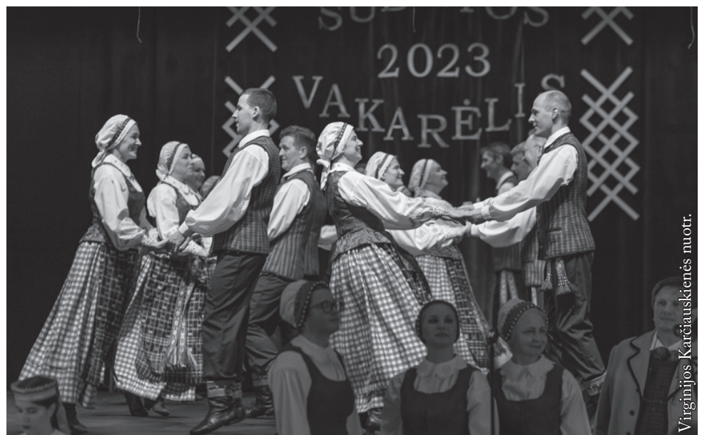
Vilniaus miesto liaudiškos muzikos ir šokių ansamblis „Vilnis“

Visi šventės dalyviai rodė lietuvių kultūros, kūrybos didybę ir grožį, o žiūrovai juos šiltai sutiko ir palydėjo gausiais plojimais. Įteikti padėkos