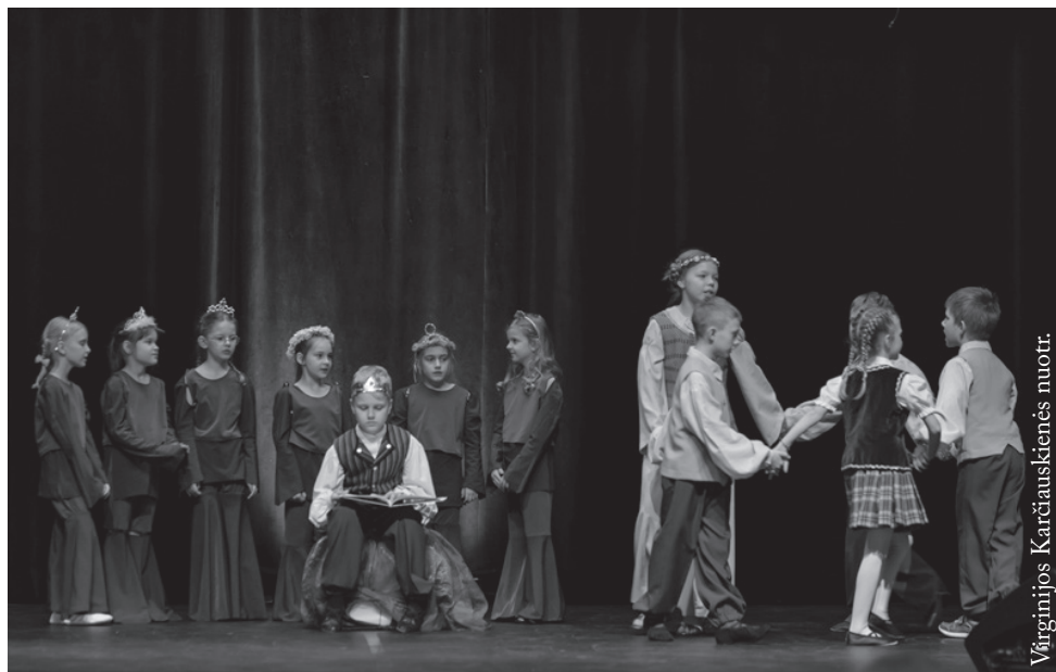
Seinų lietuvių „Žiburio“ mokyklos pradinukų teatras „Šakar makar“