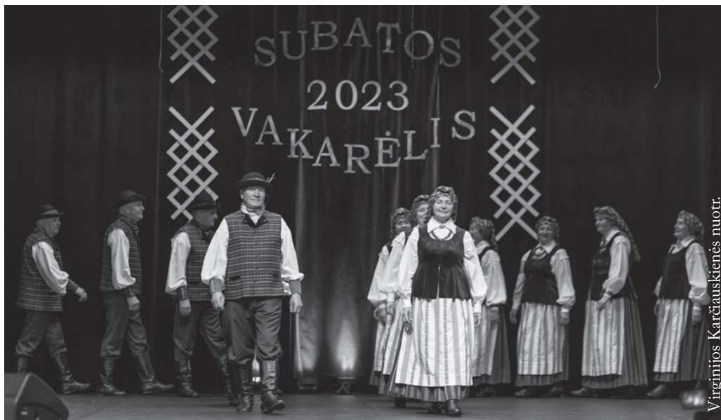
Palangos kultūros ir jaunimo centro senjorų liaudiškų šokių grupė „Bočiai“