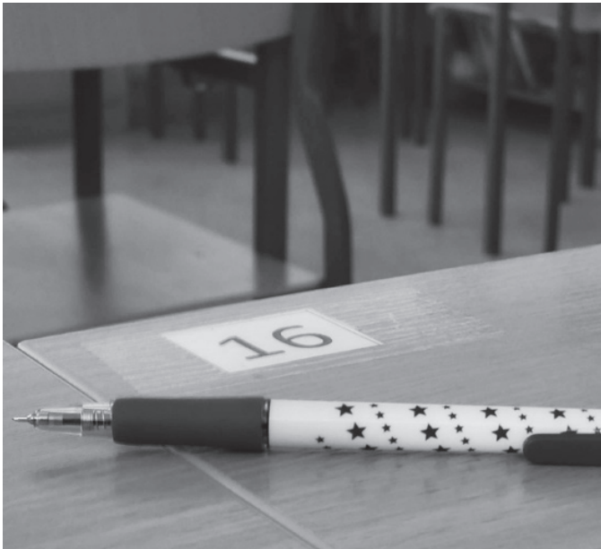
Abitūra Punske 2023 m.

mokymosi krūviai dažnai sukelia jausmą, kad laiko nepakanka ir kad negalima visko įsisavinti tinkamai. Tai taip pat neapibrėžtumas ir nežinomybė. Būtent į šitai dėmesį atkreipia šiuos procesus tiriantys mokslininkai.