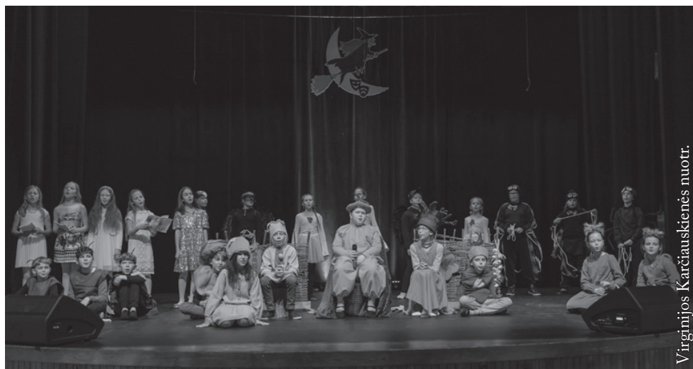
Marijampolės „Ryto“ pagrindinės mokyklos 3 b kl. teatro studija