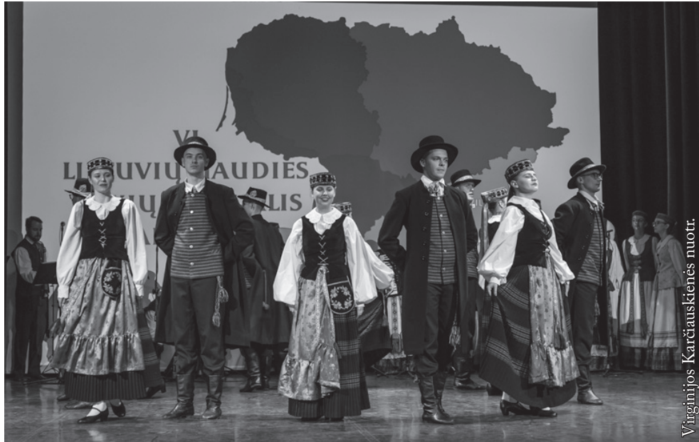
Vilniaus kolegijos šokių ir dainų ansamblis „Voruta“