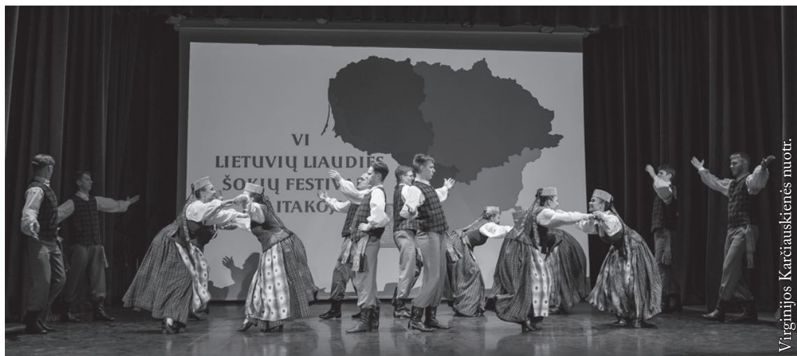
Punsko LKN jaunimo šokių grupė „Vyčiai“