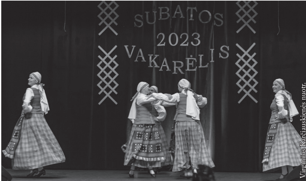
Suvalkų lietuvių šokių grupė „Sūduva“

J. Švedo). Tai jų antrasis pasirodymas Seinų „Lietuvių namų“ scenoje ir, tikėkimės, ne paskutinis.