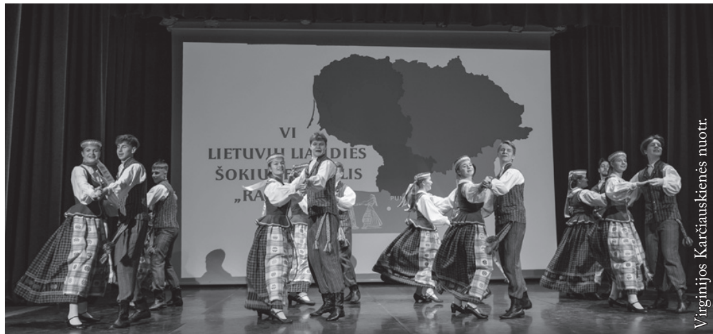
Punsko Kovo 11-osios licėjaus šokių grupė „Šalčia“

Į mūsų šokių šventę pasikvietėme keturis kolektyvus iš skirtingų