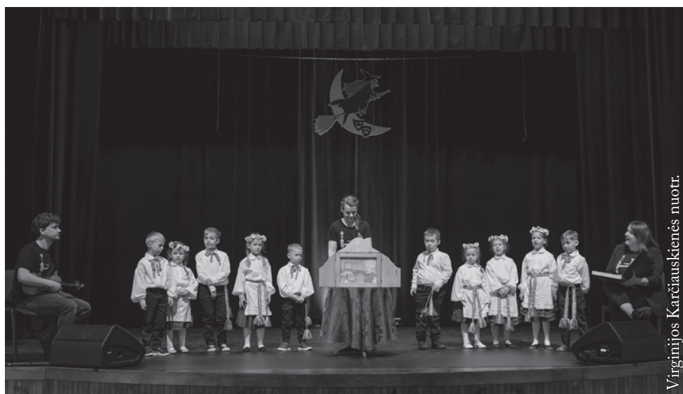
Suvalkų lietuvių vaikų darželio „Sūduviukai“