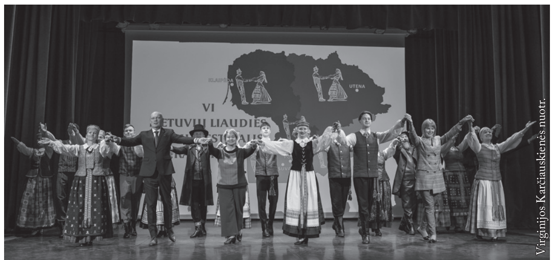
Finale į sceną susibėgo visi – „aukštaičiai, žemaičiai, sūduviai ir dzūkai nuo girių melsvų“

LIETUVOS RESPUBLIKOS UŽSIENIO REIKALŲ MINISTERIJA