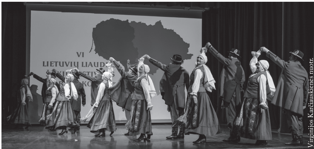
Šakių kultūros centro senjorų liaudiškų šokių grupė „Girėnai“