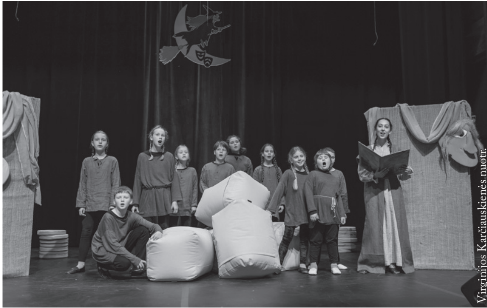
Skapiškio vaikų ir jaunimo teatro studija „Ku-kū“