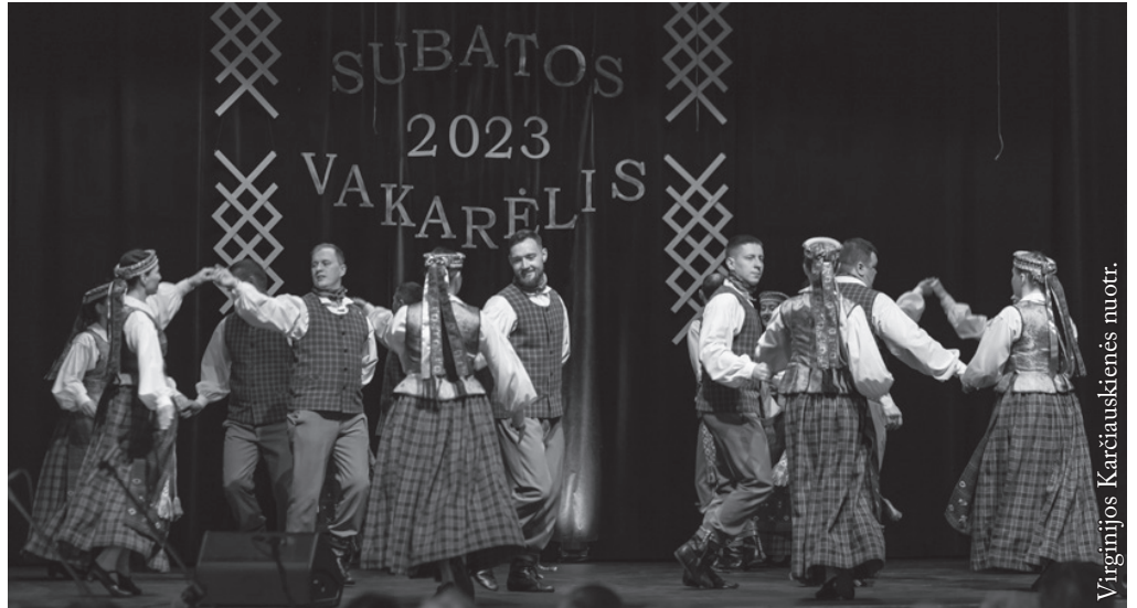
Seinų „Lietuvių namų“ vyresniųjų liaudiškų šokių grupė „Seina“

Džiugu stebėti, kad Seinuose lietuvių liaudies muzikos ir šokio mėgėjų skaičius vis didėja. Tai pamatėme jau antrus metus organizuodami Lietuvių liaudies muzikos ir šokių šventę „Subatos vakarėlis“. Scenoje gražius ir kokybiškus pasirodymus dovanojo 125 kolektyvų dalyviai – šokėjai, muzikantai ir dainininkai iš Vilniaus, Palangos, Seinų, Punsko ir Suvalkų.