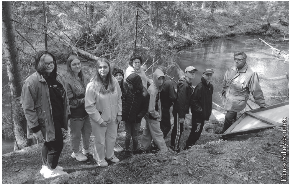
Prie partizanų bunkerio ant Ratnyčėlės kranto