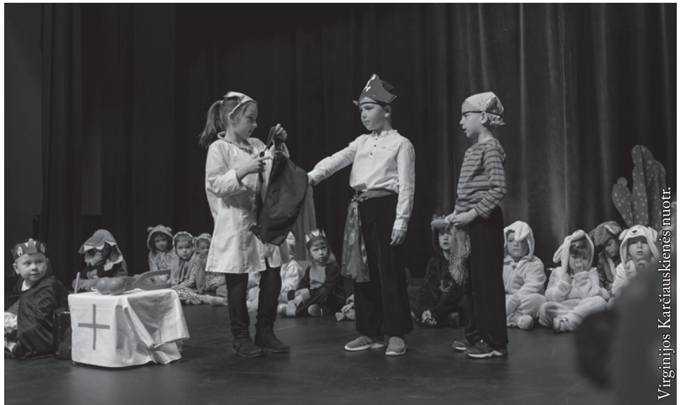
Seinų lietuvių „Žiburio“ darželio teatras „Žiburiukai“