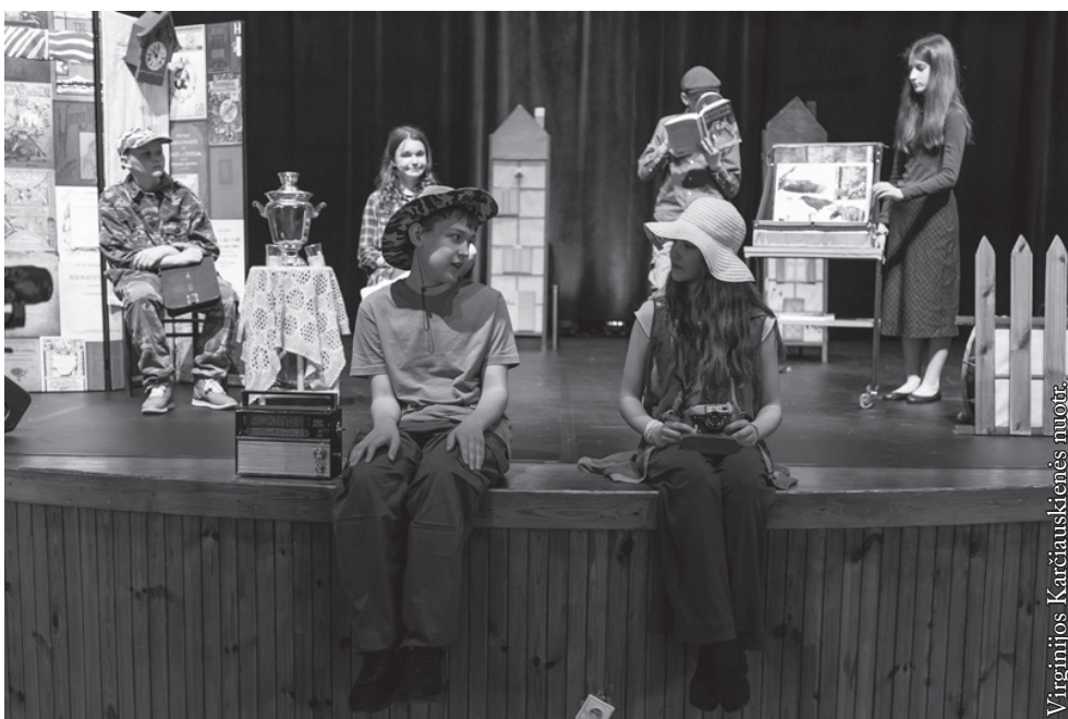
Punsko Dariaus ir Girėno pagrindinės mokyklos teatras „Girėnai“

Seinų lietuvių „Žiburio“ mokyklos pradinukų teatras „Šakar makar“ suvaidino spektaklį pagal lietuvių liaudies pasaką „Eglė žalčių karalienė“. Jį ruošiant dirbo visa komanda: rež. Irena Vaicekauskienė, scenogr. Irena Balulienė, choreogr. Inga Vilkelienė, muz. Arnoldas Aristidas Beinaris.