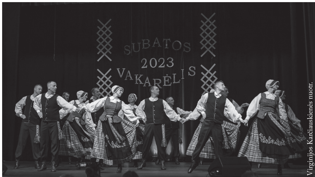
Punsko lietuvių kultūros namų liaudiškų šokių grupė „Vyčiai“