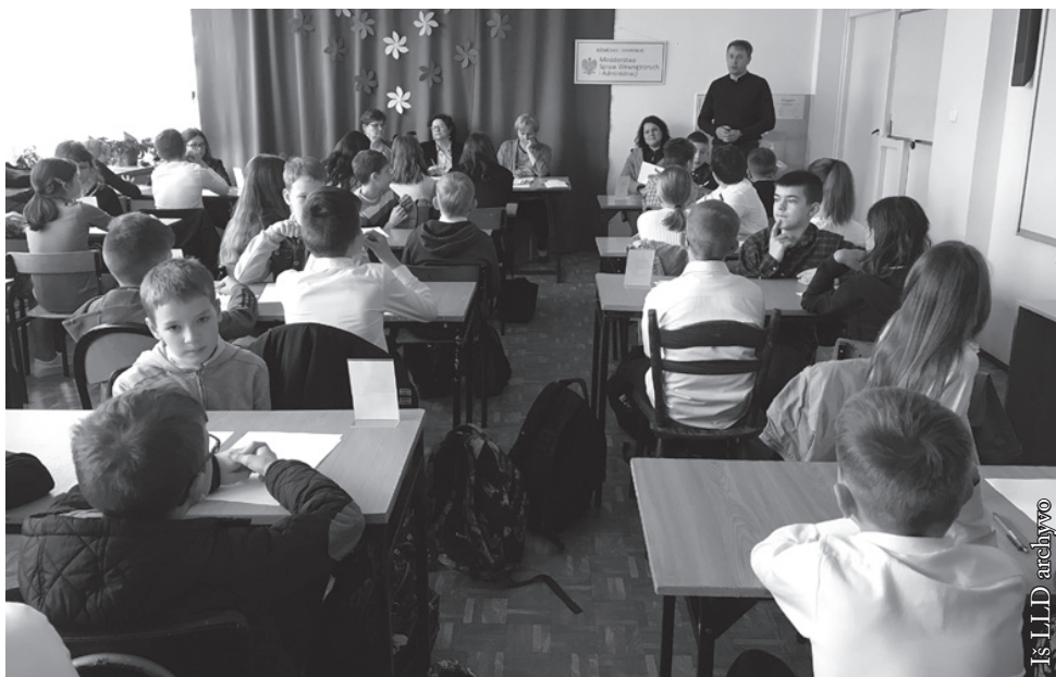
IV–VI klasių lietuvių kalbos konkursas-viktorina

Lenkijos lietuvių draugija nuoširdžiai dėkoja visiems dailiojo žodžio, lietuvių kalbos ir literatūros, Lietuvos istorijos ir geografijos konkursų dalyviams už didelį susidomėjimą. Mokytojams tariame ačiū už vaikų paskatinimą dalyvauti konkursuose ir darbą juos ruošiant. Komisijų nariams dėkojame už konkursų dalyvių vertinimą. Labai ačiū konkursų ir išvykos į Lietuvą rėmėjai – Lenkijos Respublikos vidaus reikalų ir administracijos ministerijai.