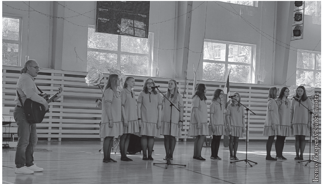
Seinų popstudija „Žiburiukai“ festivalyje Rygoje

Festivalis prasidėjo gegužės 13 d. 13 val. Jame dalyvavo daugiau kaip