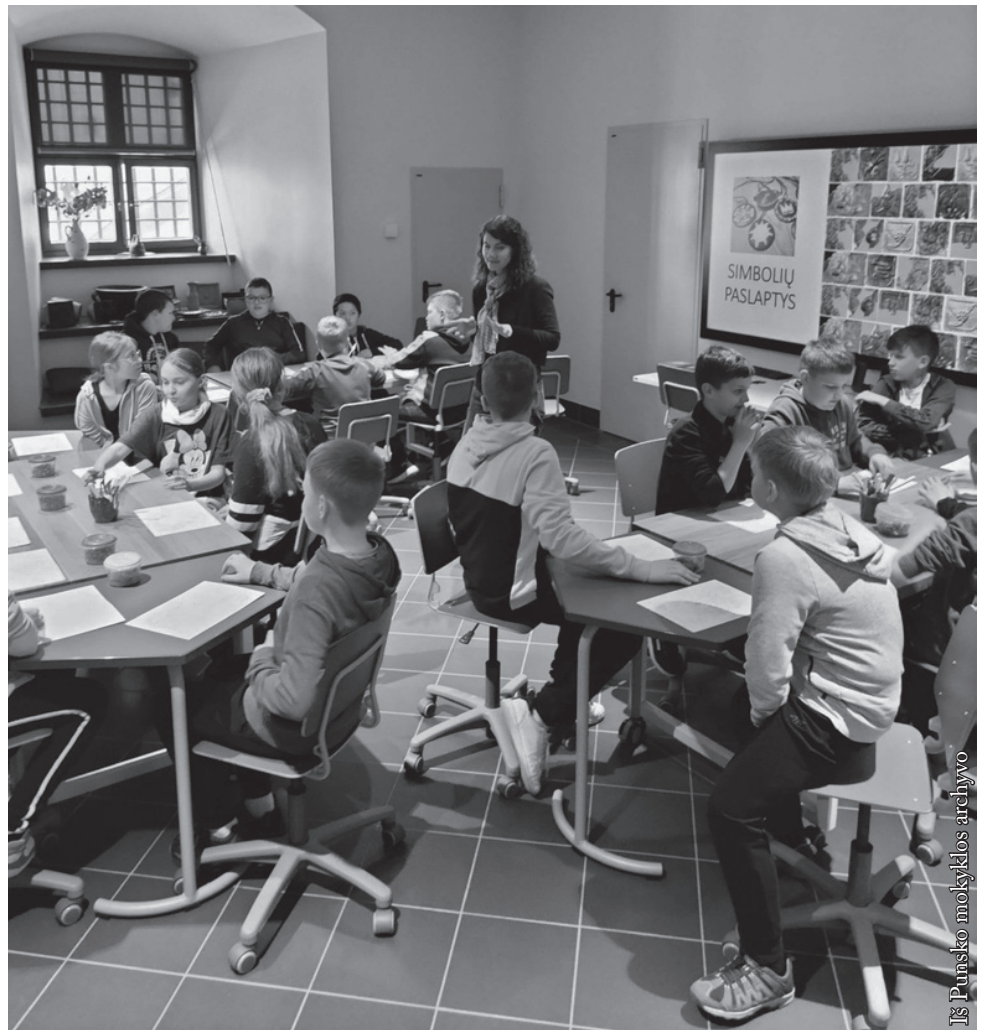
Edukaciniai užsiėmimai Valdovų rūmuose

Balandžio 27 dieną nuvykome į Vilnių. Nors reikėjo anksti keltis, važiuoti kelias valandas, bet buvo linksma ir įdomu. Lankėme svarbiausias Vilniaus vietas. Net pietus valgėme Televizijos bokšte. Oi, kaip buvo skanu... Nupirkau šeimos nariams suvenyrų. Namų grįžome linksmi.