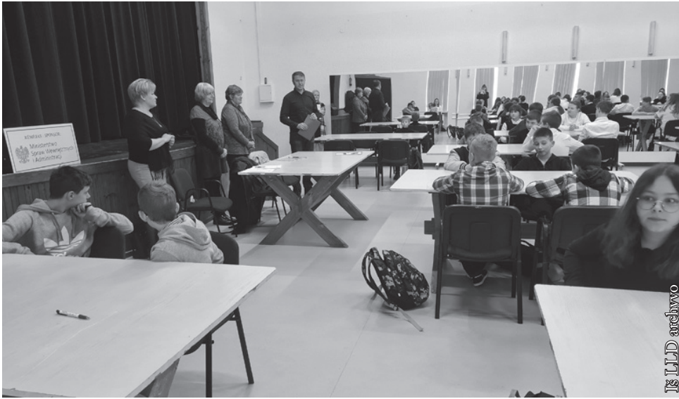
Lietuvos istorijos konkurso dalyviai ir komisija