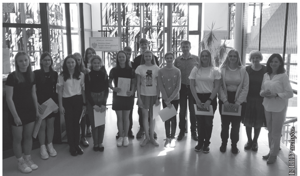
Dailiojo žodžio konkurso dalyviai