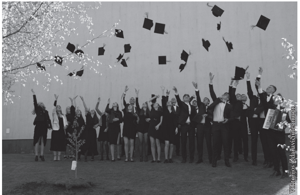
Šiemečiai Punsco Kovo 11-osios licėjaus abiturientai