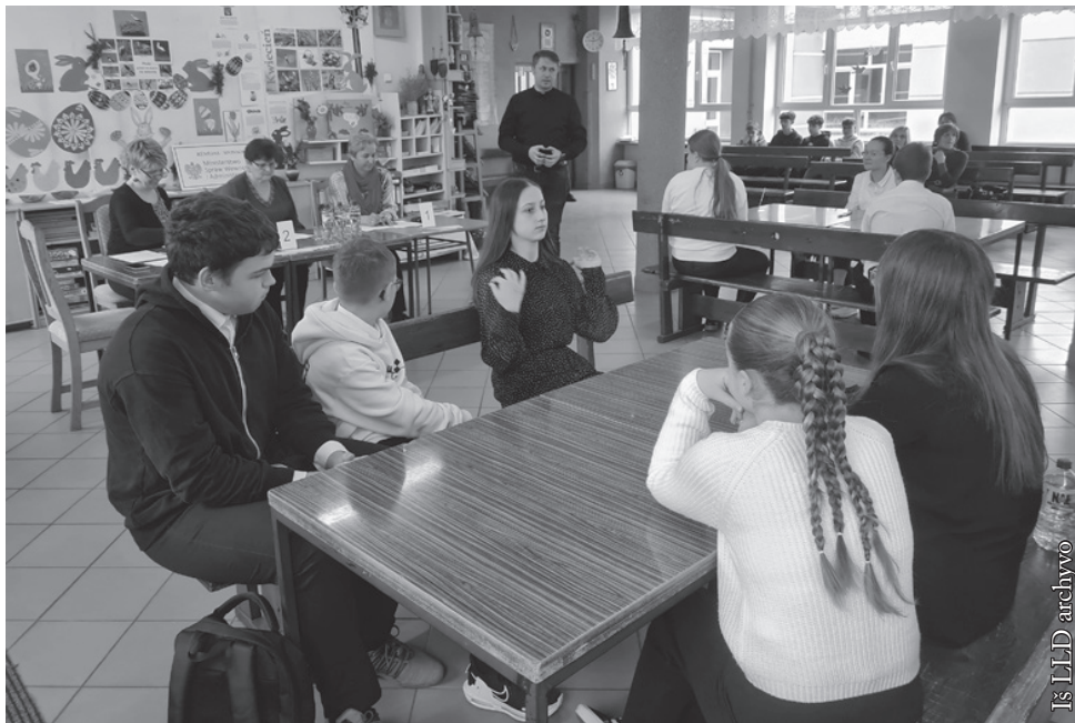
VII–VIII klasių lietuvių kalbos konkursas-viktorina

Gegužės 16 d. Lenkijos lietuvių draugija Vidugirių mokykloje surengė lietuvių kalbos ir literatūros konkursą-viktoriną IV–VI klasių moksleiviams. Joje dalyvavo 12 grupių (36 dalyviai). Tematika buvo susijusi su lietuvių padavimais,