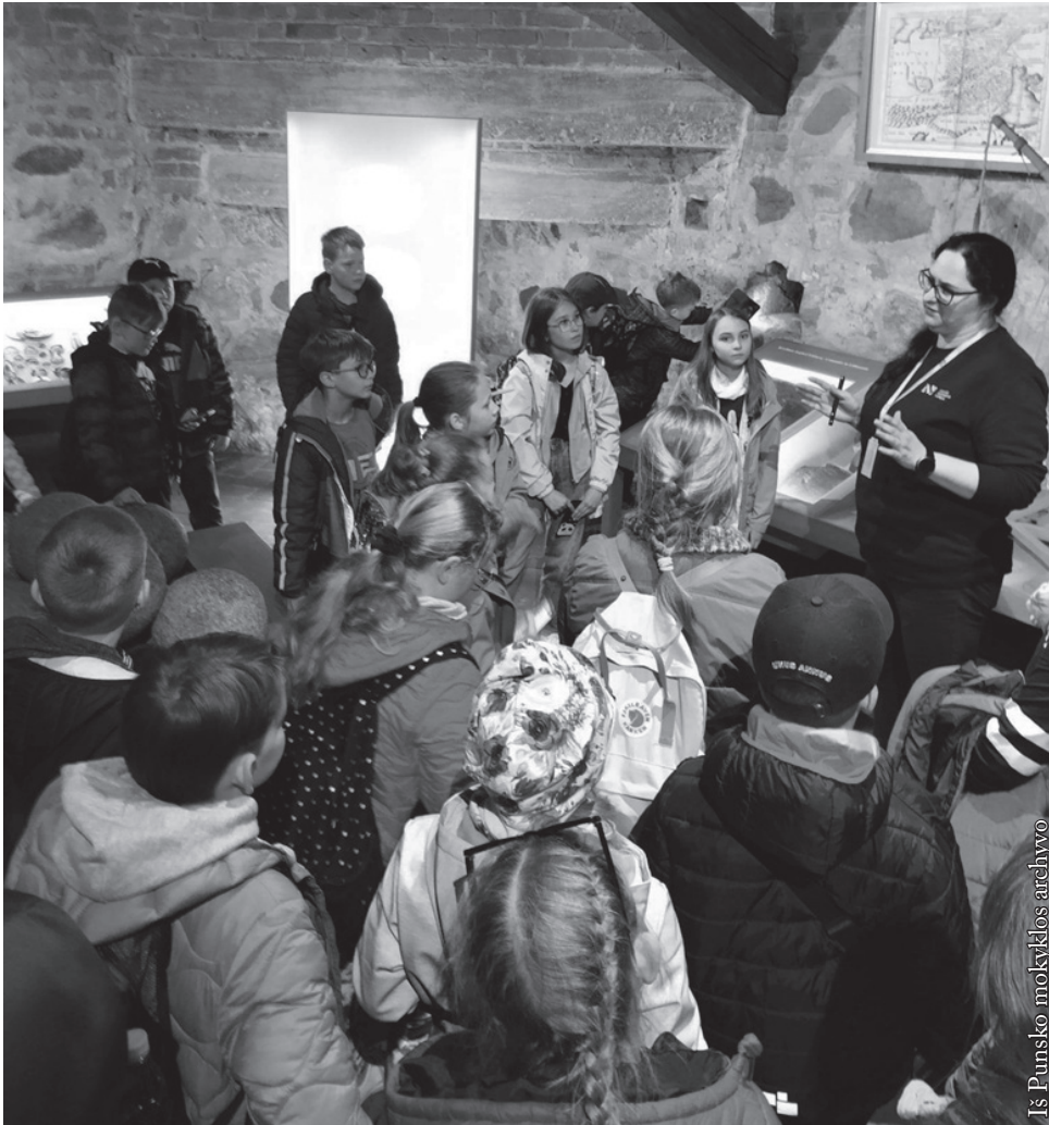
Lankome Valdovų rūmus