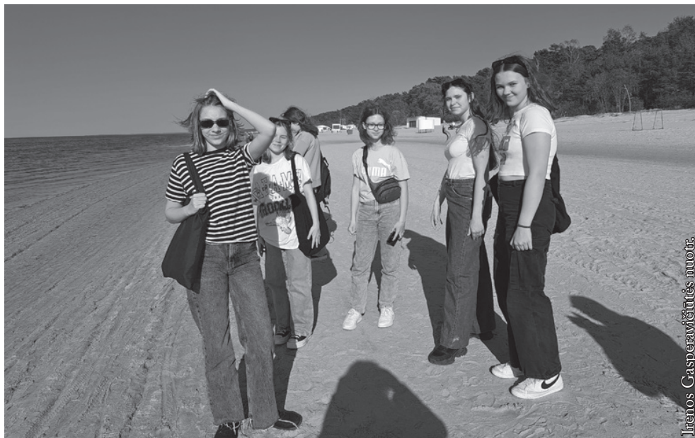
Jūrmaloje prie Baltijos jūros

Tolimiausi svečiai buvo iš Jungtinės Karalystės, jie atvežė pramoginių šokių programą. Taigi scenoje galima buvo pamatyti ir tradicinio folkloro, ir šiuolaikinių kūrinių. Po koncerto šeiminiškai pakvietė visus dalyvius paragauti joniškėčių pagaminto uzbekiško plovo.