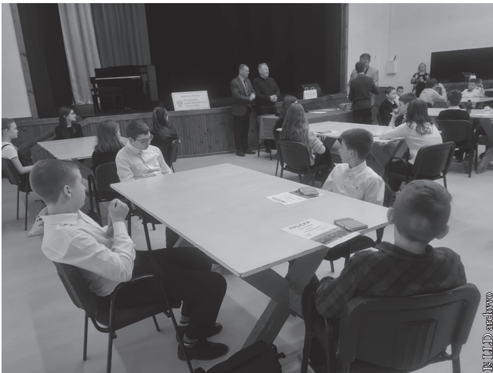
Lietuvos geografijos konkurso dalyviai ir komisija

Gegužės 10 d. Seinų lietuvių „Žiburio“ mokykloje įvyko Lenkijos lietuvių draugijos surengtas dailiojo žodžio konkursas. Kaip kasmet jame dalyvavo visų lietuvių darželių vaikai ir lietuviškų mokyklų moksleiviai: Punsko savivaldybės vaikų darželio, Punsko Dariaus ir Girėno pagrindinės mokyklos, Punsko Kovo 11-osios bendrojo lavinimo licėjaus, Vidugirių pagrindinės mokyklos, Seinų lietuvių „Žiburio“ vaikų darželio ir pagrindinės mokyklos bei Suvalkų lietuvių vaikų darželio.