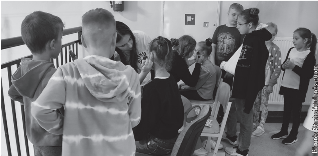
Galima buvo papuošti savo veidus

pritaikyti sporto salę. Valandėlę pabendravus vaikams ir mokytojams su atvykusiais svečiais, prasidėjo oficialioji dalis.