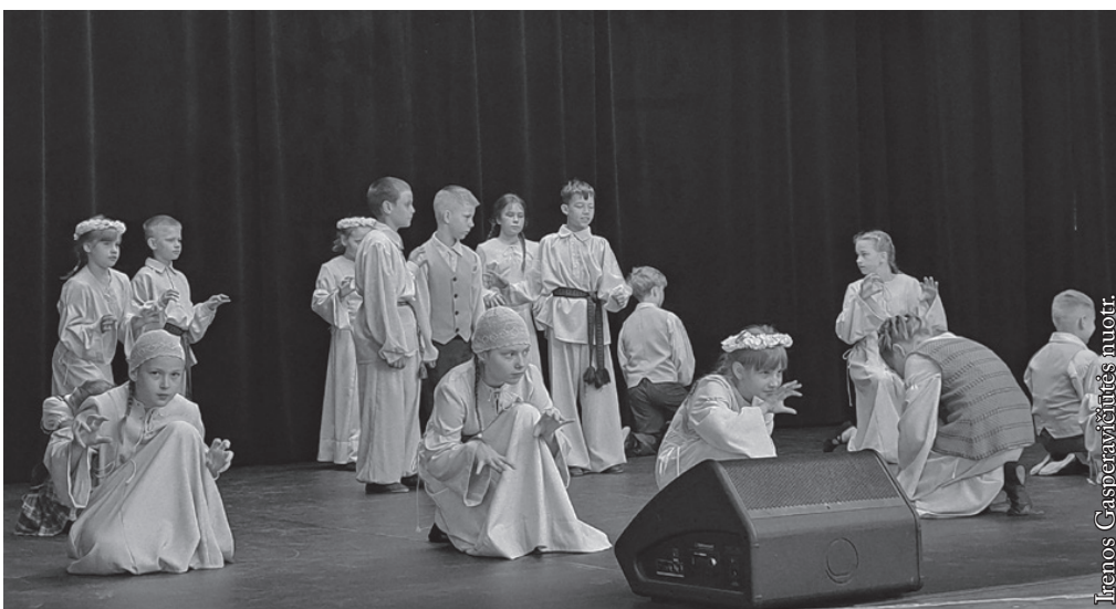
„Eglė žalčių karalienė“

Šiomet atvyko svečiai iš Lietuvos – Alytaus jaunimo centro vokalinė studija „Boružėlė“, taip pat mūsų krašto lietuviškų mokyklų atstovai. Buvo planuojama visą šventę, kaip ir anksčiau, organizuoti mokyklos kieme, tačiau diena buvusi tokia šalta ir vėjauta, kad nuo pat ryto teko smarkiai paplušėti ir meno pasirodymams