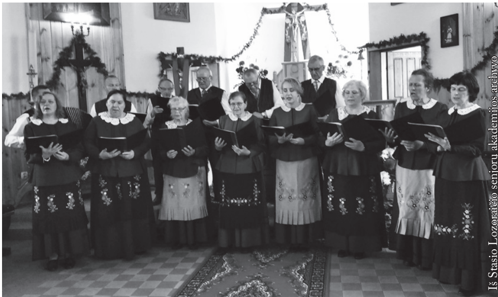
Suvalkų lietuvių bažnytinis choras „Ančia“