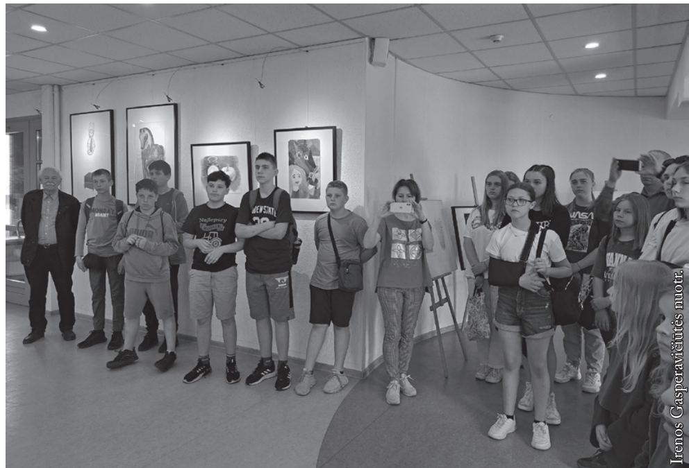
Vaikų darbų parodos „Pieškime kartu“ atidaryme