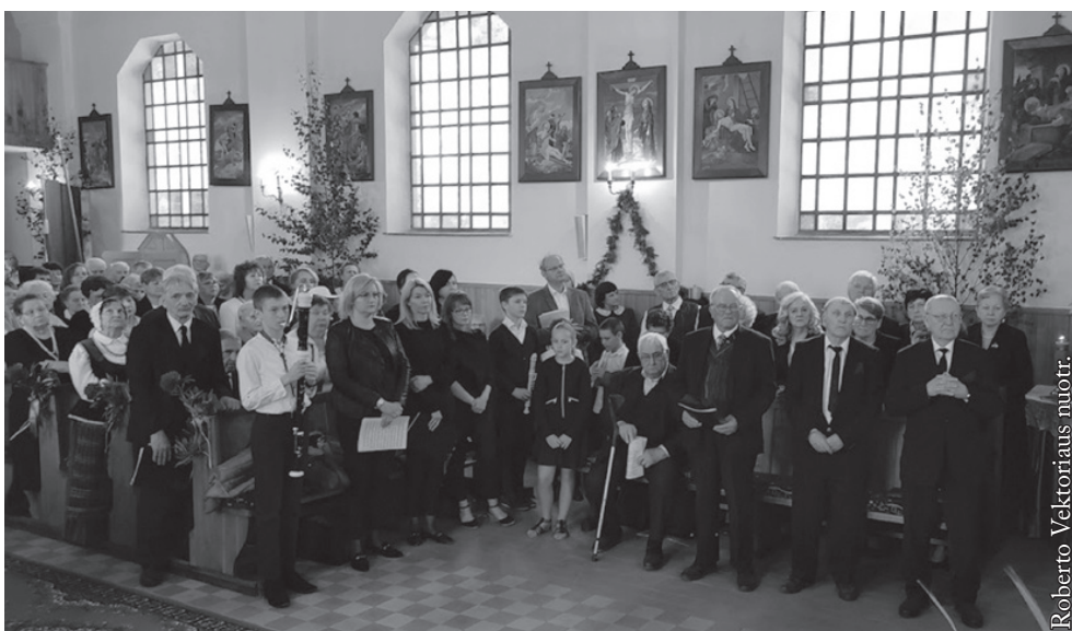
Šventės metu aukotų šv. Mišių akimirka