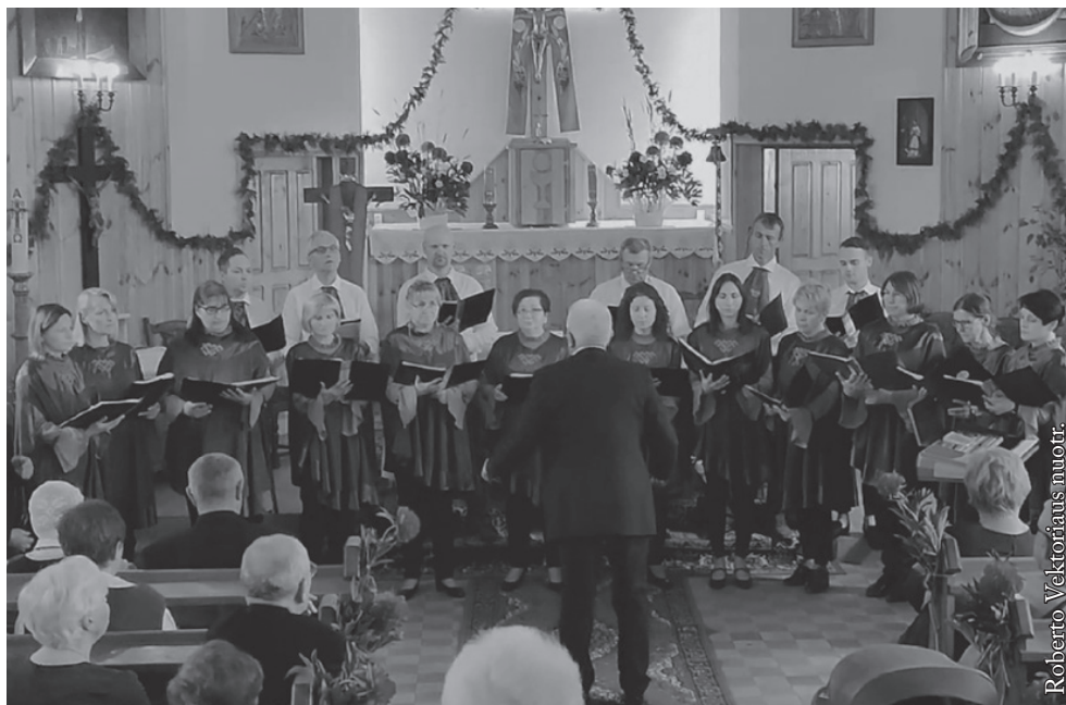
Punsko lietuvių kultūros namų mišrus choras „Dzūkija“

Iš Stasio Lozonaičio senjorų akademijos archyvo