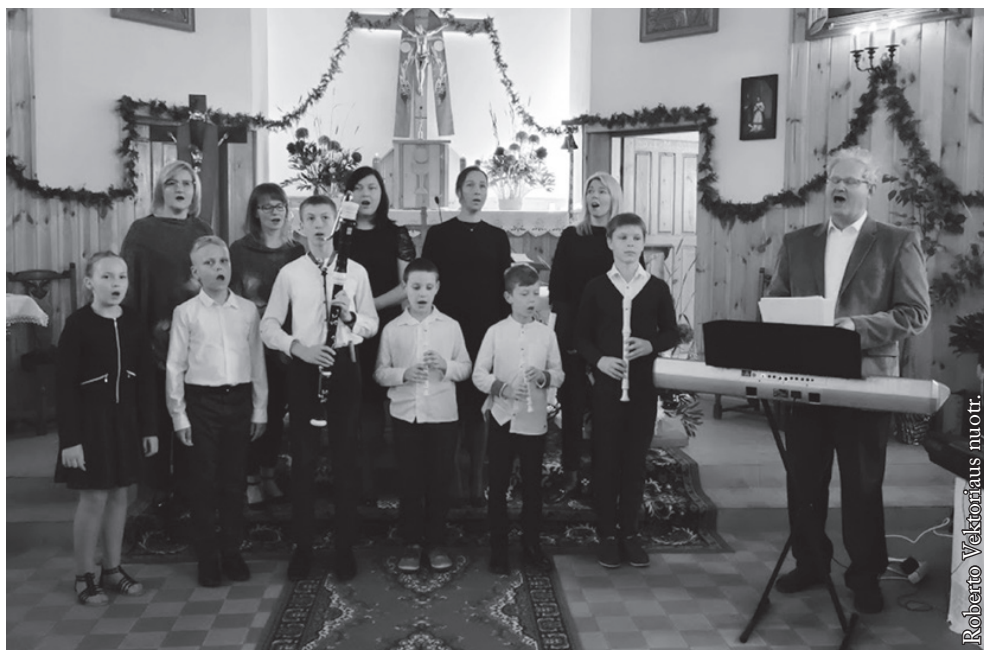
Seinų „Lietuvių namų“ choras

Žagarių bažnytelės bendruomenė labai atsakingai priėmė šį Šv. Kazimiero draugijos sumanymą ir įpareigojimą. Kiekvienais metais šio ir aplinkinių kaimų gyventojai tvarko aplinką, nesuskaičiuojamų gėlių puokštėmis puošia bažnyčios vidų,