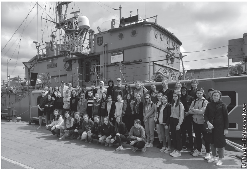
Punsko Kovo 11-osios licėjaus moksleiviai Lietuvos pajūryje