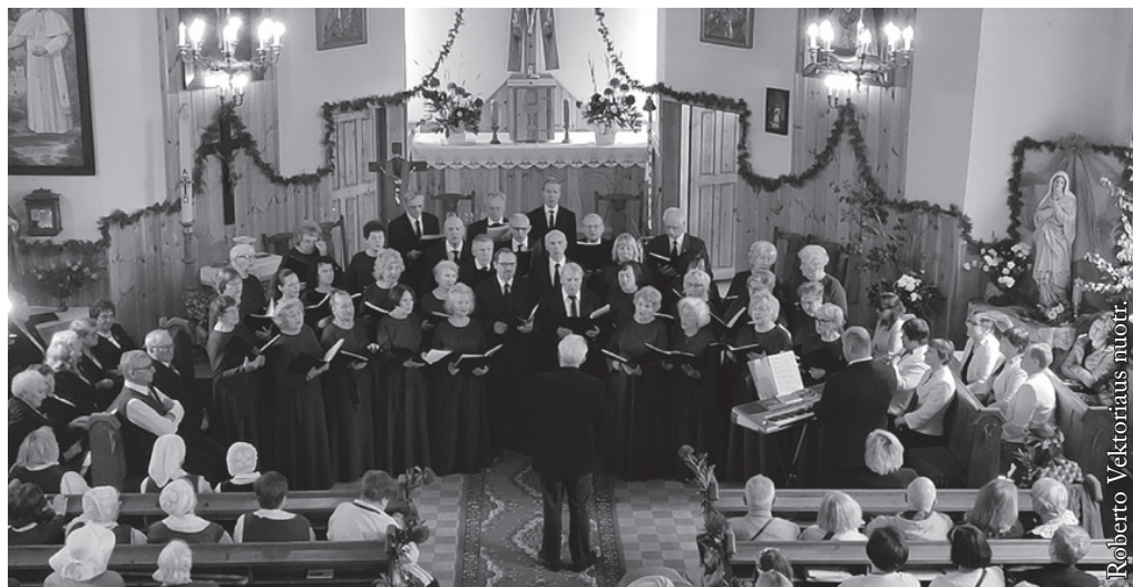
Kauno Stasio Lozoraičio senjorų akademijos mišrus choras „Gimtinė“