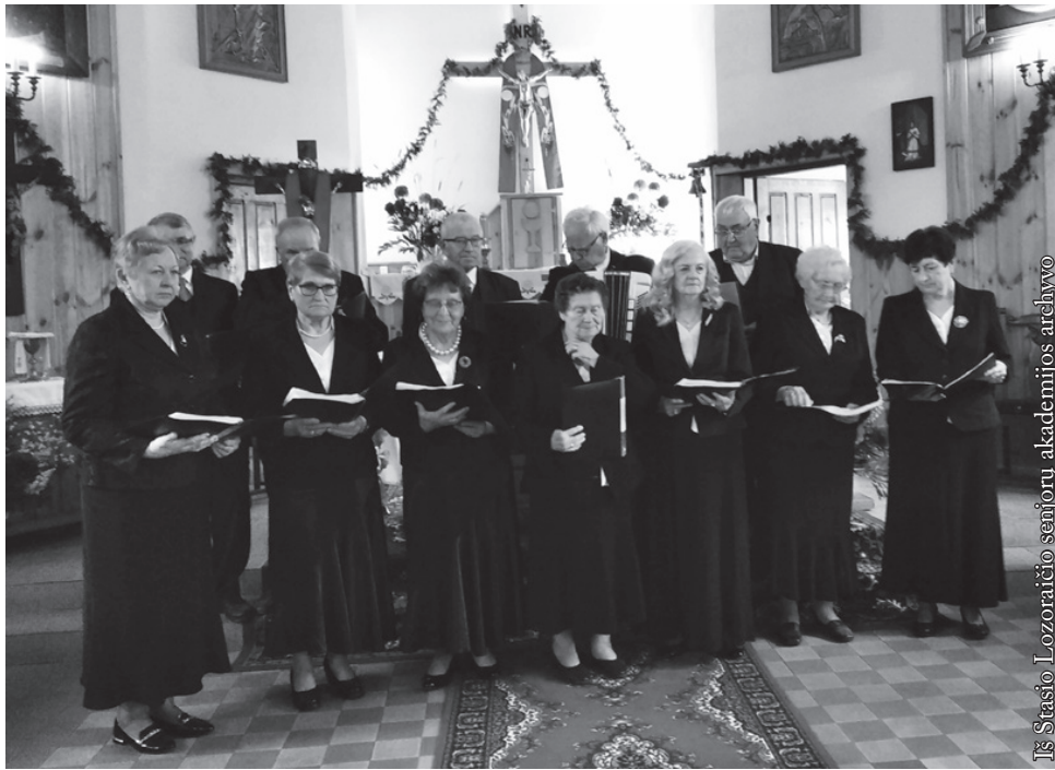
Punsko senjorų klubo ansamblis „Tėviškės aidai“

parūpina šventoriuje ankstesnių švenčių akimirkas primenančias dideles fotografijas, atviromis rankomis pasitinka atvykusius giesmininkus.