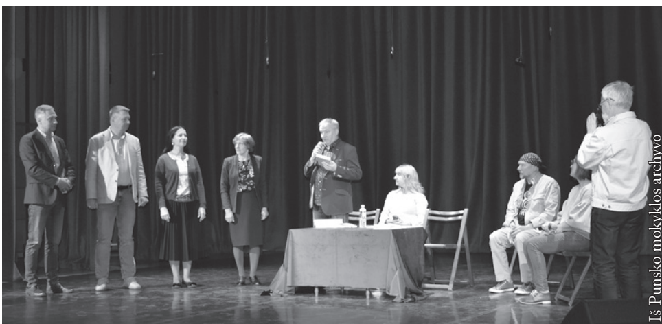
Poezijos pavasaris Punsko lietuvių kultūros namuose

Dar dvi dienas svečiai lankėsi Varšuvoje. Tą pačią dieną 18 val. dalyvavo renginyje „Poezija po kaštonais“, kuris vyko Varšuvos universitete dalyvaujant Baltistikos katedros studentams ir dėstytojams, o gegužės 23 d. 11 val. Karališkųjų Lazenkų (Łazienki Królewskie) parke buvo numatytas dar vienas susitikimas su poetais, pavadintas „Poezija, kava ir povai“ – pokalbiai su poetais, poezijos skaitymai.