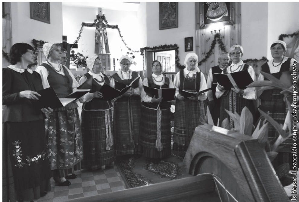
Punsko etnografinis ansamblis „Gimtinė“

Mano vaikystės Aradnykų kaimas – visai netoli, galima sakyti, Žagarių kaimynas. Siandien į gegužines pamaldas ir visa, kas su jomis susiję, žvelgiu jau subrendusios moters akimis. Mariją šlovinau kartu su Punsko chorą „Dzūkija“, giedodama lietuviškai ir... lotyniškai.