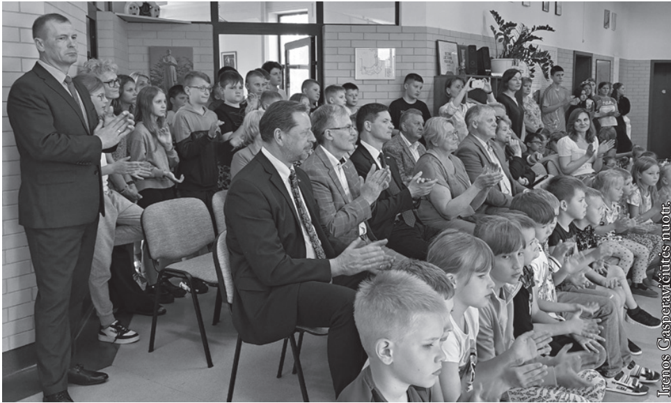
Seinų lietuvių „Žiburio“ mokykloje

didinti šio krašto atsparumą įvairioms išorės grėsmėms.