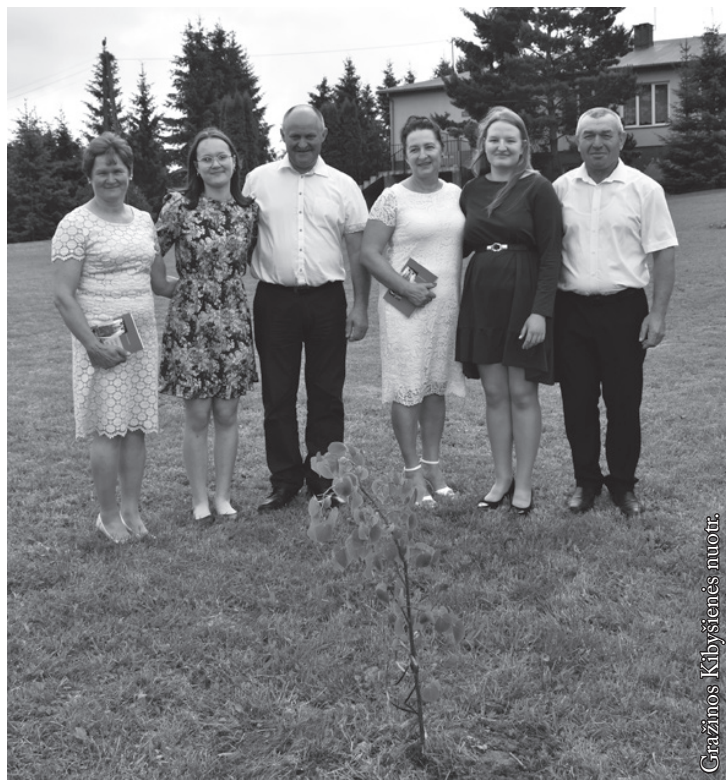
Aštuntokės su tėveliais