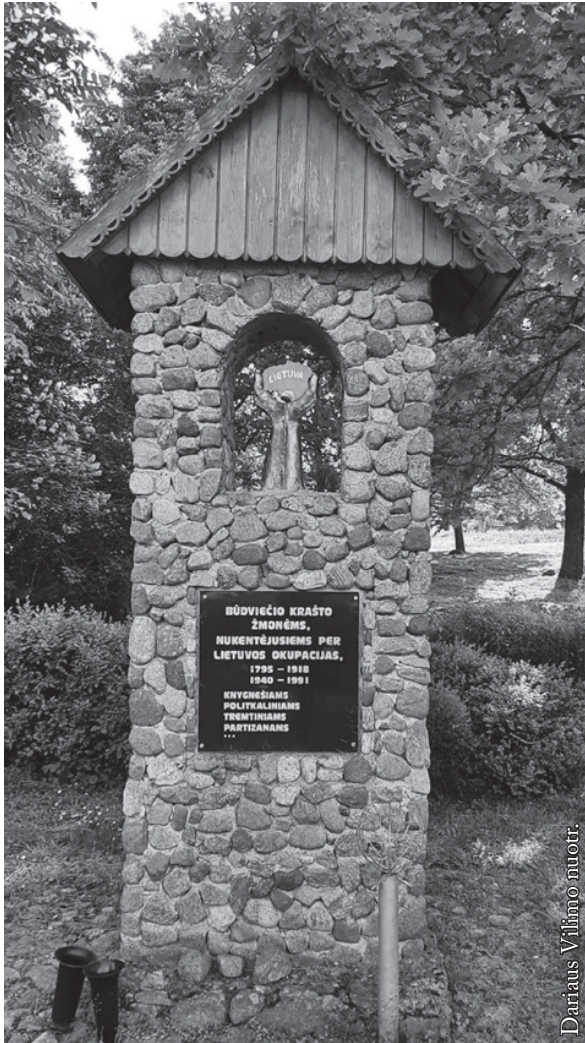
Paminklas Būdviečio krašto žmonėms, nukentėjusiems per Lietuvos okupacijas 1795–1918, 1940–1991, knygnešiams, politkaliniams, tremtiniams ir partizanams

iš Lietuvos buvo ištremta (daugiausia į Sibirą, Krasnojarsko kraštą ir Irkutsko sritį) mažų mažiausiai 132 000 lietuvių. Apie 70 % visų tremtinių buvo moterys ir vaikai. Jie gyveno ir dirbo sunkiausius darbus taigoje ir tundroje, galima sakyti, už dyką.