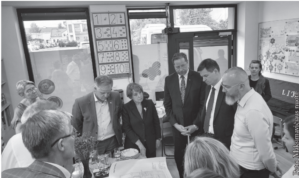
Suvalkų lietuvių vaikų darželyje