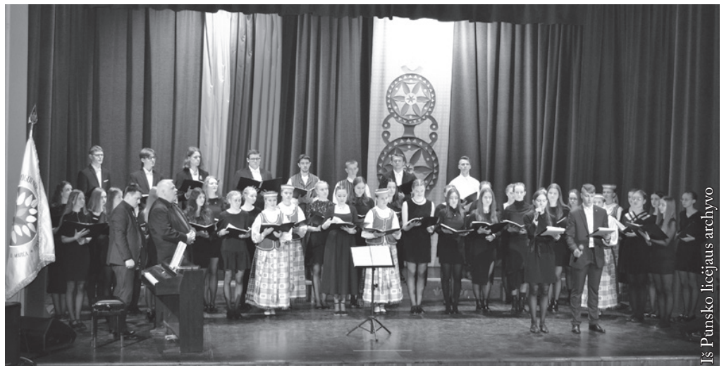
Choras „Pašešupiai“ Kovo 11-osios koncerte

ką galima daryti kitaip, kad mūsų veikla būtų dar efektyvesnė, prasmingesnė. Suvokiame, kad darbas su jaunimu reikalauja vis daugiau energijos, pasiaukojimo, sugebėjimų, vis naujų sumanymų. Tai pastebi mokslo metus apibendrinami ir mūsų mokiniai. Mokinys mėgsta būti dėmesio centre, jis nori vis ką įdomaus sužinoti. Ir taip turėtų būti... Bet mokiniai labai skirtingi, skiriasi jų gebėjimai ir gyvenimo tikslai. Vieni dėkoja mokytojams už pasiaukojimą, vertina išvykas, galimybę mokytis gimtąja kalba, rinktis įvairius popietinius būrelius, kiti nori mažiau ribojimų mokykloje ir „normalių santykių“. Suprantame, kad reikia stebėti kiekvieną vaiką, atsižvelgti į kiekvieną individualiai. Mokytojai aišku, kad nepaprastai svarbus dalykas mokinio vidinė motyvacija, kurios šiandien labai pasigendama. Mokinys turi žinoti, kam jis moko, todėl taip svarbu ta linkme dirbti visai mokyklos bendruomenei. Mes, mokytojai, rašome, kad mus suprastų, kalbame, kad išgirstų, skaitome, kad augtume... Stenkimės visi kartu, kad mūsų licėjus, vienintelis toks pasaulyje, būtų vertas pasididžiavimo, kad jį baigusieji surastų tinkamą vietą gyvenime, išlaikytų tautinį sąmoningumą, turėtų moralinį stuburą.