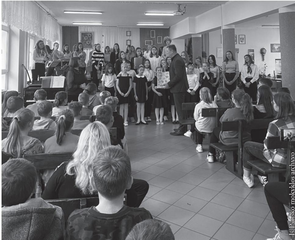
Iš Punsko mokyklos archyvo

mokiniai priminė skaudžius mūsų istorijos faktus. Jie papasakojo, kaip 1991 metų sausį Lietuvai patyrus sovietų karinę agresiją tūkstančiai šalies žmonių drąsiai gynė atkurta Lietuvos Nepriklausomybę.