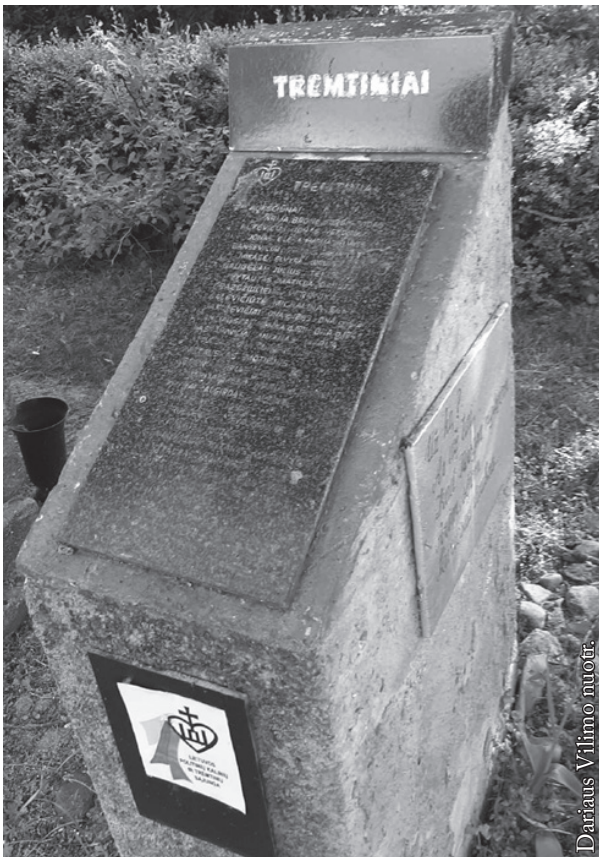
Paminklas tremtiniams Būdvietyje, Lazdijų rajone

Masiniai trėmimai Lietuvoje atsinaujino 1945 m. Iš pradžių okupacinei valdžiai trūko ir patirties, ir padėjėjų. Bet partizaniniam karui nerimstant, pradėtos didžiulės „planinės“ tremtys, parengtos Maskvoje. Štai 1948 m. pavasarį (vadinamoji operacija „Vesna“) iš Lietuvos ištremta daugiau kaip 40 tūkst., 1949 m. pavasarį (operacija „Priboj“) – beveik 30 tūkst., 1951 m. rudenį (operacija „Osen“) – dar per 20 tūkst. žmonių. Iš viso per 1940–1953 m. trėmimus