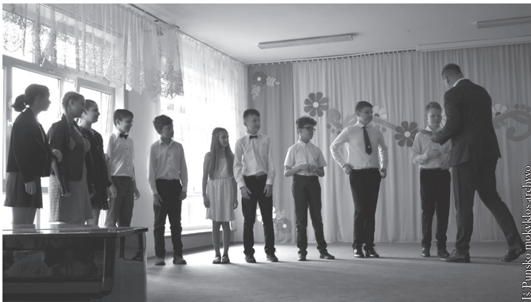
Iš Punsko mokyklos archyvo

Spalio 17 d. LR konsulato Seinuose vadovas suorganizavo ekskursiją į Druskininkus. Dalyvavo mokiniai iš Vidugirių, Seinų ir Punsko mokyklų. Tai buvusi dovana moksleiviams, pasiekusiems aukščiausius mokymosi rezultatus. Išvyka buvo nuostabi ir nepakartojama. O spalio 21-ąją į mūsų mokyklą atvyko svečiai iš Vilniaus Martyno Mažvydo progimnazijos. Jie