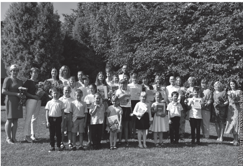
Mokslo metų pabaiga