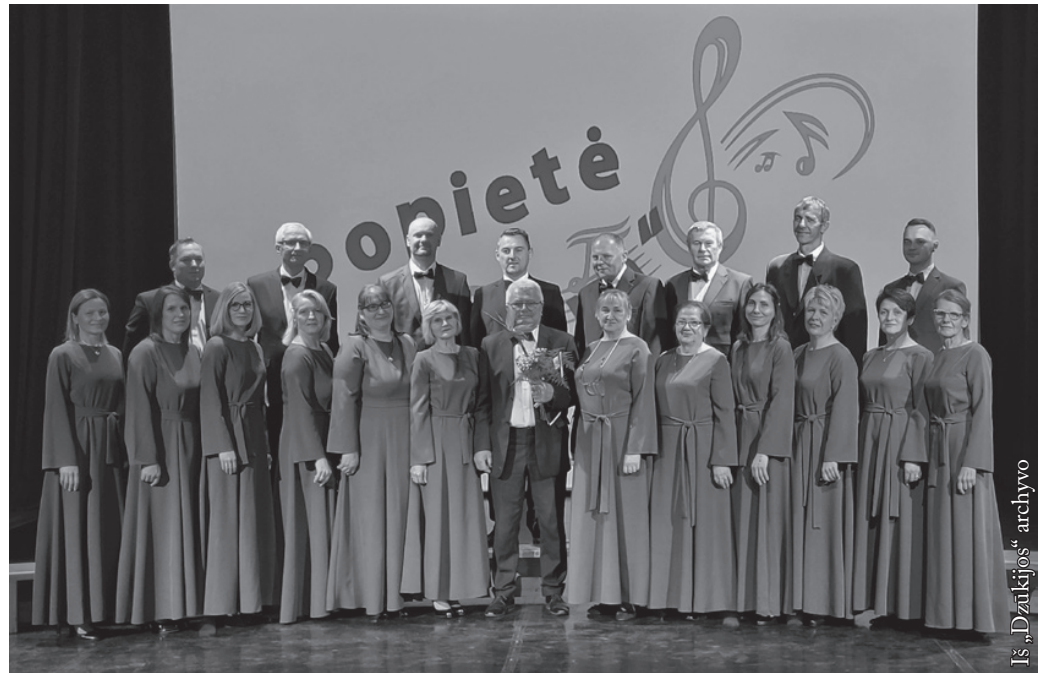
„Popietė su daina“