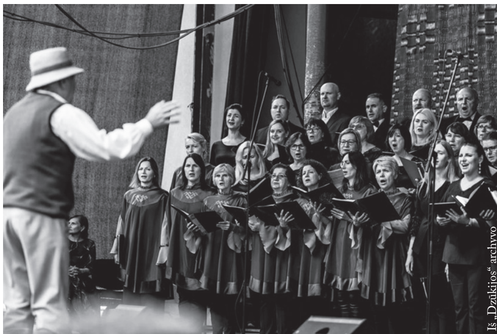
Dzūkų dainų ir šokių šventė „Tradicijų keliu“

Galbūt paskaičius gali atrodyti, kad choristo dalia labai sunki: tiek koncertų, repeticijų! Tačiau būtent visa tai atperka pasirodymai scenoje, žiūrovų plojimai, malonūs atsiliepimai, naujos pažintys ir patirtys, bendravimas su kitais choristais bei dirigentais ir dainavimas kartu, taip pat artimos ir tolimos kelionės. Beje, Punsko LKN meno ansamblių veiklą, artimas „Dzūkijos“ keliones remia (jų transporto išlaidas padengia) Lenkijos Respublikos vidaus reikalų ir administracijos ministerija. Už tai „Dzūkijos“ choras kartu su vadovu unisonu taria ačiū!