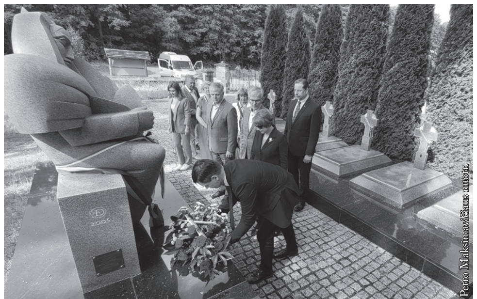
Berznyke prie Lietuvos savanorių kapų