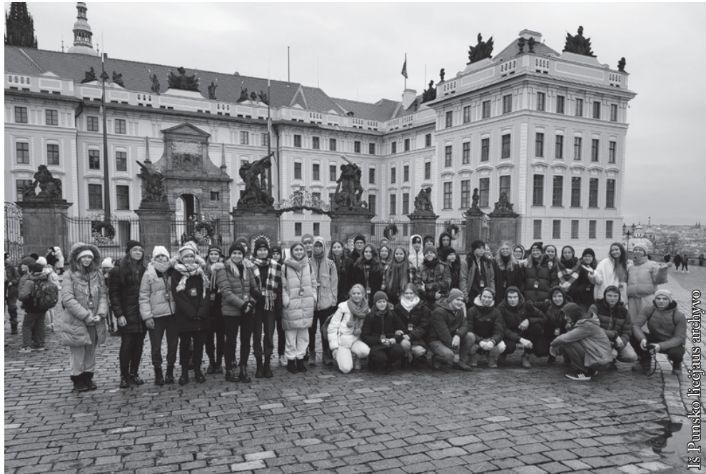
Punsko licėjaus mokiniai Prahoje