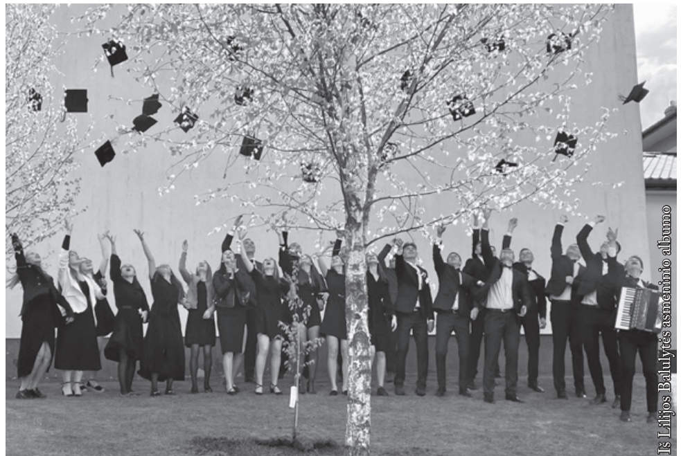
2023 metų Punsko Kovo 11-osios licėjaus absolventai

Pirmieji metai licėjuje suteikė mums daug džiaugsmo. Pamatėme, kad mokytojai labai geranoriški, draugiški. Suvokėme, jog mokytis nėra nuobodu, kad licėjuje vyksta daug įdomių dalykų, daug galima sužinoti ir išmokti. Susipažinome su mokyklos bendruomene, susidraugavome. Sužinojome, kokios yra mokyklinės šventės ir licėjaus tradicijos. Deja, 2020 m. kovo mėnesį mus užklupo koronaviruso pandemija. Sužinojome, kad mokysimės nuotoliniu būdu. Vieni džiaugėsi, kiti liūdėjo, mat reikėjo išmokti naudotis visa reikiama nuotoliniam mokymui įranga. Pykome ir karščiavomės, kai namuose būdavo silpnas interneto ryšys ar reikėdavo tildyti jaunesnius brolius ir sesutes, kartais net mamą, įjungusią siurblių. Retkarčiais pamokose tekdavo dalyvauti būnant lauke, sėdint mašinoje ar traktoriuje. Kodėl gi namuose negalime daryti kelių dalykų vienu metu? Taigi taupome laiką, – manėme. Tačiau kartais net septynias valandas sėdėdami prie kompiuterio ekrano jautėmės labiau pavargę negu mokykloje. Nuotolinis