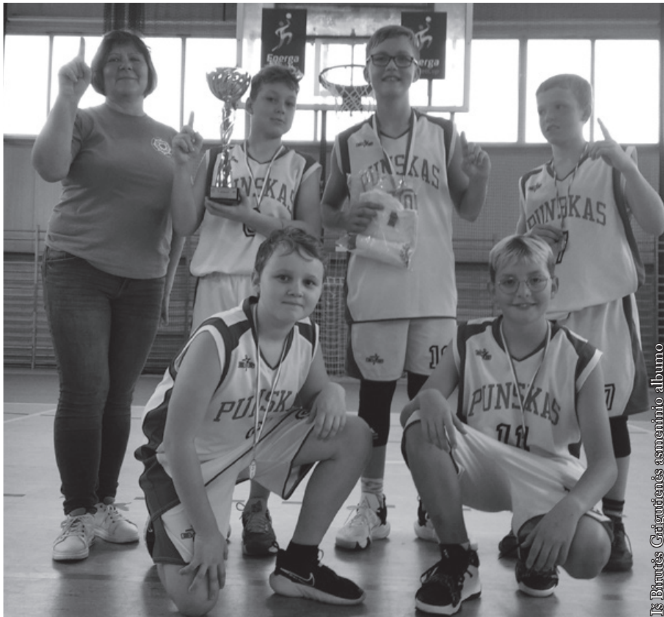
Auksinė Palenkės vaivadijos komanda (3x3 krepšinis)

Taigi nepaisant to, kad šiuo laikotarpiu daug vaikų sirgo, šėlo pūga ir buvo slidu, mums pavyko iškovoti Palenkės vaivadijoje bronzą. Tokie pasiekimai nedidelei mūsų mokyklai tikrai malonūs, tuo labiau kad pasitaiko ne kasmet. Vaikų krepšinio komandą reikia ugdyti kelerius metus. Tenka išlieti daug prakaito popietiniuose užsiėmimuose, dalyvauti turnyruose ir varžybose. Punske neturime krepšinio trenerių profesionalų nei klubų. Vaikai mokosi krepšinio pagrindų per fizinio lavinimo pamokas, popietiniuose užsiėmimuose, stebėdami vyresnių draugų ar suaugusiųjų varžybas. Taip pat šiltesniu metų laikotarpiu patys žaidžia lauko aikštelėje prie mokyklos ar savo namų kiemuose. Nors pandemijos laikotarpis ir nuotolinis mokymas fizinį aktyvumą „išmušė iš vėžių“, daug kam sunku ar nesinori judėti, o ilgas bendravimas su kompiuteriu ar telefonu lėtina fizinę reakciją, džiugu, kad vis dar yra grupė vaikų, kurie labai mėgsta krepšinį. Šis žaidimas lavina fiziškai, ugdo komandinio darbo įgūdžius, norą išbandyti savo jėgas su vis stipresnėmis