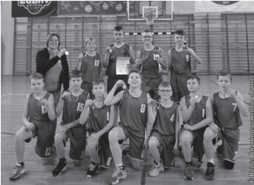
Bronzos medalių laimėtojai

komandomis. Dalyvavimas turnyruose ir varžybose suteikia galimybę išgyventi pergalės jausmą, bet ir moko oriai priimti nesėkmes, pralaimėti, po to vėl dirbti ir tobulėti. Žodžiu, moko gyvenimo. Tai yra vaikų ir jaunimo auklėjimo forma.