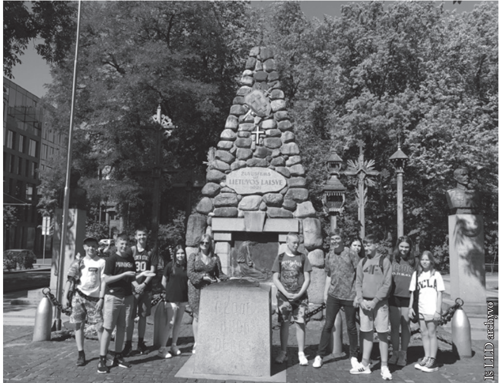
Prie amžinosios ugnies aukuro

Šių metų birželio 20 dieną Seinų lietuvių „Žiburio“, Punsko Dariaus ir Girėno bei Vidugirių pagrindinių mokyklų vyresniųjų klasių moksleiviai – konkursų laimėtojai, dalyvavo