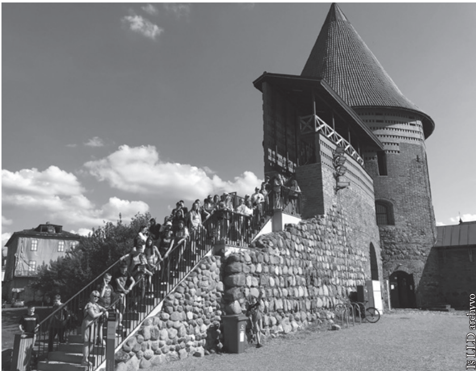
Prie Kauno pilies

Konkursų laureatų kelionę į Lietuvą rėmė Lenkijos Respublikos vidaus reikalų ir administracijos ministerija. Nuoširdžiai dėkojame.