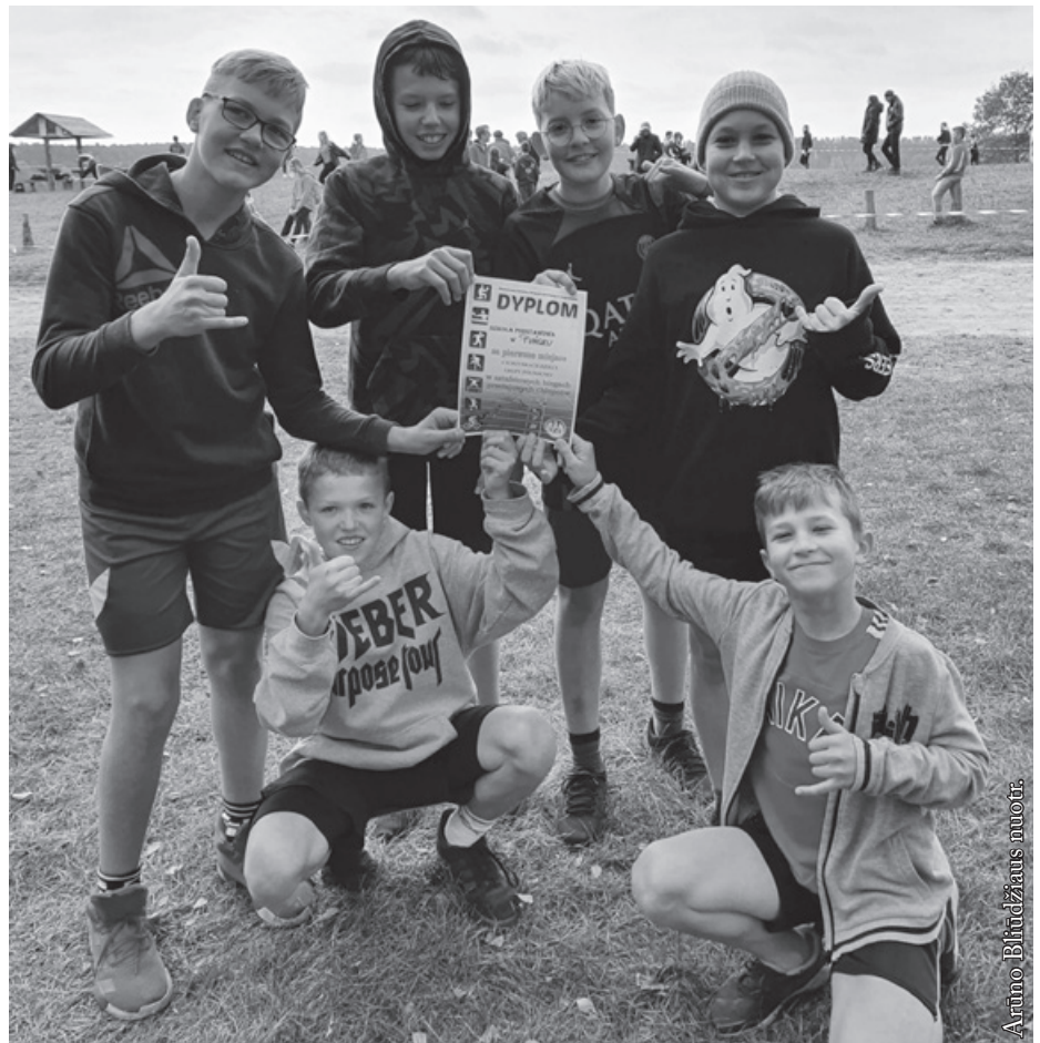
Punsko Dariaus ir Girėno pagrindinės mokyklos bėgikai Augustave

Spalio 25 dieną Balstogėje vyko jaunimo, gimusio 2008–2009 metais, Palenkės vaivadijos finalinės 3x3 krepšinio varžybos. Varžėsi 17