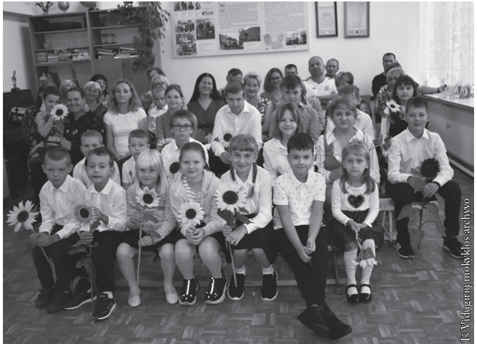
Mokslo metų pradžia Vidugirių mokykloje

Seinų lietuvių „Žiburio“ mokykla devynioliktuosius darbo metus pradėjo su 107 mokiniais. Pati didžiausia naujiena ta, kad su mūsų 9 pirmokėliais mokyklą lanko 3 būsimos Suvalkų mokyklos mokiniai. Suvalkų mokyklai skirtas pastatas dar remontuojamas ir pritaikomas mokymui, tad pirma klasė dirba