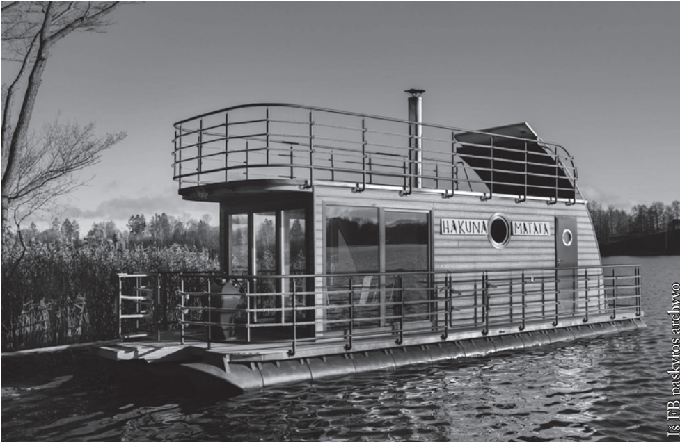
„Hakuna Matata“ – plaukiojanti pirtis

buvo nuostabus, šiltas ir dar saulėtas, laivelis nepaprastas, o savininkas – atvirai ir su aistros savo naujam amatui kibirkštimi pasirengęs papasakoti apie neeilinį kūrinį. Ežero vanduo labai ramina, atpalaiduoja jo sūpavimas, pats žiūrėjimas į jį. Taigi „Hakuna Matata“ – pradedam! ☺