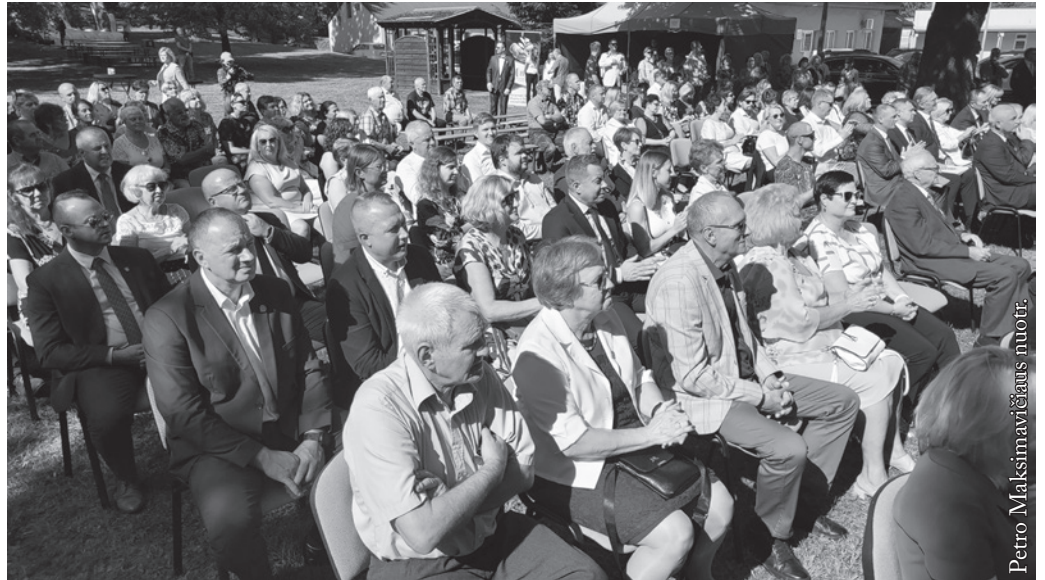
Seinų ligoninės jubiliejaus dalyviai