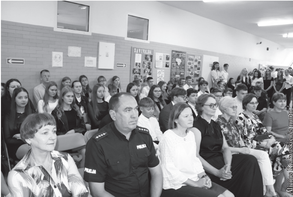
Punsko Kovo 11-osios lietuvių licėjuje