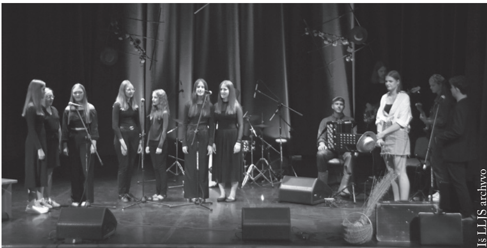
Estradinių dainų šventės akimirka

Tokio pobūdžio renginiai suburia jaunus žmones, teikia daug gerų emocijų ne tik dalyviams, bet ir organizatoriams. Sukuria galimybę parodyti talentą, pakelti tautinio sąmoningumo lygį, prisideda prie lietuvių kultūros puoselėjimo, sklaidos, formuoja kultūriškai susipratusią visuomenę, ugdo bendruomeniškumo jausmą. Todėl svarbu, kad ši tradicija būtų tęsiama, kad vis daugiau jaunimo aktyviai dalyvautų kultūrinėje ir visuomeninėje veikloje.