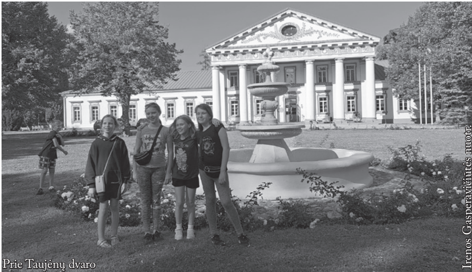
Prie Taujėnų dvaro