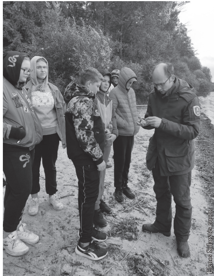
Prie Dusios ežero

Kadangi diena pasitaikė vėjuota, ilgai būti prie ežero nebuvo įmanoma. Kai įėjome į mišką, viskas nurimo ir