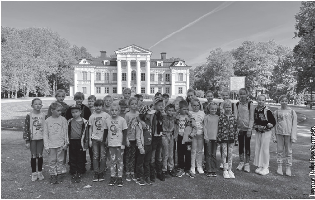
Prie Paežerių dvaro

pritraukia tiek turiniu, tiek pristatymo forma. Ekspozicijos vaizduoja Lazdijų krašto dalyvavimą partizanų kovose ir šio krašto žmonių tremties istorijas. Čia, tarp kitko, galima rasti kainoraštį, sudarytą pagal Lazdijų krašto tremtinių prisiminimus: