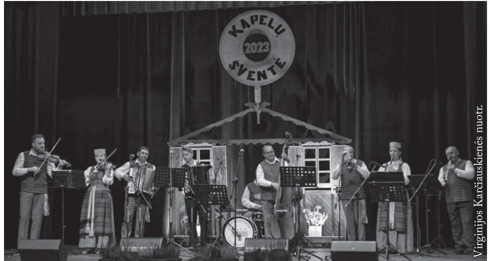
Punsko lietuvių kultūros namų kapela „Klumpė“

Pirmieji scenoje pasirodė šeiminkai – Seinų „Lietuvių namų“ liaudiškos muzikos kapela „Šalcinis“,