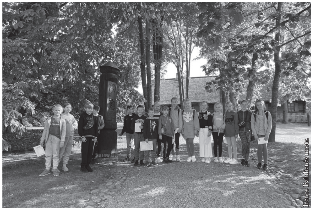
Jono Basanavičiaus tėviškėje Ožkabaliuose

Rugsėjo 26 dieną I–IV kl. mokinukai nuvyko į Jono Basanavičiaus gimtinę Ožkabaliuose. Aplankę so-