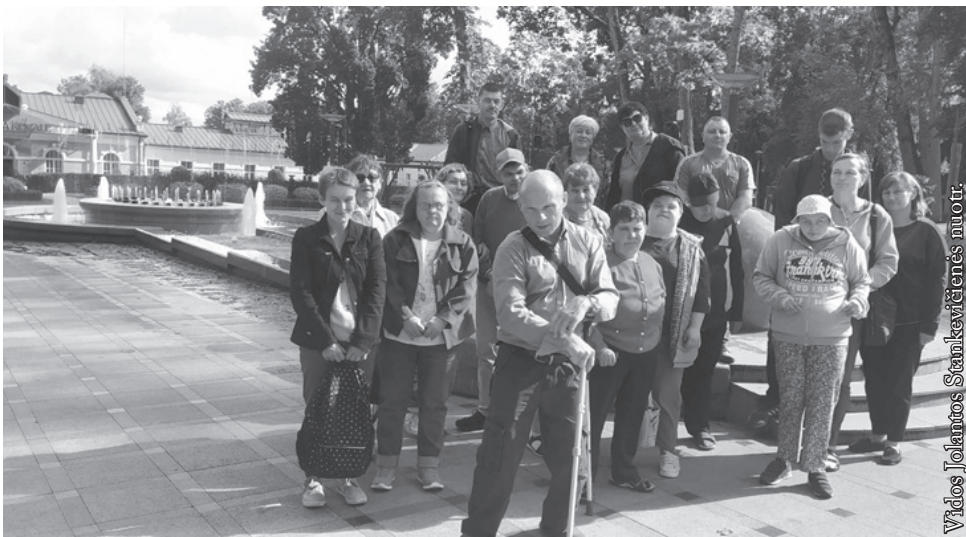
Vidos Jolantos Stankevičienės nuotr.

Norėtume nuoširdžiai padėkoti Pramogų ir poilsio centro šeimininkams už neįgaliųjų šiltą priėmimą ir paramą. Ačiū Punsko savivaldybei už transporto kelionei į Druskininkus parūpinimą bei visiems, kurie paaukojo savo 1 % metinių pajamų mokesčio. Labai ačiū taip pat Kanados lietuvių fondui, kuris 2023 m. skyrė „Viltelės“ klubui 1000 Kanados dolerių. Rėmėjų dėka „Viltelės“ klubo globotiniai gali praturtinti savo pomėgius ir įgyvendinti svajones.