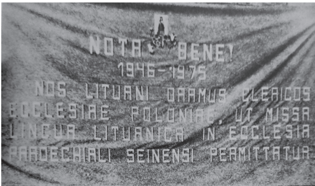
Nuotraukoje plakatas, kurį 1975 m. Seinų katedros pakėlimo bazilika proga – iškilmių metu, Seinų, Punsko ir kitų apylinkių lietuviai buvo iškėlę prieš svečių tribūną. Plakatas šilkinis ir turėjo lotynišką įrašą: „NOTA BENE! 1946-1975 Nos Lituani oramus clericos Ecclesiae Poloniae, ut Missa lingua Lituonica in Ecclesia paroechiali Seinensi permittatur“. Liet. vertimas: „Įsidėmėk! 1946-1975 mes, lietuviai, meldžiame Lenkijos Bažnyčios dvasininkijai, kad Seinų parapijos bažnyčioje Mišios būtų lietuvių kalba“.