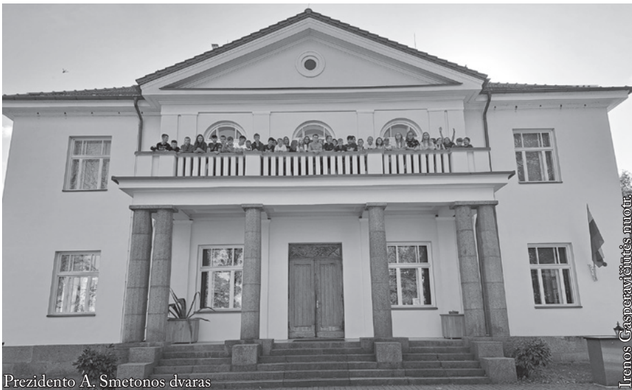
Prezidento A. Smetonos dvaras