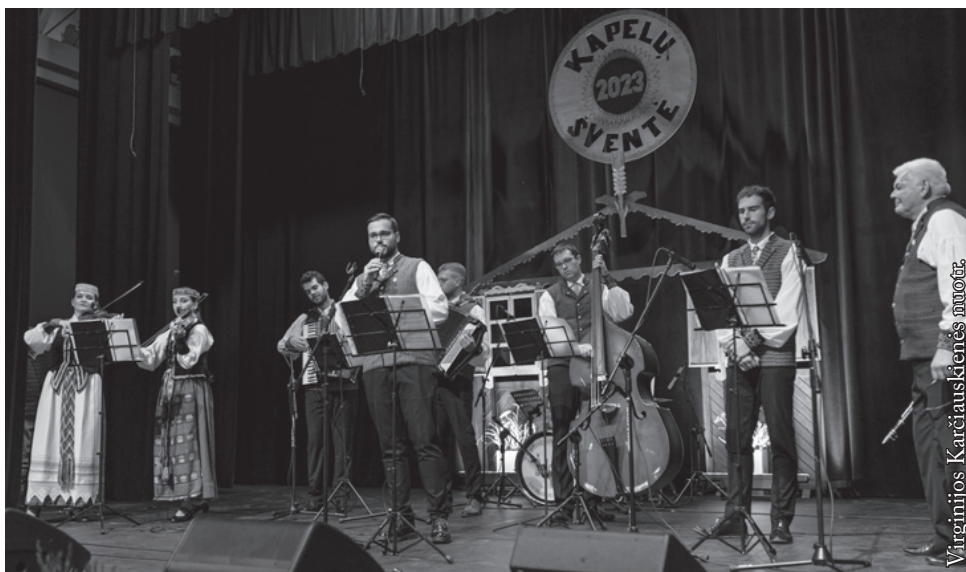
VDU Žemės ūkio akademijos liaudiškos muzikos kapela „Ūkininkas“

Dėkojame šventės dalyviams, visai renginio komandai, bet ypač rėmėjams – Lietuvos Respublikos užsienio reikalų ministerijai, Globalios Lietuvos departamentui bei Lenkijos Respublikos vidaus reikalų ir administracijos ministerijai už skirtą finansinę paramą. Džiaugiamės, kad ši šventė ne tik suburia ir pradžiugina mūsų krašto gyventojus, bet ir parodo, kaip svarbu yra puoselėti lietuvių kultūrą ir tradicijas.