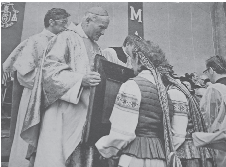
1975.IX.7, seiniškės Dievo Motinos karūnavimo iškilnių metu, Seinų lietuviai sveikina Krokovo kardinolą Karolį Wojtylą (vėliau Šv. Tėvas Jonas Paulius II) ir įteikia jam dovaną

Lietuviai dalyvauja Seinų bei Suvalkų apskričių tarybose. Suvalkų