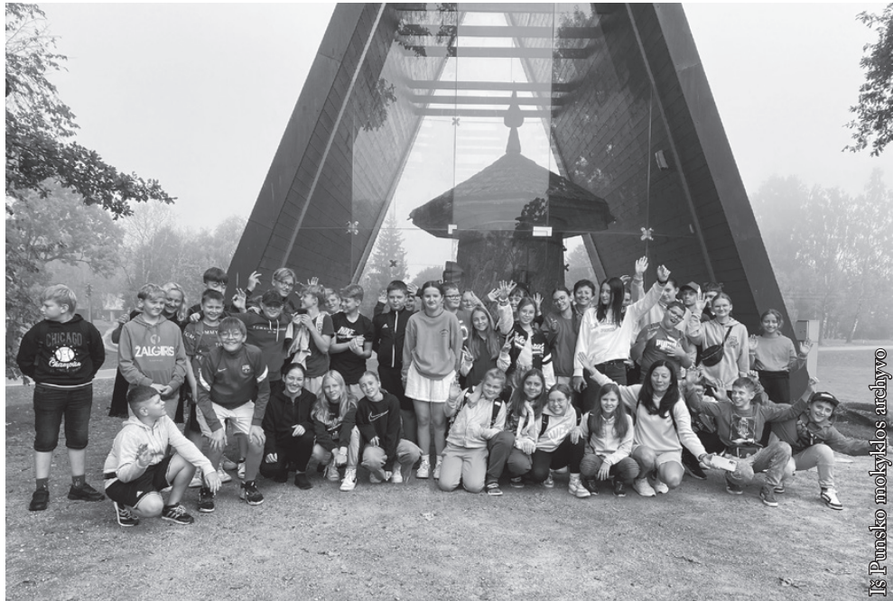
Prie Dionizo Poškos Baublio Bijotuose