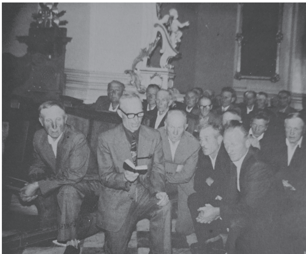
Būrelis Seinų lietuvių vyrų gieda lietuviškas giesmes Seinų bazilikoje 1981 m.

taip lengvai sunaikinti. Jis susigūžė, įsikibo savo tėvų žemės ir laikėsi. Laikėsi jis tyliai ir kantriai, užtat pastangos paversti jį lenku tapo dar įnirtingesnės...“