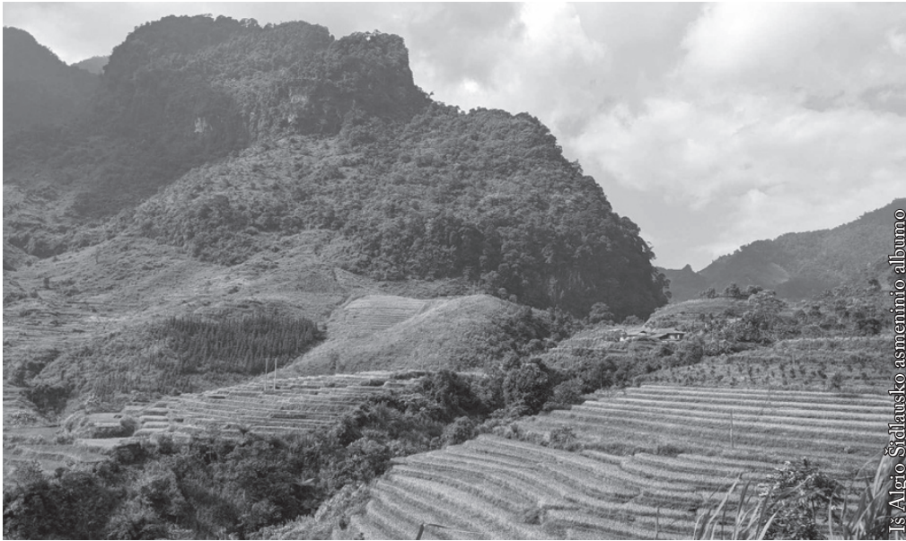
— Iš Algio Šidlausko asmeninio albumo