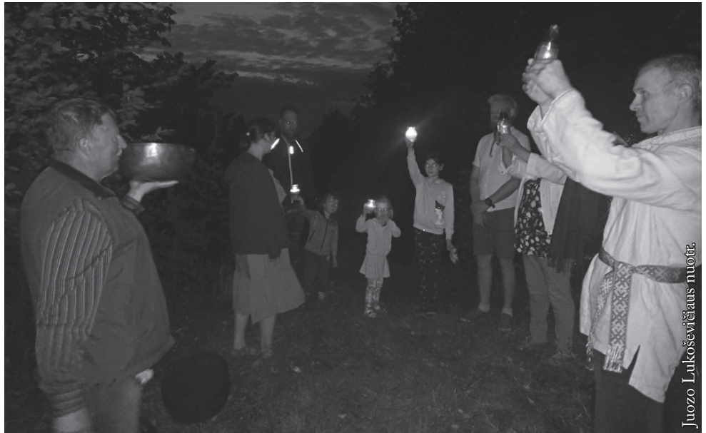
Baltų vienybės dieną Eglinėje