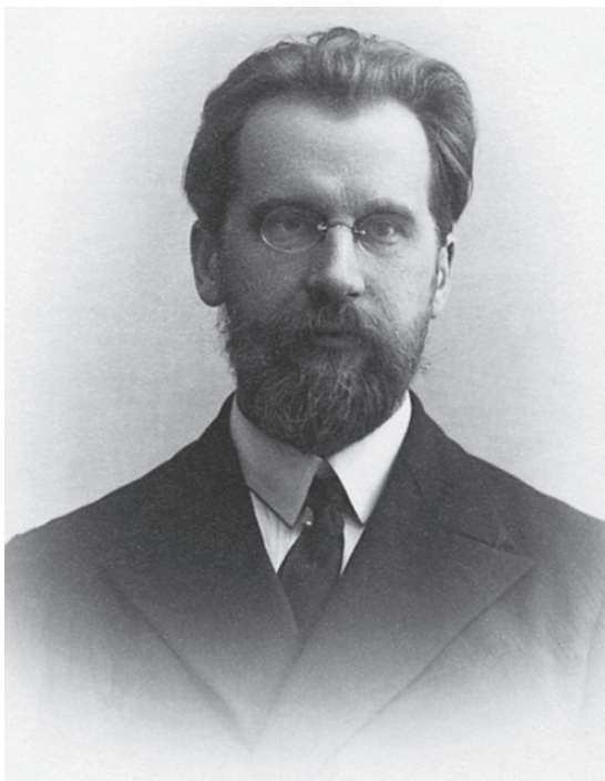
Mykolas Biržiška (LVLK pirmininkas 1919–1922 m.)

Šiandien trumpai ir fragmentiškai apžvelgsime Rytų ir Pietryčių Lietuvos lietuvių lietuviybės palaikymą, pasireiškiantį atsidavimu, ištikimybe savo kalbai ir kultūrai bei gebėjimu veikti ekstremaliomis sąlygomis. Vienas iš jų potencialių savimonės ir ištvermės šaltinių buvo tautinio atgimimo intelektualus palikimas ir vadinamoji lietuviškoji dvasia, sukaupta daugiausiai mūsų valstybingumo židinyje Vilniuje dar ir žymiai ankstesnių šimtmečių istorijos laikotarpiais. Tas dvasingas požiūris į savąją praeitį buvo atrama ir Vilniaus lietuviams čia aptariamam laikotarpiui.