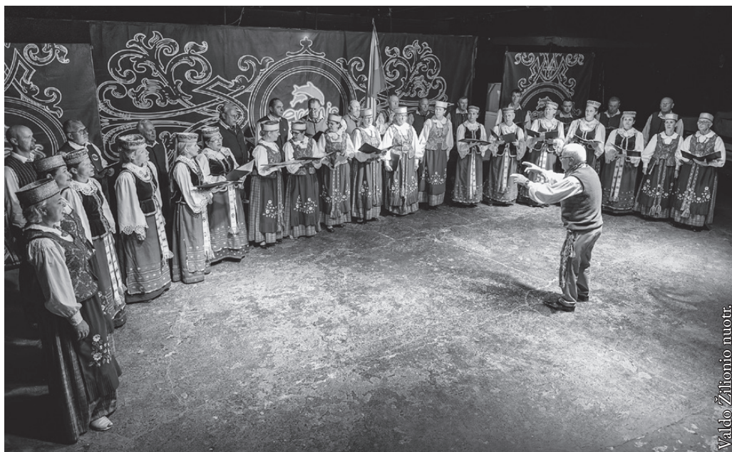
Koncertas Side mieste

Spalio 6–13 dienomis abiejų chorų nariai dalyvavome XI tarptautiniame muzikos ir folkloro festivalyje ANTALYA FEST Turkijoje. Festivalio koncertai vyko Turkijos Rivjeroje, prie Viduržemio jūros, Manavgat ir Side miestuose. Jų metu pasirodė dar viena grupė iš Lietuvos – Domeikavos tautinių šokių kolektyvas „Džiaukis“ bei tautinių šokių grupė iš Maltos, taip pat keletas vaikų šokių grupių iš Turkijos (Antalijos miesto). Visi kolektyvai pristatė savo programas, trukusias apie 15 minučių. Jungtinis „Varsos“ ir „Dzūkijos“ choras dainavo lietuvių liaudies dainas. Dalis jų – tai būsimos jubiliejinės Dainų šventės repertuaras.