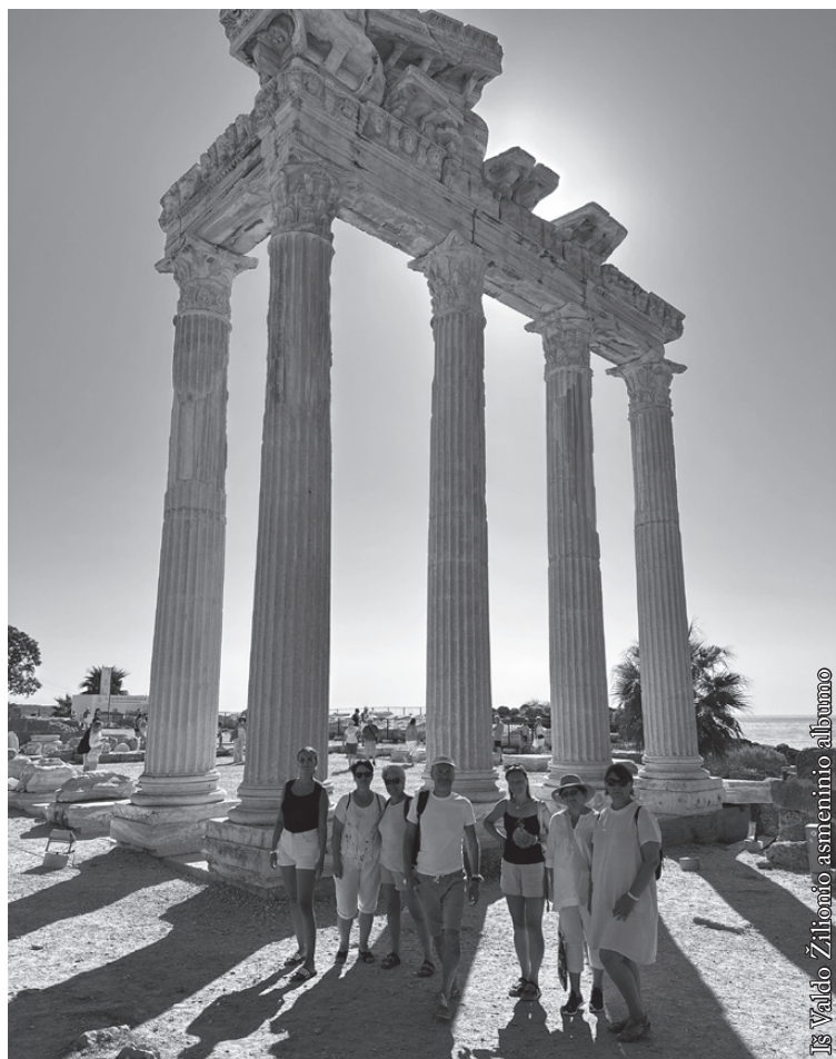
Side miesto archeologiniame muziejuje