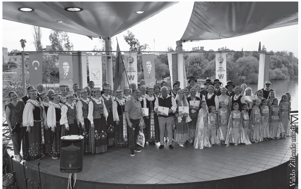
Visi festivalio dalyviai Manavgat miesto parke