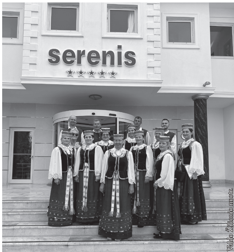
Prieš koncertą Manavgat mieste