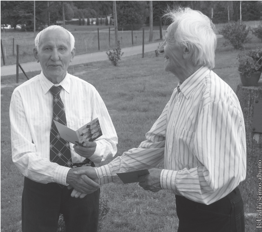
Iš Uzdilų šeimos albumo