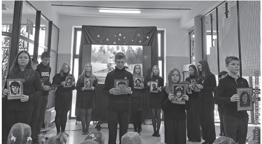
Seinų lietuvių „Žiburio“ mokiniai prisimena žuvusiuosius 1991 m. sausio 13-ąją

Sausio 12 d. tradiciškai 7 val. ryto mokyklos languose uždegėme atminimo žvakeles. Per ilgąją pertrauką mokiniai parodė paruoštą meno programėlę. Jie priminė kiekvieno įsimintą naktį žuvusio didvyrio gyvenimo akimirkas, jiems atminti uždegė žvakeles ir skyrė poezijos posmų. Pabaigoje sudainavo „Oi, neverk, motušėle“. Programą paruošė