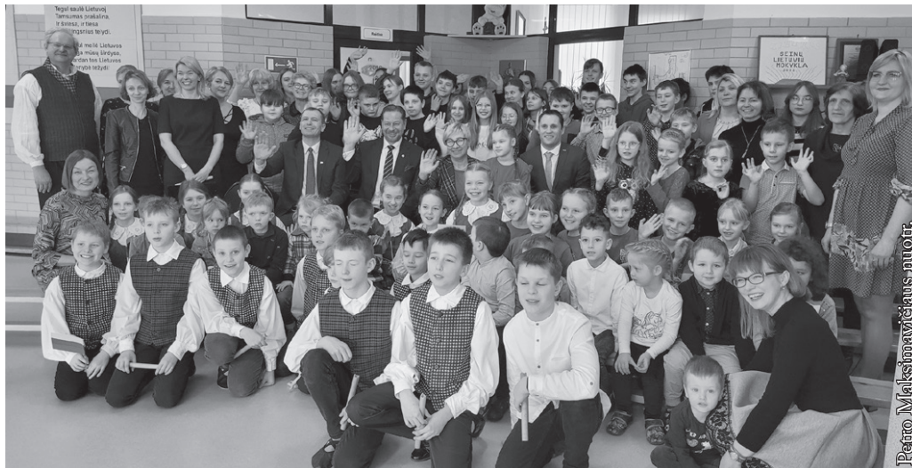
LR švietimo ministrė Jurgita Šiugždinienė „Žiburyje“

tam tikrą braižą jau galime pamatyti. Aš pritariu tiems, kurie sako, jog Lenkijoje švietimas tapo labai ideologizuotas. Buvo siekiama (o gal tai ir tęsis), kad vaikų ir jaunimo švietimas tarnautų pagrindiniam tikslui – tautinės valstybės kūrimui. Ir nebūtų čia nieko blogo, jeigu šalia to atsirastų platesnis požiūris į supantį pasaulį, kritinio mąstymo, savarankiškumo ieškant atsakymų į įvairius klausimus ugdymas. Šiandien, modernių technologijų sparčios plėtotės laikais, sudėtinga sukurti tokį švietimo modelį, kuris remtųsi tik politikų parinktais privalomų lektūrų sąrašais ir kryptingai parengtomis mokymo programomis. Jau nekalbant apie tai, kad toks mokyklos modelis tapo nemažu iššūkiu tautinių mažumų atstovams. Tarkime, kaip perteikti mokiniams žinias apie meilę lenkų kalbai ir besąlygišką pasididžiavimą šalies raida, jeigu jie taip pat norėtų mylėti savo gimtąją kalbą ir didžiuotis dvasinės Tėvynės pasiekimais.