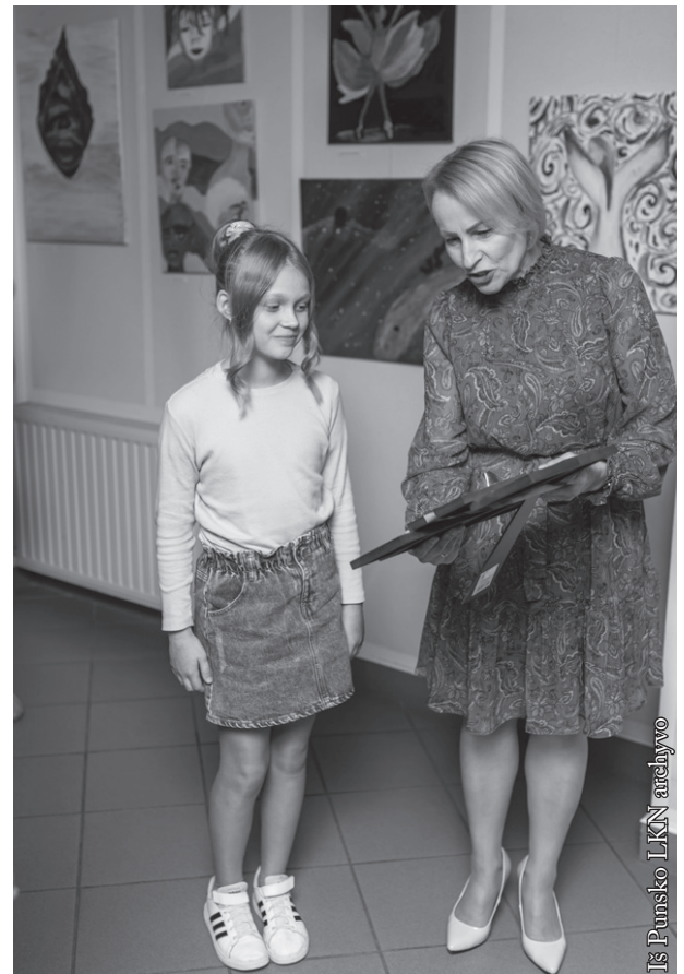
Vienos iš meno parodų akimirka

Ačiū visiems Punsco LKN ansamblių dalyviams, kolektyvų vadovams, visai šauniai darbuotojų komandai, kuri puikiai supranta savo vaidmenį mūsų krašte, kuri siekia, „kad giria žaliuotų“. Į taip pavadintą šimtmetį menančią Dainų šventę Lietuvoje kviečiame visus jau šiandien. Visi drauge įrodykim, kad Punsco krašte giria žaliuos!!!