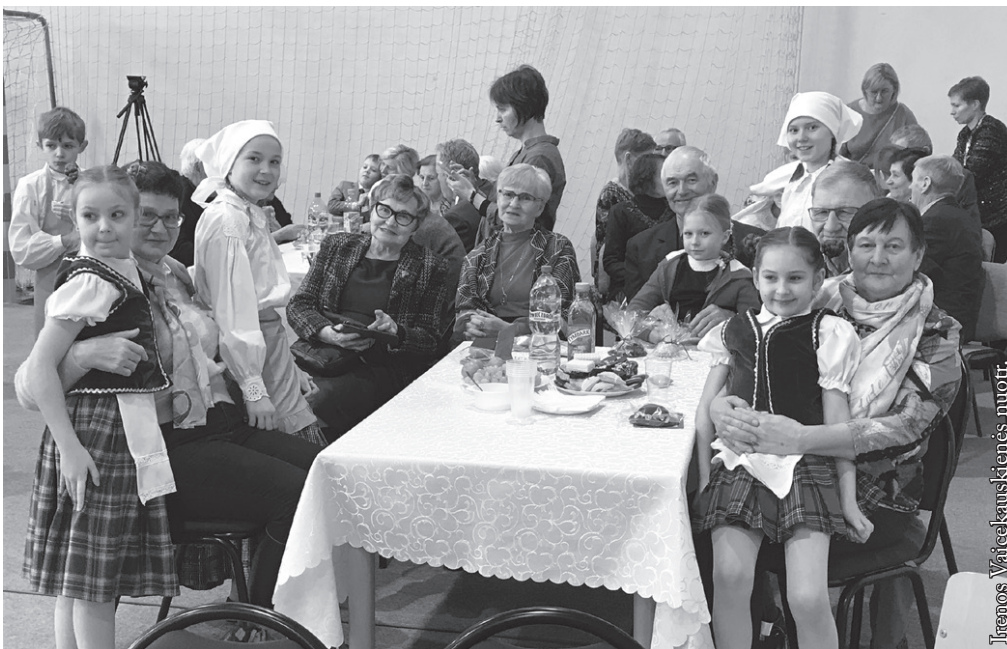
Senelių diena Seinų lietuvių „Žiburio“ mokykloje

Prieš išeidami žiemos atostogų, sausio 19 d. pakrikštijome „Žiburio“ pirmokus. Tradiciškai krikštą rengia mokyklos vyriausieji – aštuntokai ir patys pirmokai su auklėtoja parodo savo darbo rezultatus. Dabar pirmokų mokykloje yra 9, jų auklėtoja