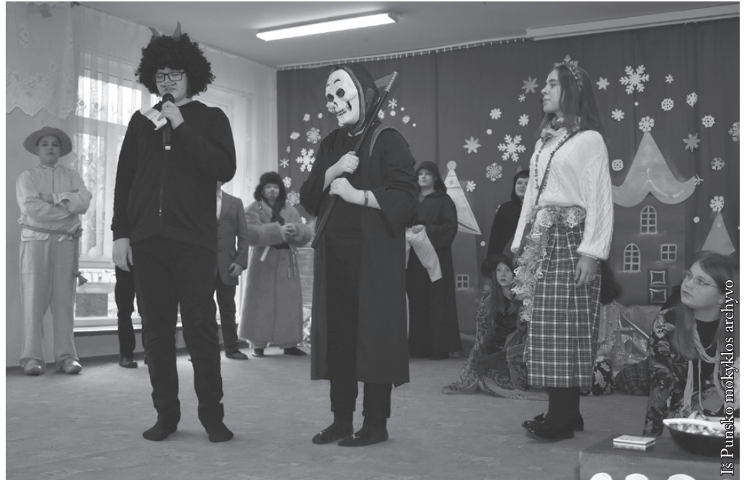
Iš Punsko mokyklos archyvo

Visi tą dieną buvome persirenę. Scenoje matėme Kanapinį, Lašininį, raganas, čigones, velnius,