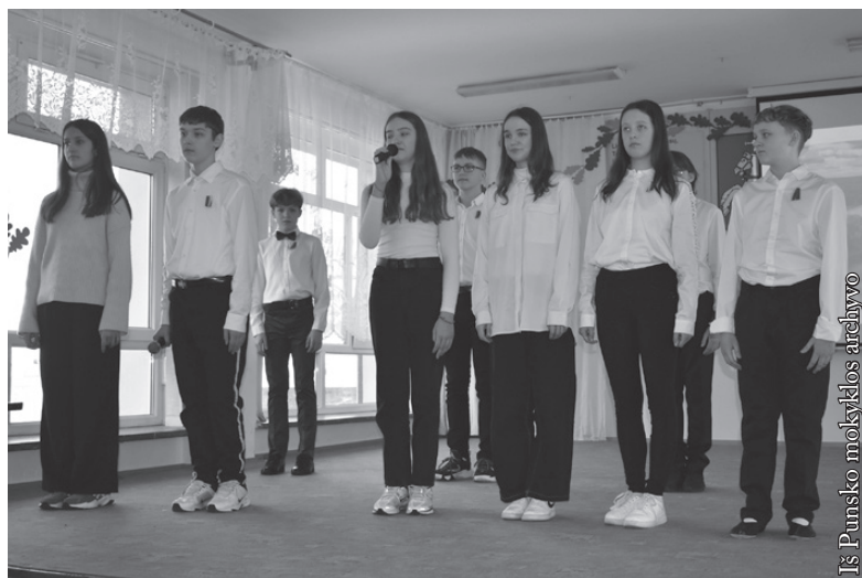
Iš Punsko mokyklos archyvo