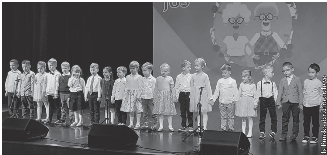
Punsko kultūros namuose vyko Senelių šventė

Darželyje vyko taip pat ilgai lauktas Kaukių balius. Ši šventė pilna džiaugsmo, pasižymi nepakartojama, linksma atmosfera. Mažieji linksminosi persirengę savo mėgstamiausiais veikėjais. Darželinukai mielai dalyvavo konkursuose, šoko ir dainavo. Kaukių balių praturtino daugybė spalvotų balionų.