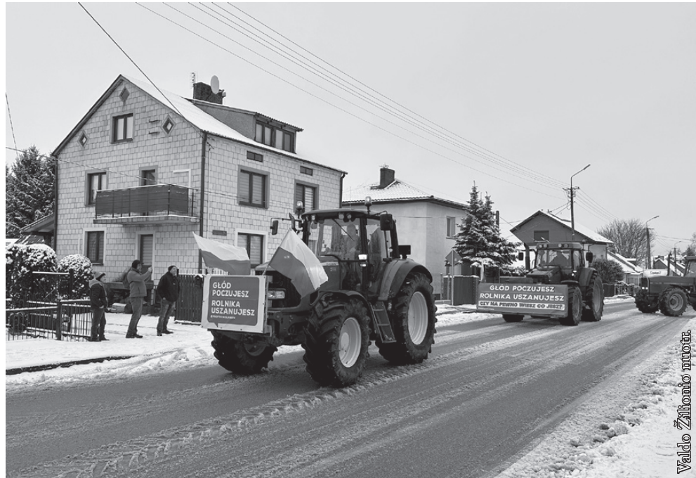
Valdo Žilionio nuotr.

Šių metų vasario 20 dienos (antradienio) rytą į Punsko bažnyčios aikštę suvažiavo keliasdešimt traktorių. Tai buvo šio krašto žemdirbių pasiruošimas Palenkės vaivadijos ūkininkų streikui. Kituose šalies regionuose jis tęsiasi jau kelias savaites. Visuotinį streiką Lenkijoje organizuoja nepriklausoma individualių ūkininkų profesinė sąjunga „Solidarumas“. Apie panašius streikus kitose Europos Sąjungos šalyse girdime nuo seniai. Lietuvoje protestai vyko visai neseniai. Tad mūsų regione buvo tik laiko klausimas, kada vietos žemdirbiai prisijungs prie pasipriešinimo dėl ES sistemos ūkininkus apsunkinančių reikalavimų. Visgi Lenkijoje prasidėjęs pasipriešinimas nėra lygus kitų ES narių ūkininkų streikams. Mūsų šalyje protestuojama