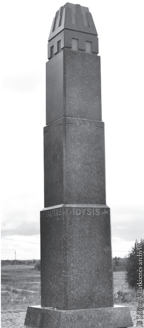
2010 m. birželio 26 d. netoli mečetės, ant kalnelio, atidengtas paminklas LDK valdovui Vytautui Didžiajam

Raižiuose stovėjo mečetė (dauguma totorių yra musulmonai). Šiandieninė mečetė pastatyta 1889 m. ir vienintelė Lietuvoje veikė sovietmečiu. Statybų metu į ją buvo perkeltas sudegusios Bazorų kaimo mečetės 1684 m. pagamintas minbaras (sakykla). Mečetė medinė, liaudies architektūros formų, stačiakampio plano su penkiasiene iškyša fasade, dvišlaičiu skardiniu stogu, kurio viršuje yra nedidelis minareto bokštelis.