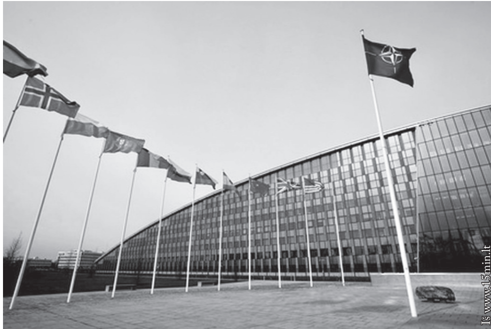
NATO būstinė Briuselyje

skambučiais į Maskvą, dabar jau kalba visiškai kitaip!