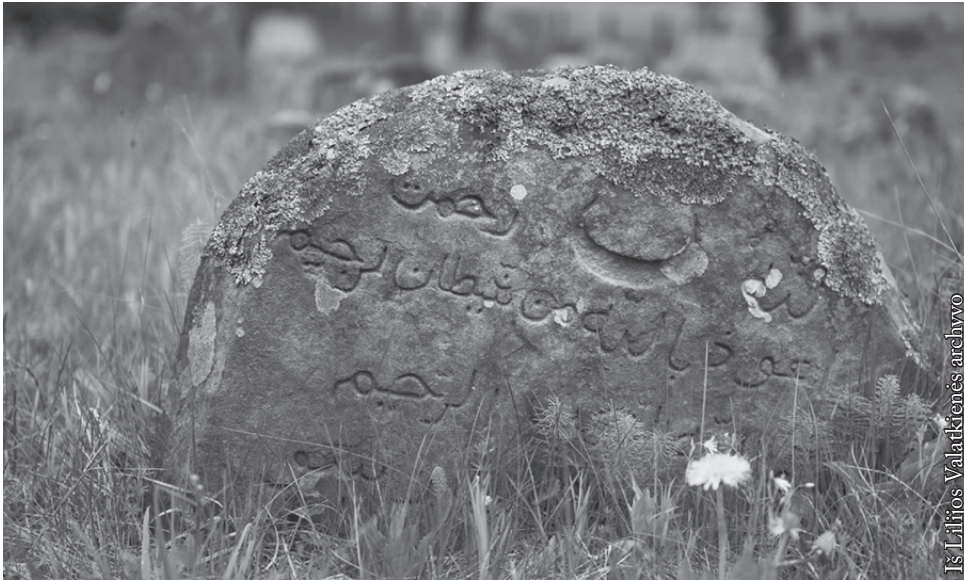
Seniausi antkapinių akmenų įrašai arabų kalba siekia XVII a.

kitų gyvenviečių Lietuvoje ir galiausiai pradėtas kepti ne tik totorių kilmės virtuvės meistrų.