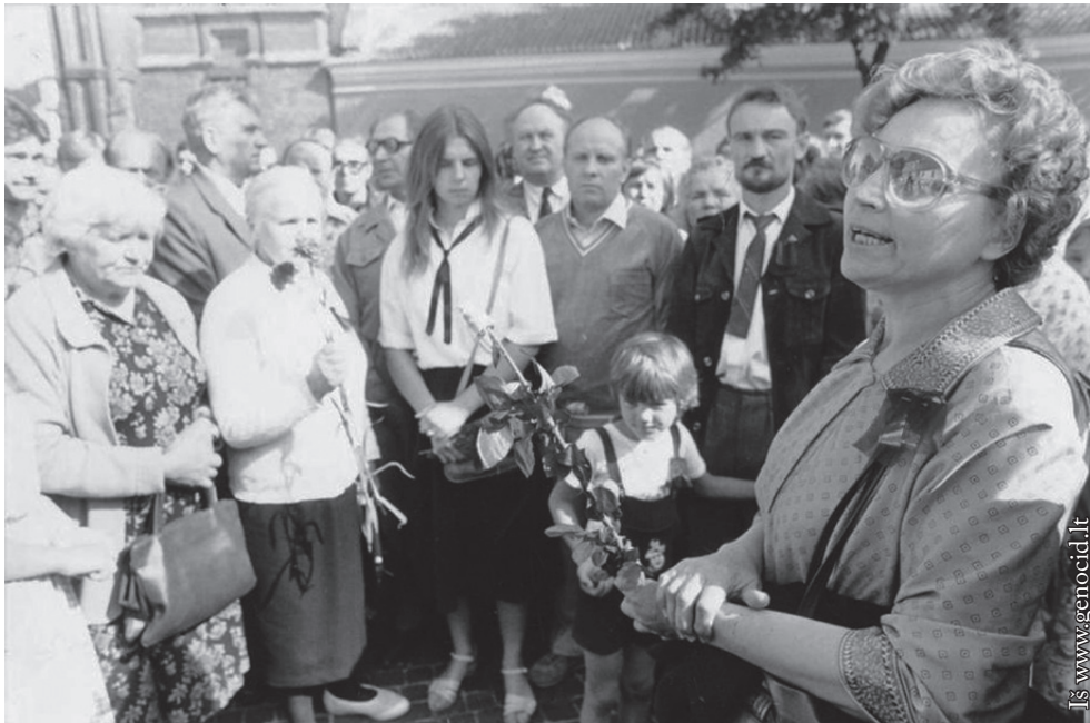
Mitingas Vilniuje prie A. Mickevičiaus paminklo Molotovo-Ribentropo pakto slaptiesiems protokolams pasmerkti. Vilnius, 1987 m. rugpjūčio 23 d.