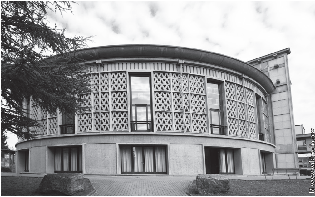
Fribūro universiteto aula