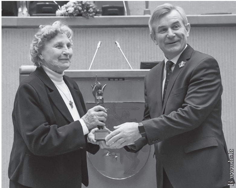
2017 m. Laisvės premijos laureatė Nijolė Sadūnaitė

neįpainio- tų nekaltų žmonių. Mintimis paprašiau Gerovo Dievo, kad padėtų man, ir staiga pri- siminiau tik ką kameroje įvykusį la- bai juokin- gą epizodą, ir kad pra- trūksiu nuo- širdžiausiu juoku. Pile-