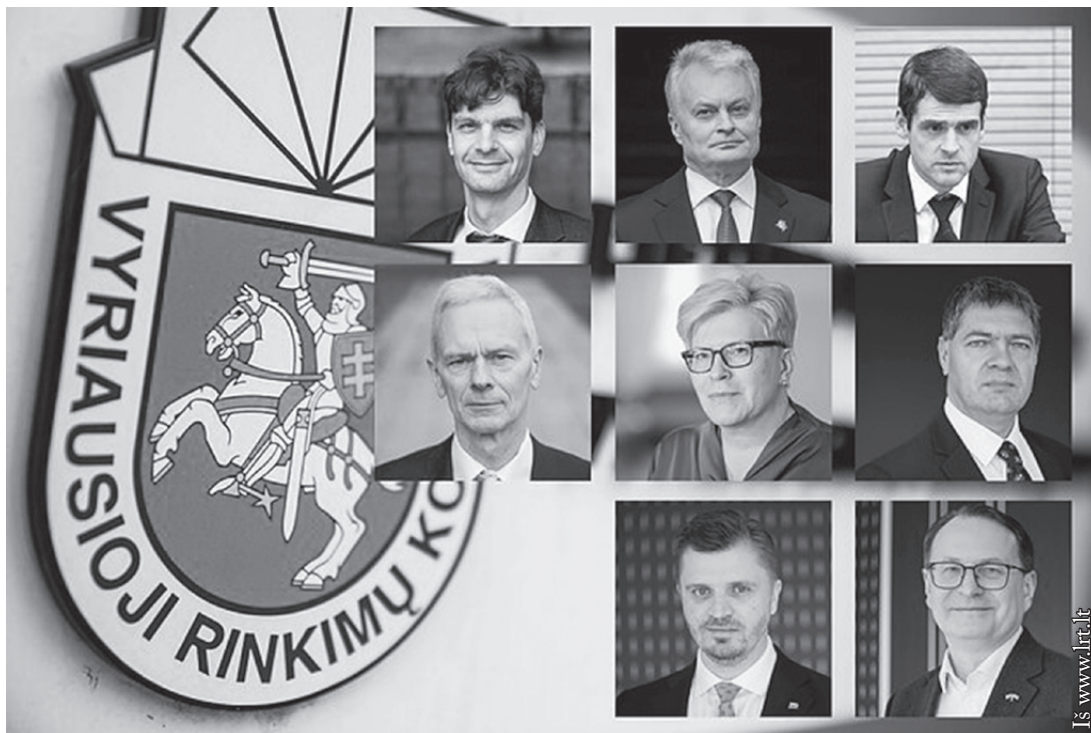
Kandidatai 2024 m. prezidento rinkimuose

iš Konstitucijos būtų išbrauktas teiginys: „Išskyrus įstatymo numatytus atskirus atvejus, niekas negali būti kartu Lietuvos Respublikos ir kitos valstybės pilietis.“ Tokiu pakeitimu esamiems Lietuvos Respublikos piliečiams būtų išsaugota Lietuvos pilietybė, jiems įgijus Lietuvai draugiškų valstybių pilietybę, – rašoma Lietuvos Respublikos vyriausybės pranešime (lrv.lt). Kas tos draugiškos valstybės? Kurių valstybių pilietybę įgyjantys Lietuvos piliečiai galėtų išsaugoti Lietuvos pilietybę? Referendumo iniciatoriai išvardijo, kad tai: Europos Sąjungos valstybės narės, Šiaurės Atlanto sutarties organizacijos (NATO) narės, Ekonominio bendradarbiavimo ir plėtros organizacijos (EBPO) valstybės narės ir Europos ekonominės erdvės susitarimo dalyvės. Taip pat pabrėžiama, kad nepriklausomai nuo narystės minėtose organizacijose, valstybių, kurios dalyvauja buvusios Sovietų Sąjungos pagrindu