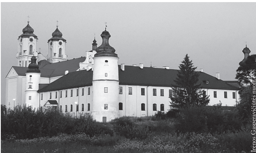
Seinų kunigų seminarijos rūmai