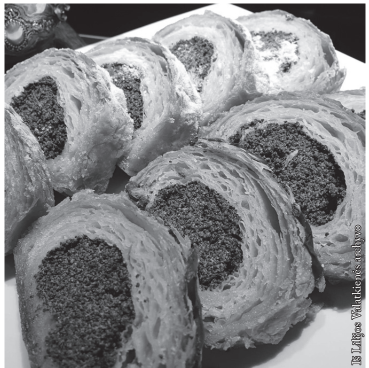
Šimtalapis – skaniausias totorių virtuvės pasididžiavimas