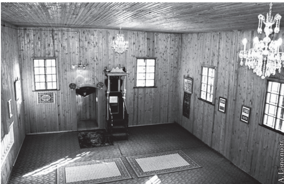
Mečetės vyrų salėje