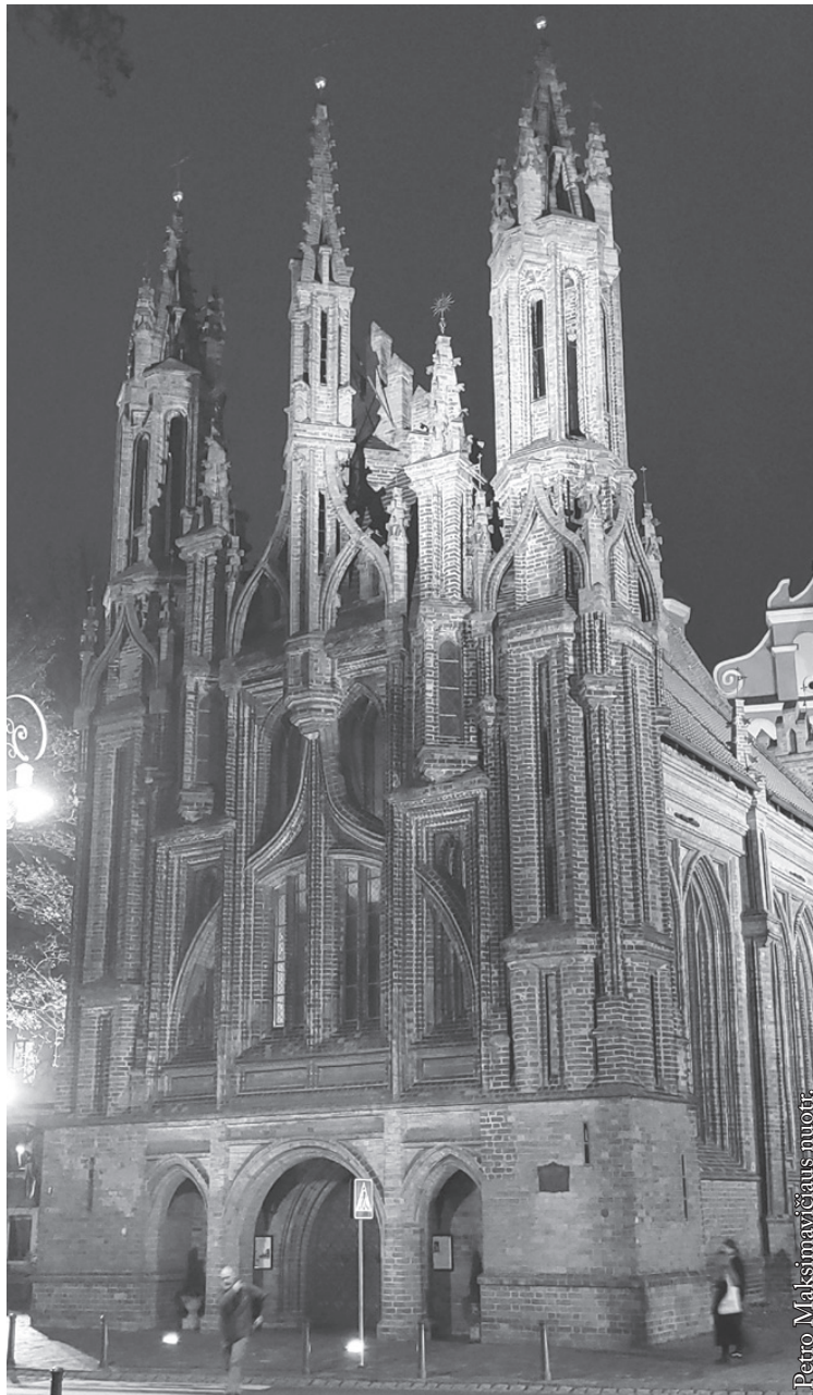
Šv. Onos bažnyčia Vilniuje

Grįžkime į Vilnių. Štai šiame mieste 2021 m. Švč. Mergelės Marijos Ramintojos bažnyčios pastato pirmame aukšte duris atvėrė socialinis restoranas „Pirmas blynas“. Tiesa, reikia pridurti, kad tai nėra grynai komercinis sumanymas. Restoranas įkurtas vykdant bendruomeninių socialinės integracijos veiklų programos projektą. Jį įgyvendina VšĮ Bendrystės ir socialinių inovacijų centras. Pasak šio centro atstovų,