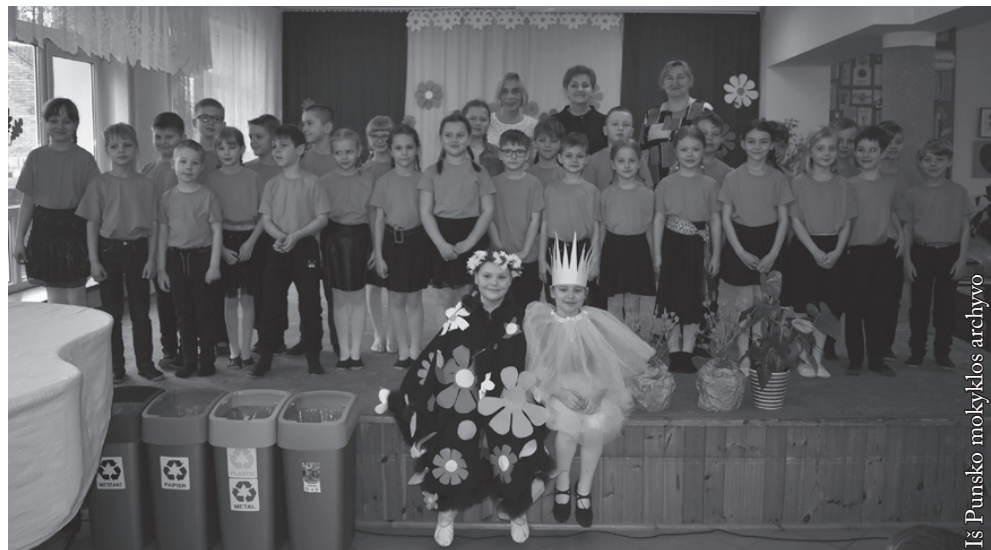
Iš Punsko mokyklos archyvo