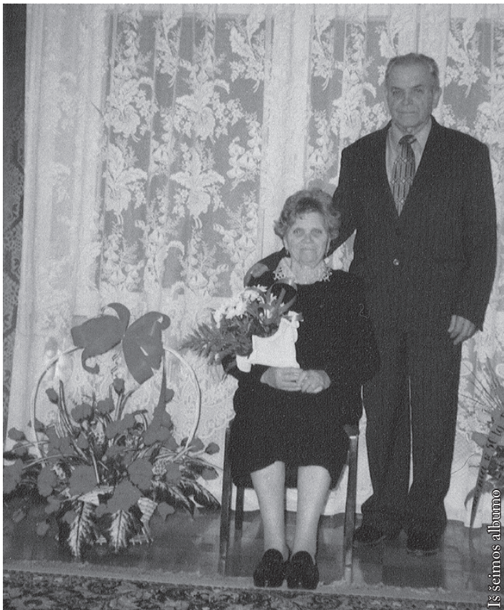
Onos ir Česiaus Agurkių 50-asis bendro gyvenimo jubiliejus

Česius jau prisijungė prieg brolių. Aš cik likau. Misnu, nēr ko skubycis, alia ką žinai, – kožno kelias ir rytdziena nežinomi. Nu alia laikycis raikia, dėl savį ir kitų...“