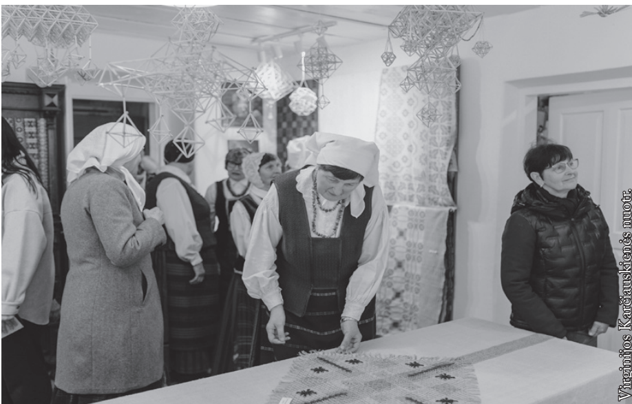
Parodos atidarymo svečiai