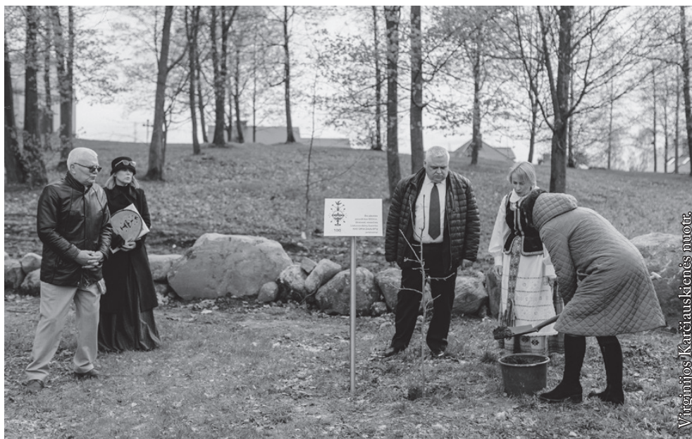
Šalia Punsko lietuvių kultūros namų sodinamas ažuoliukas