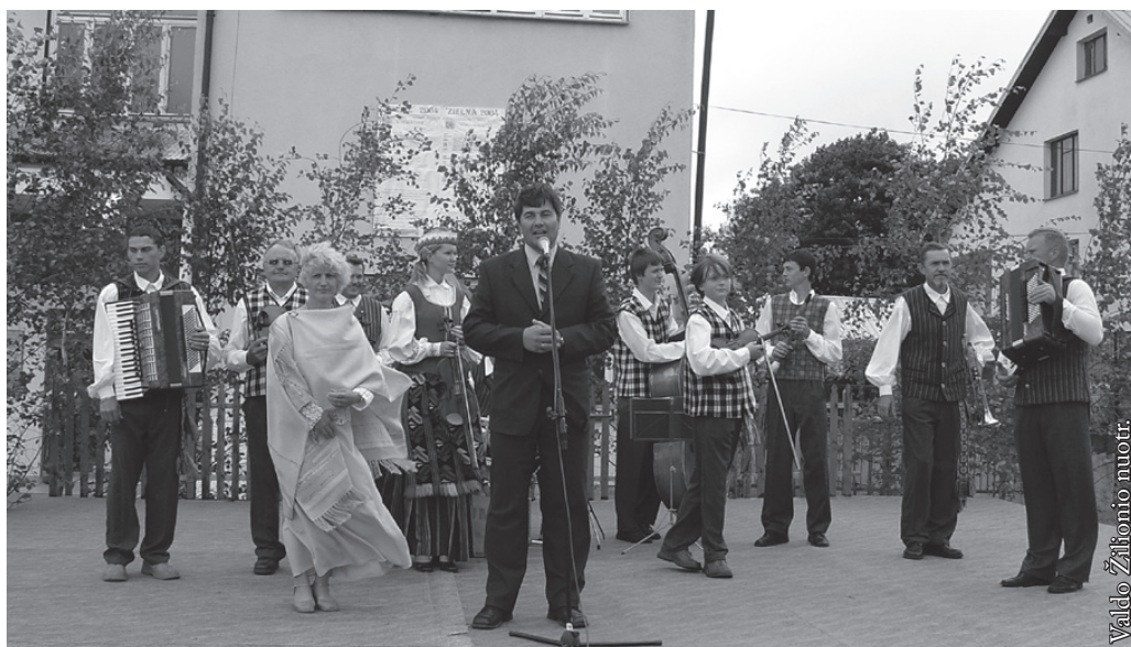
Punsco Žolinėse. 2004 m.