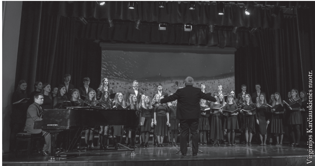
„Pašešupiai“ ir „Balsynėlis“