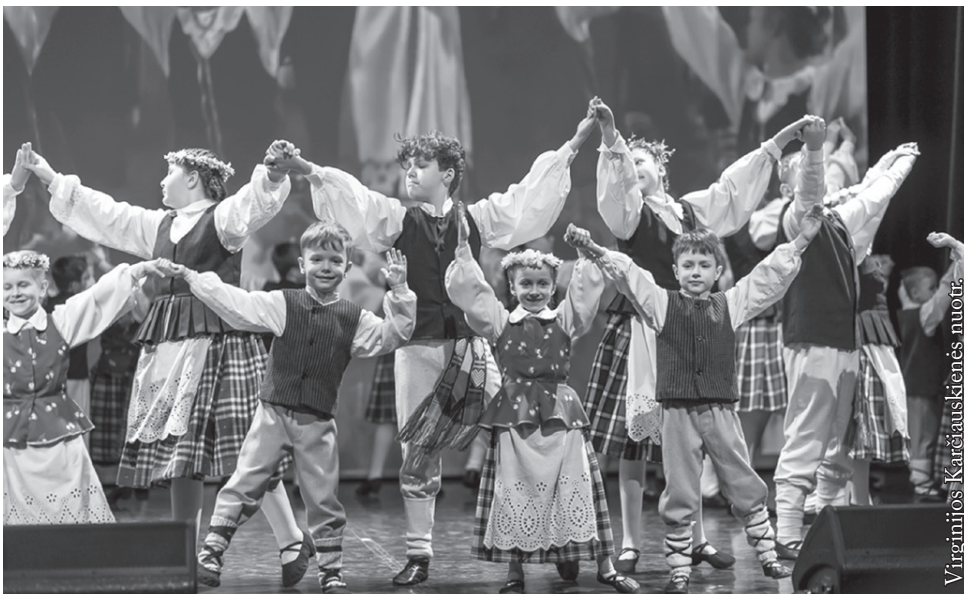
„Jotvos“ mažieji šokėjai

rūpinantis nesenstančiomis vertybėmis, pradedant nuo gyvenimo darnoje su gamta. „Jotvos“ koncerto įvade žiūrovus ištikęs dygstančio ąžuolo stebuklas galėjo reikšti ne tik pačios gamtos gimimą, bet ir tautos kaip smulkaus grūdelio formavimąsi pasaulio platybėje. 1924-ųjų Dainų šventė Lietuvoje, kurią atidarė Lietuvos valstybės ir visuomenės veikėjas, Vasario 16-osios Akto signataras bei antrasis šalies prezidentas Aleksandras Stulginskis, prasidėjo „Tautiška giesmė“, romantiškai pakylėjusia dainingą tautą. Per šimtmetį Lietuva keitėsi. Ji buvo grobiama, plėšoma, tremiama – verčiama su šaknimis, tačiau – kaip Justinas Marcinkevičius eilėse rašė: „Kiek rovė – neišrovė./ Kiek skynė – nenuskynė.“ Per šimtą metų augantis medis stipriai suauga su jį maitinančia žeme, visai kaip ir žmogus – per tiek pat laiko dvasinis ryšys su Tėvyne išsiskaido kartose. Jeigu ir viskas aplinkui keičiasi, jeigu