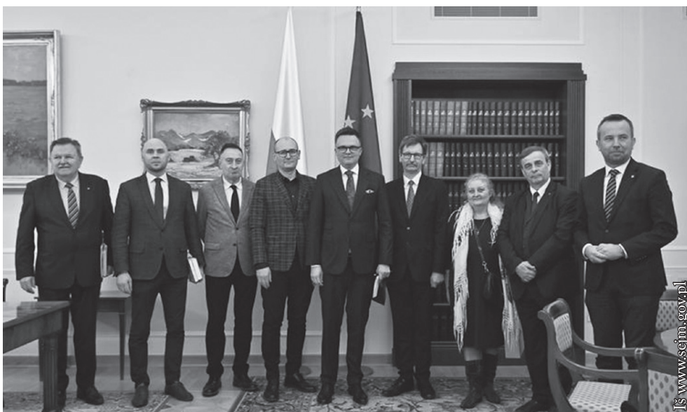
Lenkijos Seimo Pirmininko Šimono Holovnicos (Szymon Hołownia) susitikimas su Bendrosios vyriausybės ir tautinių bei etninių mažumų komisijos nariais