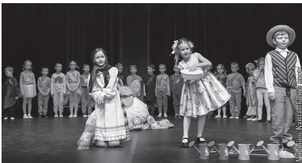
Punsko savivaldybės vaikų darželio „Boružėlė“