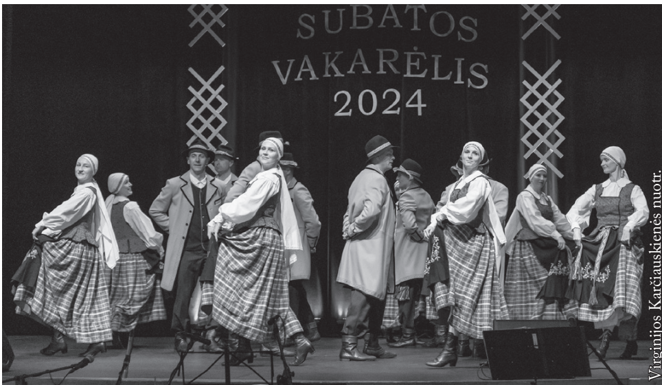
Punsko lietuvių kultūros namų vyresniųjų liaudiškų šokių grupė „Vyčiai“

tautiniams kostiumams. Dar vienas sėkmingai įgyvendintas projektas – respublikinis vyresniųjų liaudiškų šokių kolektyvų festivalis „Ringio ringiai“, gyvuojantis jau 13 metų. Visą šį laikotarpį kolektyvas aktyviai dalyvavo savo miestelio, Prienų rajono bei kitų Lietuvos miestų ir miestelių šventėse, regioniniuose, respublikiniuose, tarptautiniuose festivaliuose. Didelė sėkmė lydėjo respublikiniuose konkursuose „Pora už poros“, „Iš aplinkui“. Po kiekvieno laimėjimo ringiečiai tiesiog pranašiskai pajuokaudavo, esą iškovota prizinė vieta – tai tarsi dar viena plunksna į „Aukso paukštę“. Visa tai – atkaklaus ir nenuilstamo vadovo bei kolektyvo triūso ir tvirto tikėjimo savo galimybėmis rezultatas. 2010 m. „Ringis“ pelnė nominaciją „Geriausia liaudiškų šokių grupė ir vadovas“, apdovanotas statulėle „Aukso paukštė“. Kolektyvas dalyvauja