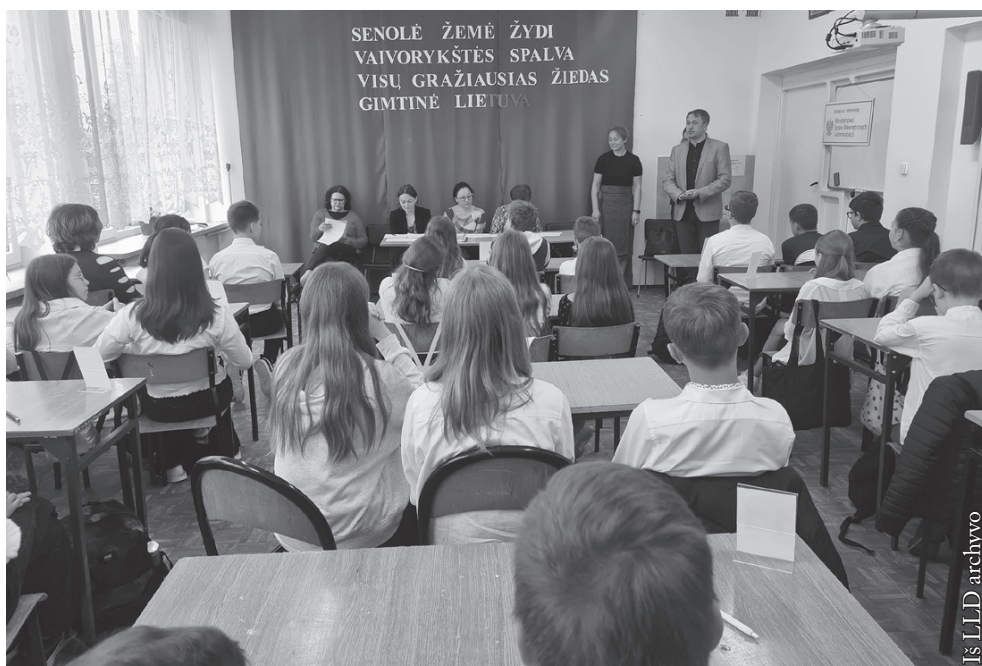
IV–VI klasių lietuvių kalbos ir literatūros konkursas-viktorina

Ministerstwo Spraw Wewnętrznych i Administracji