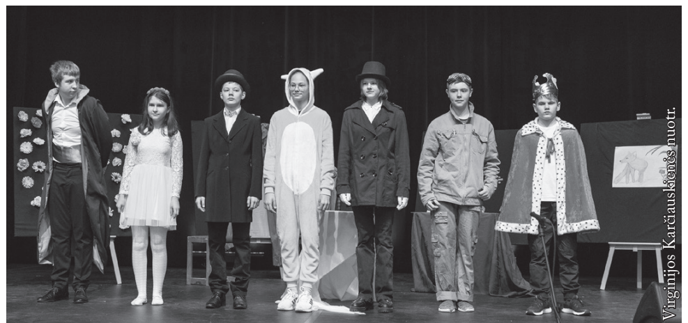
Vidugirių pagrindinės mokyklos mokiniai

Ministerstwo Spraw Wewnętrznych i Administracji