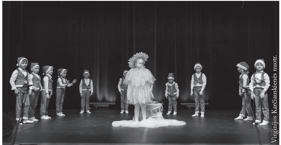
Seinų lietuvių „Žiburio“ darželio „Žiburiukai“

Pirmieji scenoje spektaklį „Kaip nykštukai saulutę žadino“ parodė Seinų lietuvių „Žiburio“ darželio „Žiburiukai“, rež. Alicija Maksimavičienė