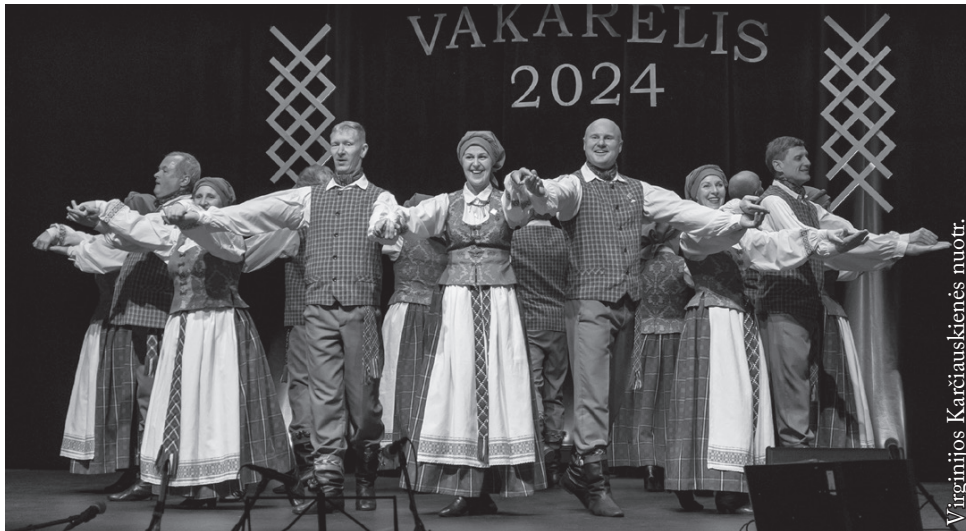
Pakruojo kultūros centro šokių kolektyvas „Reketys“

tęs net porą kartų. Sėkmingiausi ir produktyviausi buvo 2001 metai – puikus pasirodymas „Klumpakojų“ konkurse (II vieta) ir respublikinio šokių konkurso „Pora už poros“ laureato vardas. 2002 m. Šiaulių apskrities tautinių šokių konkurse „Suk, suk ratelį“ laimėta I vieta ir pereinamasis prizas. Kolektyvui sėkmingi buvo 2003-ieji. Konkurse „Iš aplinkui“ Širvintose laimėtas laureato vardas bei II vieta šokių konkurse „Klumpakojis-2003“ Klaipėdoje. 2004 m. kolektyvas vainikuotas aukščiausiu įvertinimu už choreografiją – „Reketys“ apdovanotas „Aukso paukšte“.