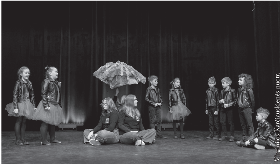
Seinų lietuvių „Žiburio“ mokyklos „Šakar makar“