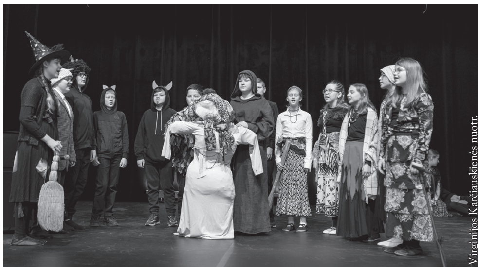
Punsko Dariaus ir Girėno pagrindinės mokyklos „Padūkėliai“

Užgavėnės – tai žiemos išlydėjimo šventė ir laikotarpis prieš gavėnią bei pasninką. Tą dieną svarbus persirengėlių vaidmuo. Todėl spektaklyje matėme raganas, čigones, Kanapinį, Lašininį, velnius, giltines ir kitus personažus. „Mūsų tikslas – atskleisti Užgavėnių tradicijas, išvaryti visus žiemos demonus ir švęsti pavasario pradžią. Iš tikrųjų tai linksma, džiugi šventė, kurią kadaise švęsavo mūsų