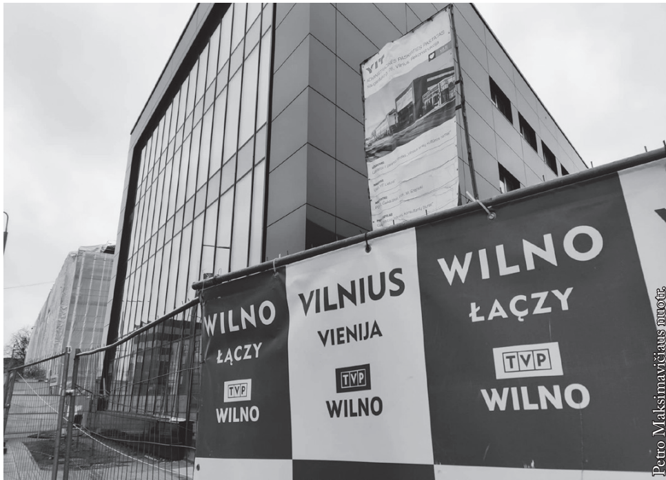
TVP Wilno būstinė Vilniuje

Rašyti šia tema paskatino įtakingame Lenkijos dienraštyje išspausdintas straipsnis „Lietuva, kieno tu tėvynė?“. Autorius perspėja Lietuvos lenkus, kad nedarytų tos pačios klaidos, kurią padarė lemtingais Lietuvai 1990 metais, kada bandė kurti autonomiją Vilniaus krašte, palaikė Rusijos pučistus, o kai kurie tuometinės Lietuvos Aukščiausiosios Tarybos nariai susilaikė balsuojant už Lietuvos nepriklausomybės atkūrimą. Žurnalistas pažymi, kad šiuose rinkimuose Šalčininkai, kur absoliuti dauguma gyventojų lenkai, balsavo identiškai kaip Visagine gyvenantys rusų tautybės Lietuvos piliečiai. Tai, pasak jo, blogas ženklas, kadangi lietuviai tokius pasirinkimus ilgai atsimena. Taip buvo po 1990 metų, ir toks įvaizdis toliau įtvirtinamas. Apie tai liudija ir pirmieji Lietuvos politikų komentarai, kuriuose pabrėžiama, kad rinkimai parodė, kieno viltingas žvilgsnis šalyje nukreiptas į Europą, o kieno į Rytus.