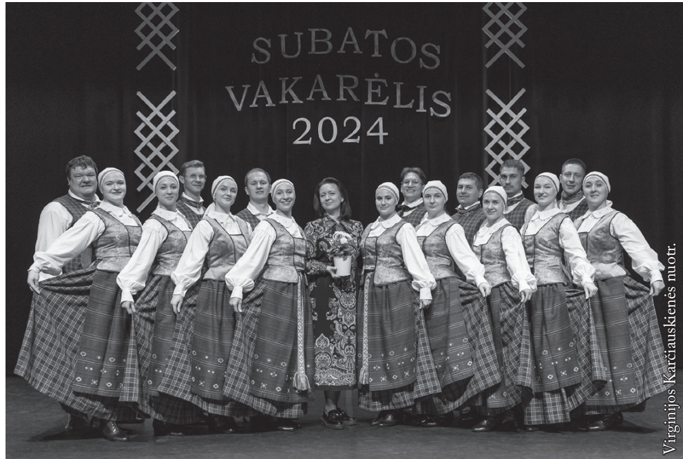
Seinų „Lietuvių namų“ vyresniųjų liaudiškų šokių grupė „Seina“

2001 m. Balbieriškio kultūros ir laisvalaikio centre susibūrė nedidelė – keturių porų, vyresniųjų liaudiškų šokių grupė „Ringis“, pasivadinsi tekančio per miestelį upeliuko vardu. Palaiapsniui kolektyvo narių skaičius augo. Šokėjai vis dažniau aptarinėjo idėją kurti bendruomenę, ieškoti paramos kultūrinei veiklai ir ją plėtoti. 2003 m. miestelyje buvo įkurta kaimo bendruomenė „Balbieriškis“, į kurią po trejų metų perėjo šokių kolektyvas, o netrukus ringiečiai