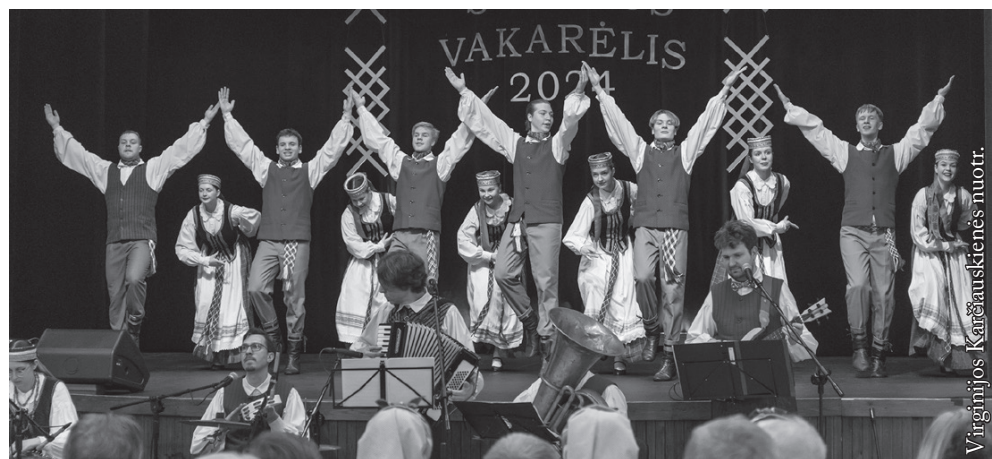
Vilniaus universiteto liaudiškos muzikos ansamblis „Jaunimėlis“

Šventės programoje dalyvavo ir šeiminkai – Seinų „Lietuvių namų“ vyresniųjų liaudiškų šokių grupė „Seina“, savo kūrybinę veiklą pradėjusi 2016 m. Kolektyvo meno vadovė subūrė šokėjų grupę, kuri vėliau pasivadino Seinų mieste tekančios upės vardu. Kiekvienas „Seinos“ šokėjas jaučiasi atsakingas, prisidedamas prie lietuvių liaudies šokio ir muzikos meno išsaugojimo. Grupę sudaro 22 įvairaus amžiaus ir įvairių profesijų žmonės.