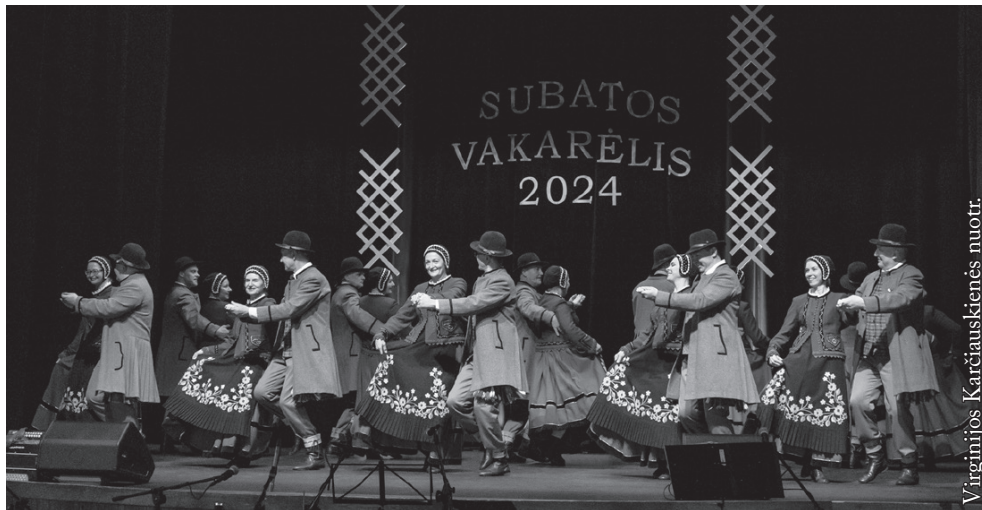
Balbieriškio kultūros ir laisvalaikio centro vyresniųjų liaudiškų šokių grupė „Ringis“