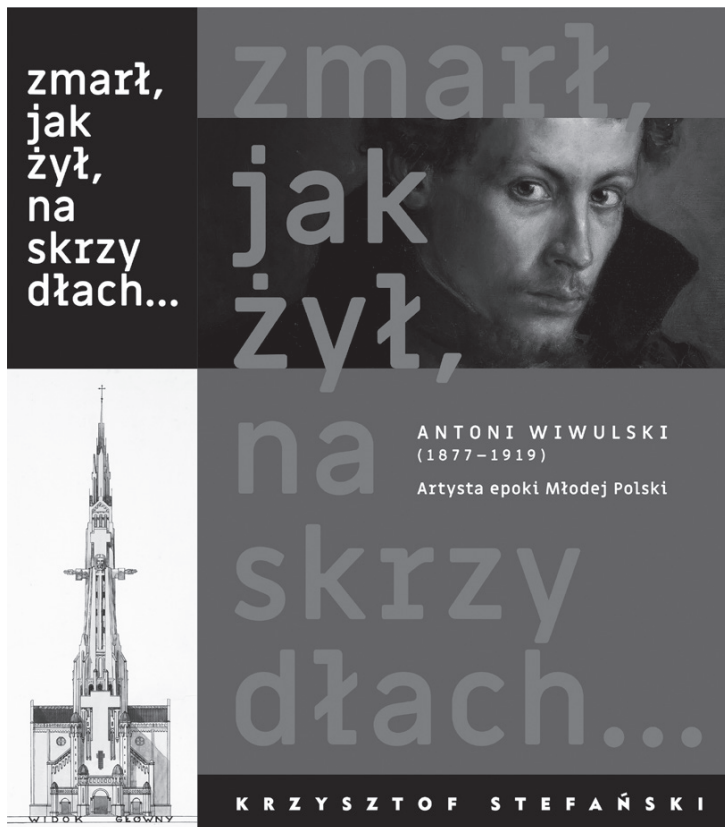
Knygos viršelio ir grafinio dizaino autorius – prof. Krzysztof Rumowski

Nors knygos autorius remiasi sukaupta tyrimo medžiaga, skaitančiojo vaizduotė ir smalsumas gali siekti daug toliau. Netgi tuomet, kai jis esąs dalyko žinovas, tai yra meno