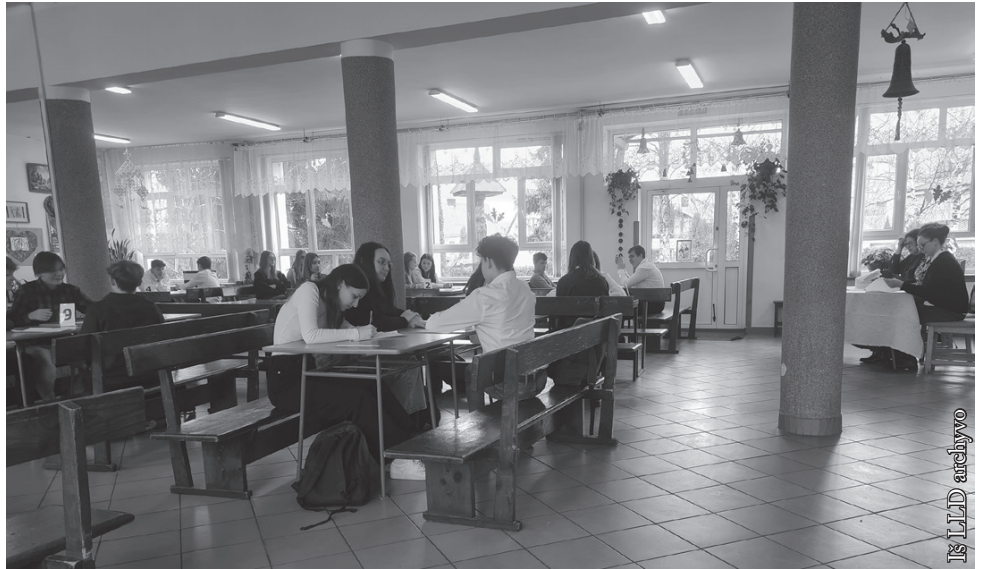
VII–VIII klasių lietuvių kalbos ir literatūros konkursas-viktorina