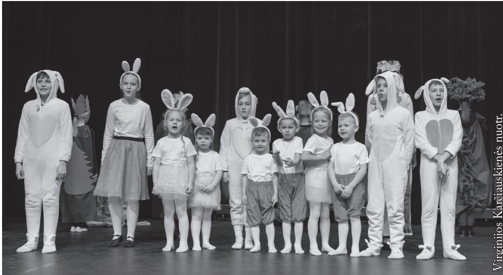
Seinų lietuvių „Žiburio“ mokyklos „Tabalai“