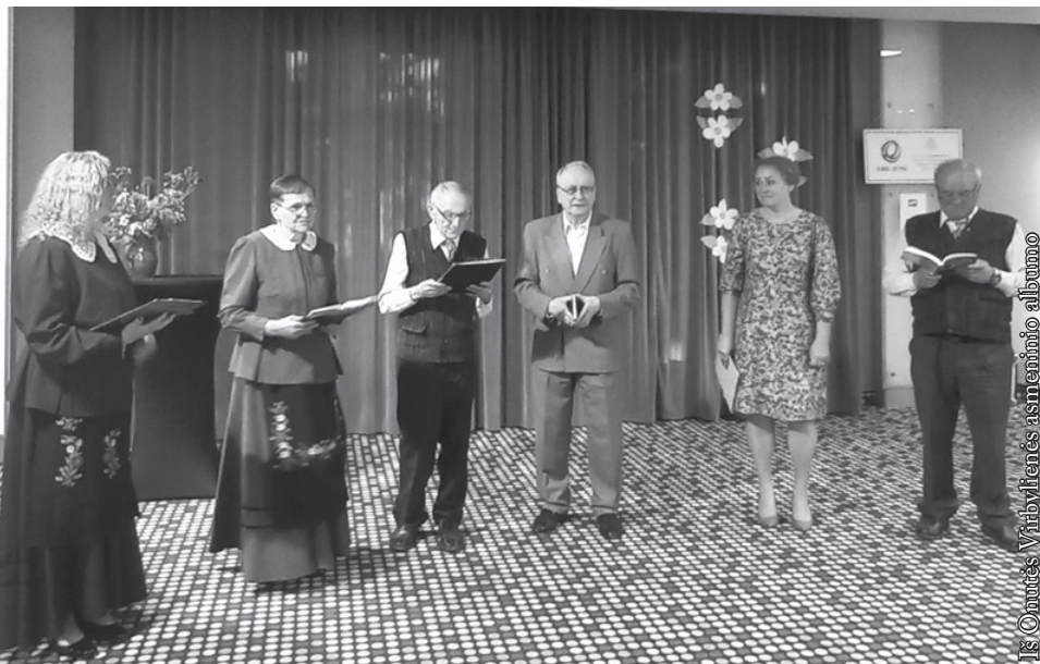
Suvalkų dailiojo žodžio mėgėjai