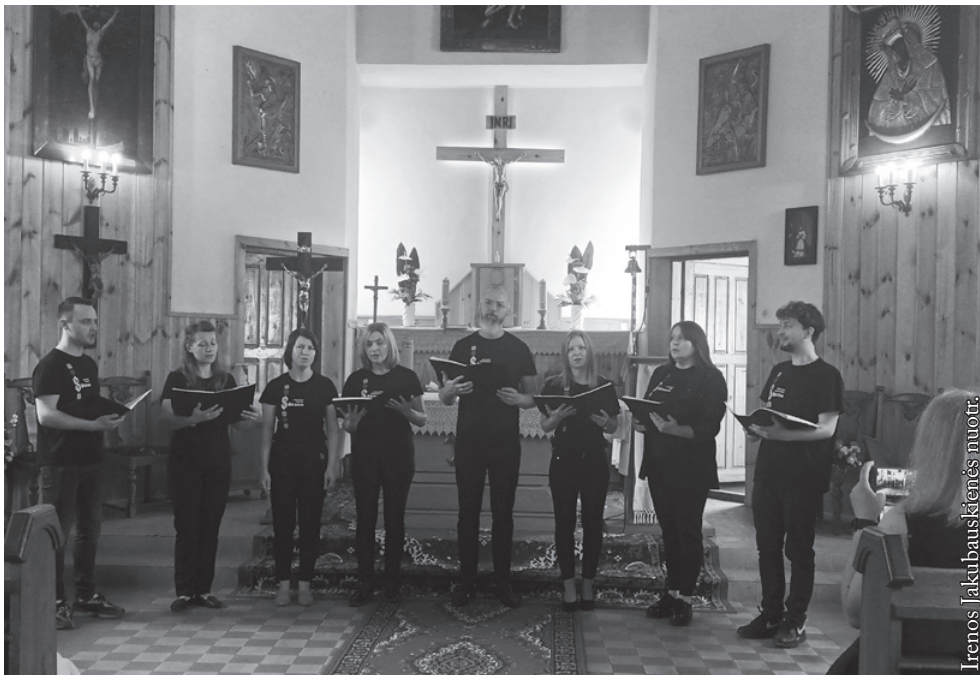
Suvalkų lietuvių ansamblis „Sūduva“

Organizatoriai dėkoja šventės rėmėjams: Lenkijos vidaus reikalų ir administracijos ministerijai, Lietuvos užsienio reikalų ministerijos Globalios Lietuvos departamentui ir Palenkės vaivadijos maršalkos įstaigai.