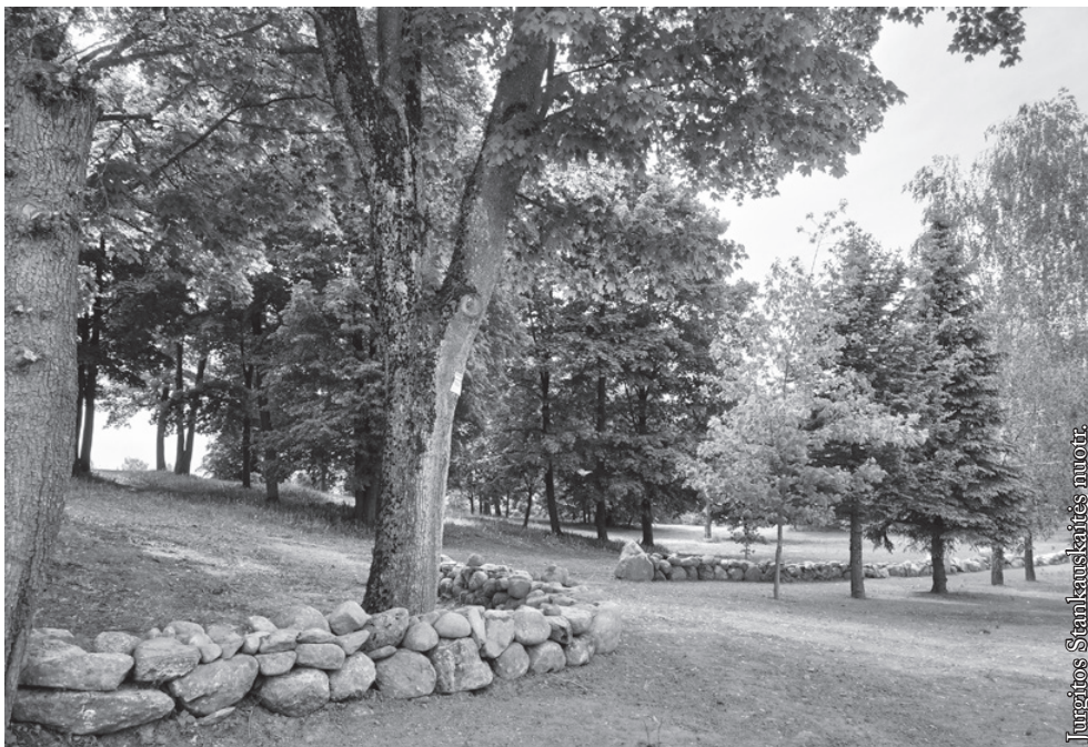
Senųjų kapinių mūras