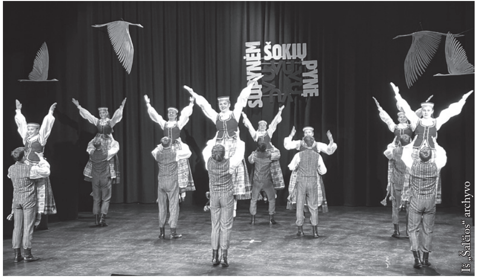
„Šalčia“ II Sūduvos krašto vaikų ir jaunimo liaudiškų šokių festivalyje „Supynėm šokių pynė“

Labai džiaugiamės, kad esame kviečiami į šokių konkursus Lietuvos, kad apie mus nepamiršta. O kad sugebame parodyti atitinkamą šokimo lygį – rodo mūsų įvertinimai. Komisijos nariai negailėjo padėkos žodžių „Šalčios“ šokėjams, gyrė ne tik už tvarkingą aprangą, estetišką išvaizdą, bet ir už mūsų vaikų šilumą ir nuotaiką šokant, dėmesį savo šokėjui. Labai džiaugiuosi ir aš, kad jaunimas mielai susirenka į repeticijas, kad noriai dirba, o juk kiekvienas žino, jog mokslo ir darbo vaisiai – saldūs. Ačiū, mielas ir šaunus mano jaunimėli, už meilę lietuviškam šokiui.