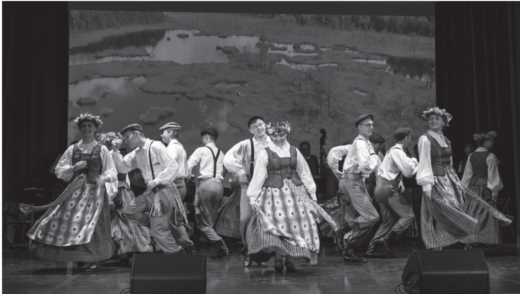
Jaunieji „Vyčių“ šokėjai