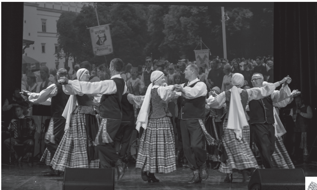
Vyresnieji „Vyčių“ šokėjai

Besibaigiant koncertui pasi- džiaugėme dar viena gera žinia: į artėjančią Dainų šventę „Kad giria žaliuotų“ ruošiasi vykti tur- būt rekordinis dalyvių iš Punsko skaičius: Ansamblių vakare šoks „Jotvą“, gros „Klumpė“, Folkloro dieną dainuos „Gimtinė“, „Alna“ ir „Šalcinukas“, Teatro dieną vai- dins Punsko klotimo teatras, Šo- kių dieną šoks „Vyčiai“ ir „Šalčia“, Dainų dieną dainuos „Pašėšu- piai“, „Balsynėlis“ ir „Dzūkija“. Iš viso Dainų šventėje mirguliuos apie 37000 dalyvių.