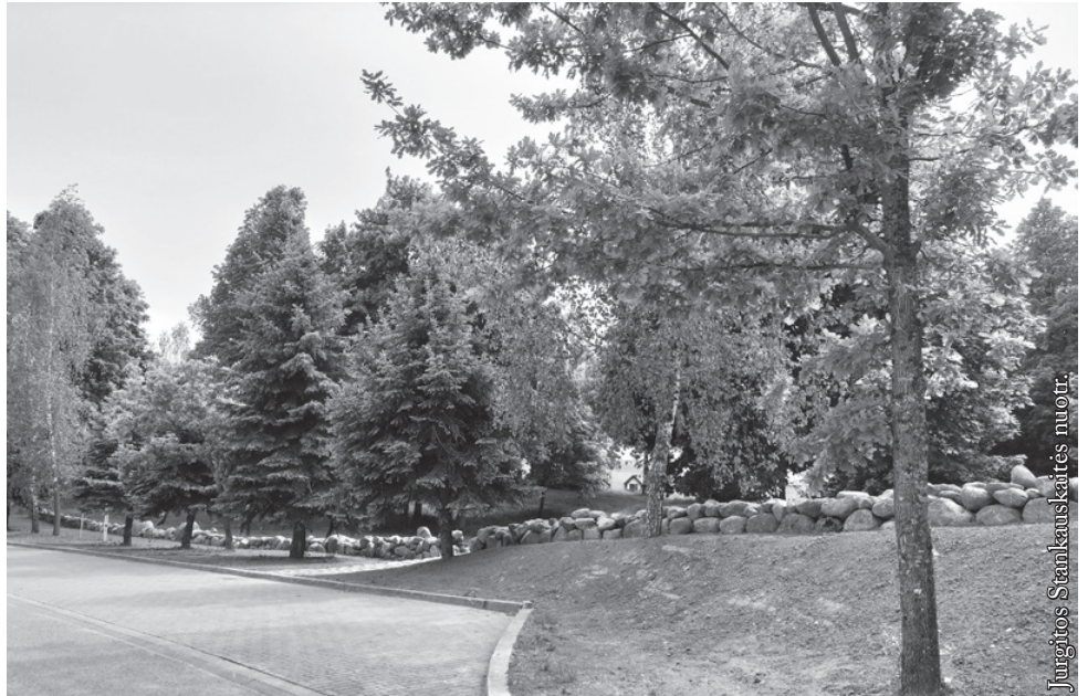
Punsko senosios kapinės

Visai neseniai, pavasarėjant, senosiose kapinėse Punske – tuoj už Lietuvių kultūros namų (LKN) garažų – stovėjo sena akmenų krūva. Sena, nes akmenys buvo apmauroję, nukloti purvo, dulkių ir lapų sluoksniu. Niekas nesidomėjo, kam jie ten sukrauti nei kas juos kada sumetė į vieną vietą. Taip pat nelabai kam rūpėjo kapinių pašonėje stūksantys akmenys. Akmuo kaip akmuo. Visur jų pilna. Be to – čia kapinės, tad galbūt tokie mena praeitį, saugo XIX amžiaus amžinojo poilsio vietą. Taip sau stovėjo akmenys niekieno neliečiami. O kapinės tvarkomos, prižiūrimos, leidžiant lankytojams lengviau ir maloniau nueiti iki koplytėlės, aplankyti senų kapų paminklus, nufotografuoti aukštą