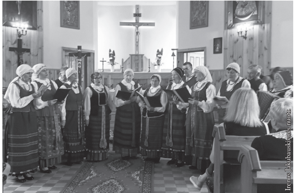
Lenkijos lietuvių etninės kultūros draugijos ansamblis „Gimtinė“