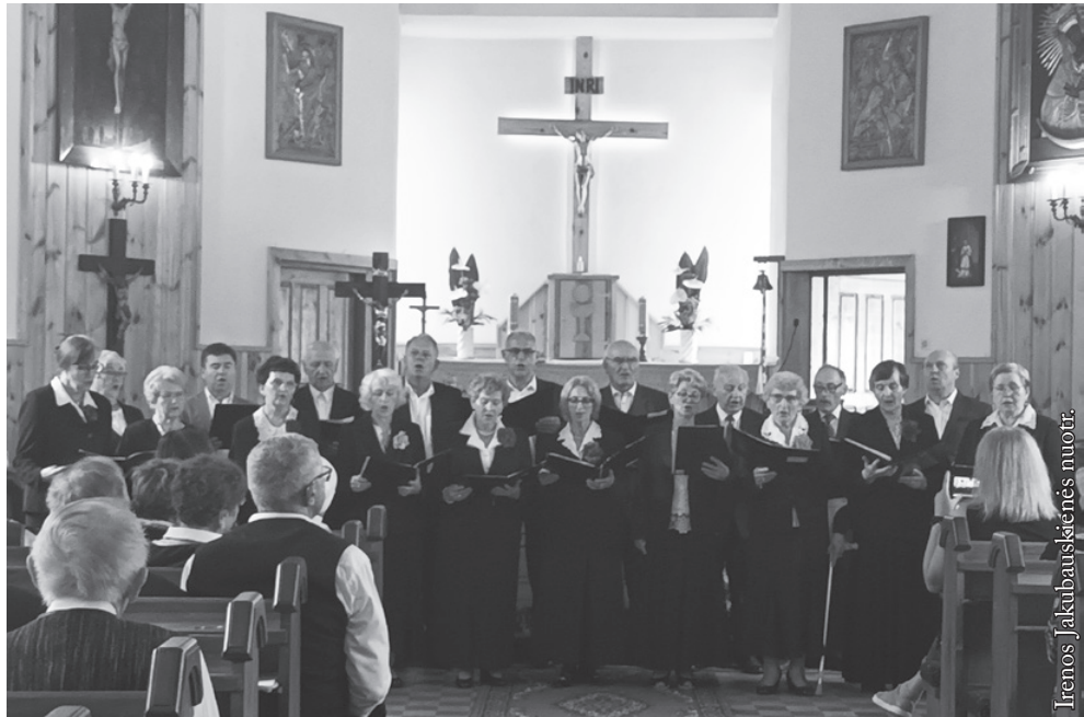
Seinų „Lietuvių namų“ kolektyvas „Galadusys“

Nedidelėje Žagarių bažnytelėje susirinko gausus būrys žmonių.