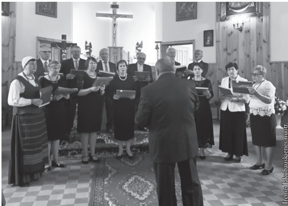
Punsko bažnytinis choras