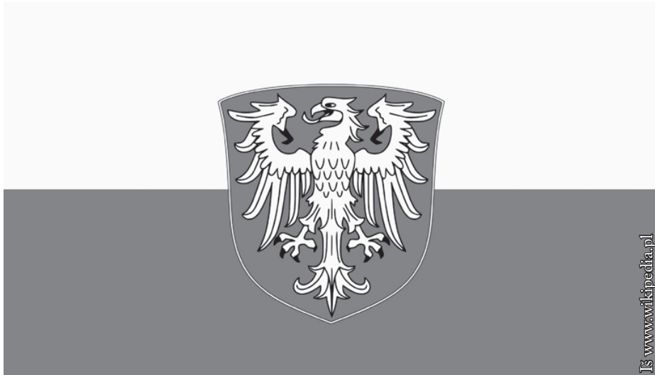
Aukštutinės Silezijos vėliava ir herbas

vengė kalbėti apie Sileziją, jos praeitį, sileziečių tapatybę. Taip elgdamasi ji nuskurdino save, nes šiuolaikinių demokratijų stiprybė ir turtingumas slypi jų įvairovėje. Tačiau, kaip aiškiai rodo gyventojų surašymo rezultatai, ji nuo to nepabėgs. Ilgalaikėje perspektyvoje negalima ignoruoti 600 000 piliečių balso. Netrukus vėl bus rengiamos pirmojo (1919 m.) ir antrojo (1920 m.) vadinamųjų Silezijos sukilimų minėjimo iškilmės. Daugiau nei prieš 100 metų didžioji Silezijos gyventojų dalis nusprendė kovoti, kad Silezija būtų Lenkijos dalimi, nors ir nekalbėjo ta pačia kalba kaip dauguma lenkų. Taigi šiais laikais, kai realiai nebeliko Europos Sąjungoje valstybių sienų, vargu ar gali kam nors į galvą ateiti mintis siekti kokios nors autonomijos ar atskiro šio regiono statuso valstybėje.