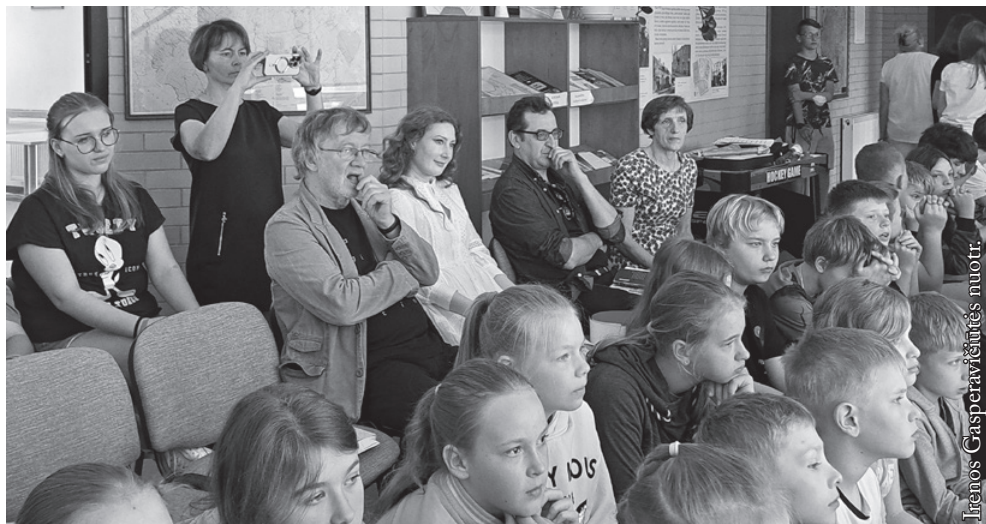
Poezijos pavasario akimirka Seinų lietuvių „Žiburio“ mokykloje

Gegužės 20-osios vakarą svečiai buvo sutikti Varšuvos universiteto Polonistikos fakultete, kur suorganizuotas renginys „Poezija po kaštonais“. Susitikimo su dėstytojais, absolventais ir studentais metu poetai atsakinėjo į klausimus ir skaitė savo eilėraščius, o dėstytojai, studentai ir absolventai – jų vertimus į lenkų kalbą.