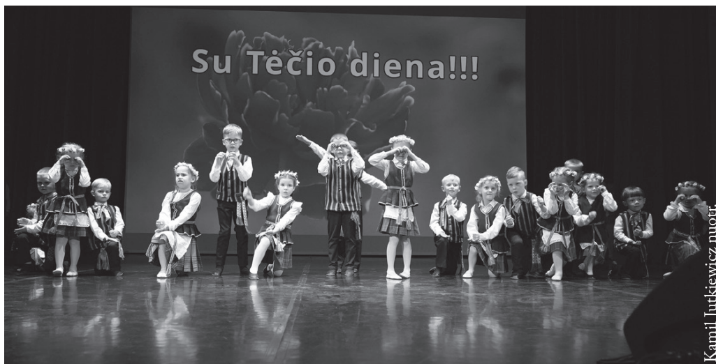
Mažylių šokis „Naujienos“

Antroji pagal amžių grupė – vyresnieji darželinukai ir I–II klasių mokiniai – jaunučiai. Labai džiaugiuosi, kad šitie vaikai buvo nepaprastai drausmingi, netekdavo net balso pakelti. Jie tokie dar paklusnūs, žiūri didelėm akim ir stengiasi kuo tiksliau viską atkartoti. Daugeliu atvejų net stengdavosi mane pavaduoti ir drausminti garsiau kalbančius ar paišdykauti bandžiusius vaikus. Su šiais šokėjėliais mes pastatėme du šokius: „Gintariniai riešutai“ ir „Mykoliukas ir Barbora“.