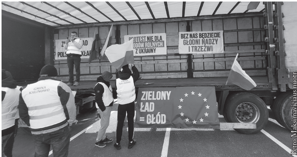
Ūkininkų protestas Budziske

kurie spontaniškai ir veiksmingai ištiesė pagalbos ranką. Tą patį matėme ir Lietuvoje, kuri taip pat priėmė nemažą karo pabėgėlių skaičių ir teikė kitokią pagalbą Ukrainai.