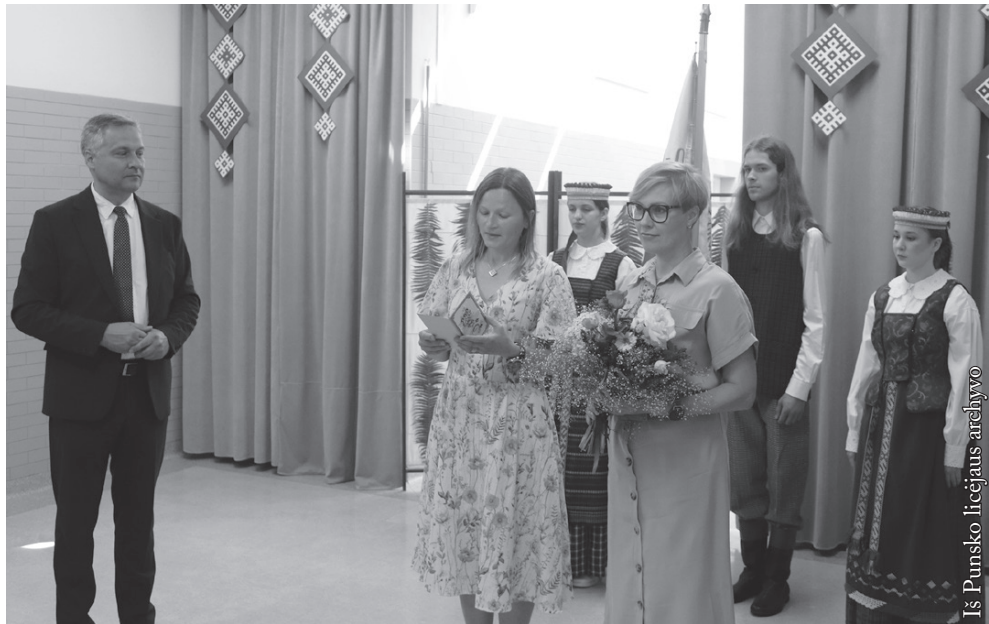
Mokslo metų pabaigos proga sveikina Tėvų tarybos atstovės