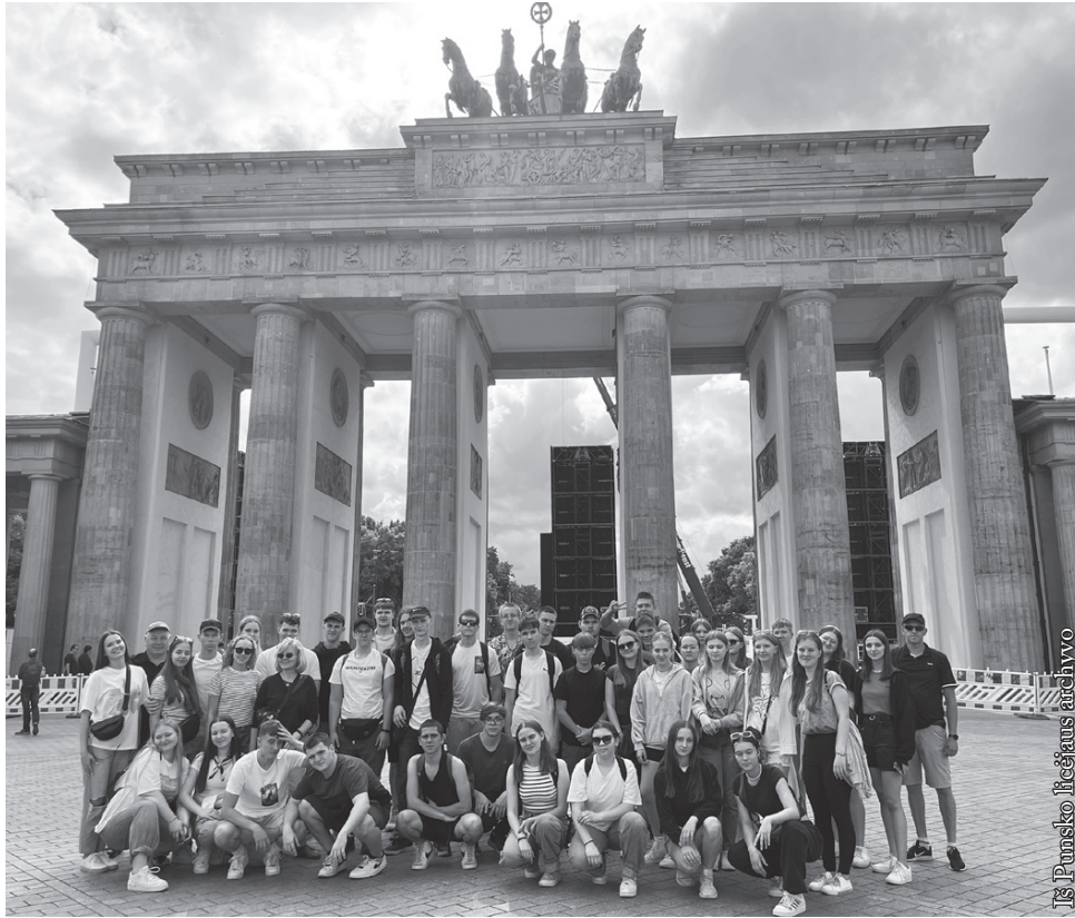
Punksko licejaus mokiniai Berlyne