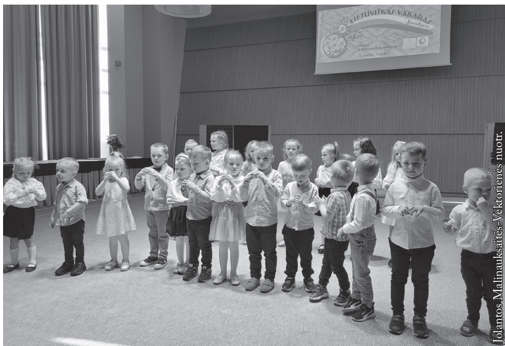
Suvalkų lietuvių vaikų darželio ugdytiniai