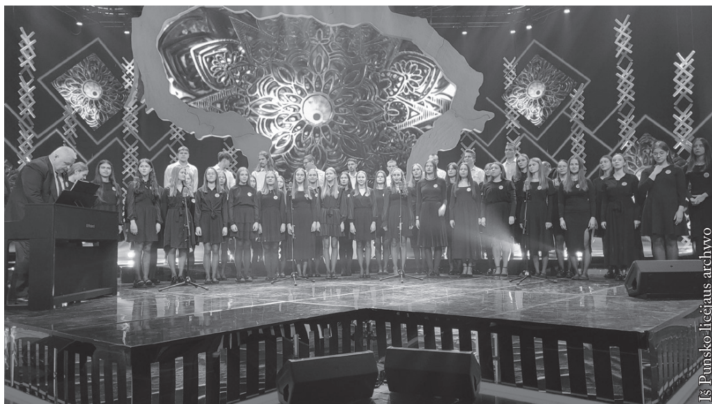
Punsko licėjaus choras „Pašešupiai“ „Duokim garo!“ laidoje