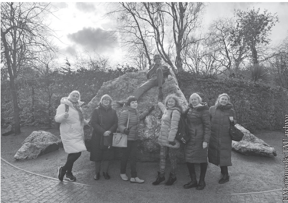
Projekto dalyvės aplankė garsaus rašytojo Oskaro Vaildo namą-muziejų ir paminklą

Įgytos patirtys praturtino kiekvieną projekto dalyvį. Savo tolesniame darbe jie stengsis panaudoti naujai įgytas žinias, tobulindami Marijampolės TAU veiklą.