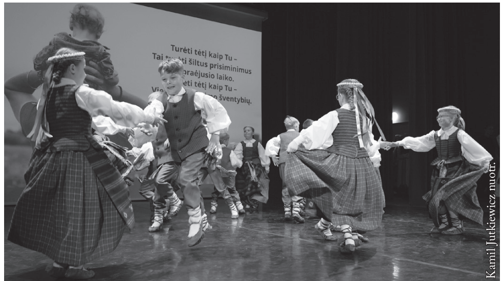
Jaunučių šokis „Pupos“

Mūsų koncertas – tai „Dainorėlio“ konkurso sudedamoji dalis. Kai vertinimo komisijos nariai skuba aptarti dalyvių pasirodymus, mes žiūrovus pakviečiame į šokėjų ir kapelos koncertą. Tą sekmadienį stengiamės išsakyti tėveliams gražiausius linkėjimus, švelniausius žodžius, pradžiuginti juos šokiais ir skambiomis melodijomis. Manychiau, kad tiek tėčiui, tiek mamai labai smagu matyti scenoje savo vaiką, vilkinti tautinį kostiumą, dainuojant, šokant, vaidinant. Mūsų siekiamybė ir yra ugdyti vaikučius nuo mažens kultūrinėje aplinkoje, skiepyti jiems meilę lietuvių kalbai, kultūrai, kad šios vertybės būtų puoselėjamos ir perduodamos iš kartos į kartą, kad