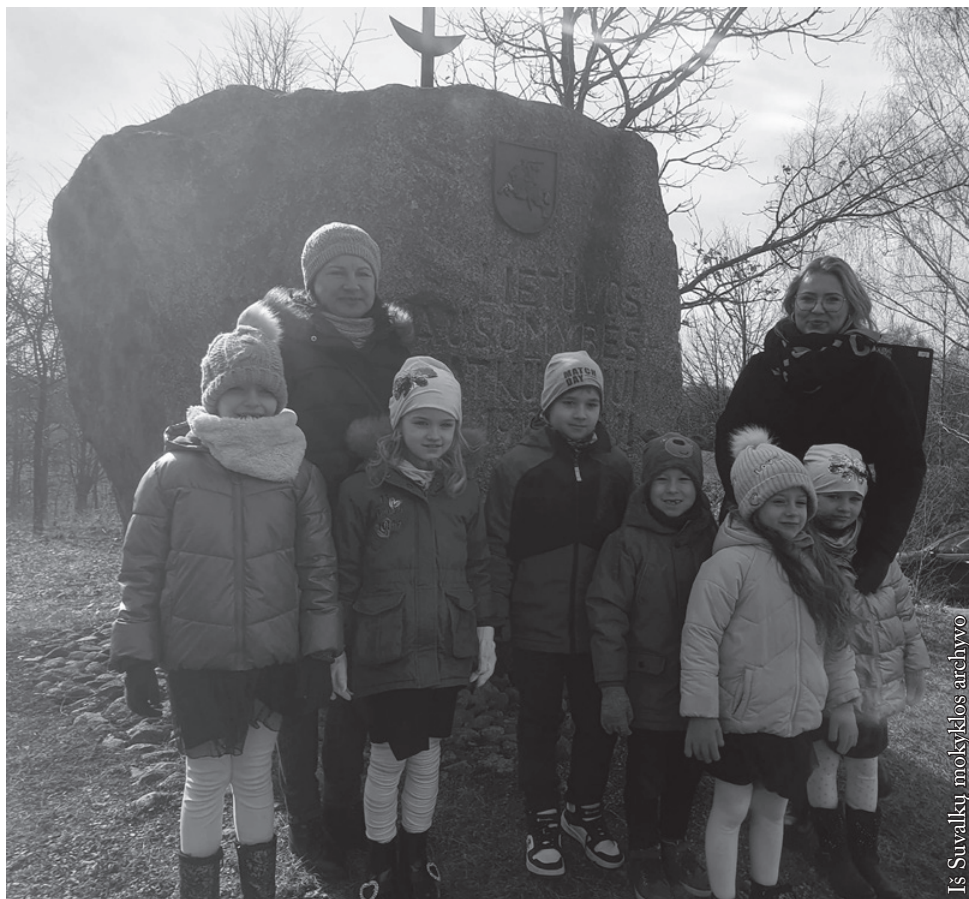
Iš Suvalkų mokyklos archyvo

Labai svajojome naujuosius mokslo metus pradėti naujam, išbaigtam ir iki galo mokyklai ir darželiui pritaikytam pastate. Deja, dėl užsitęsusių pastato remonto darbų ir negautų