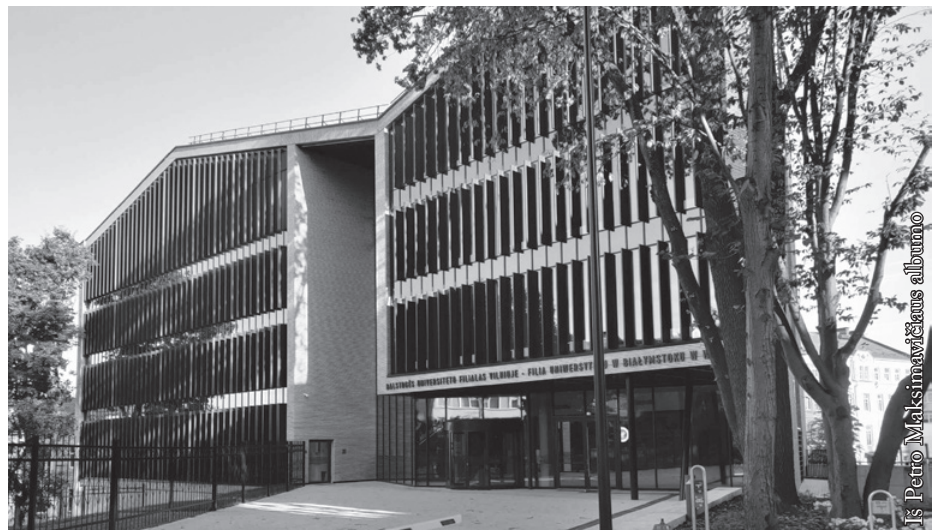
Balstogės universiteto filialas Vilniuje