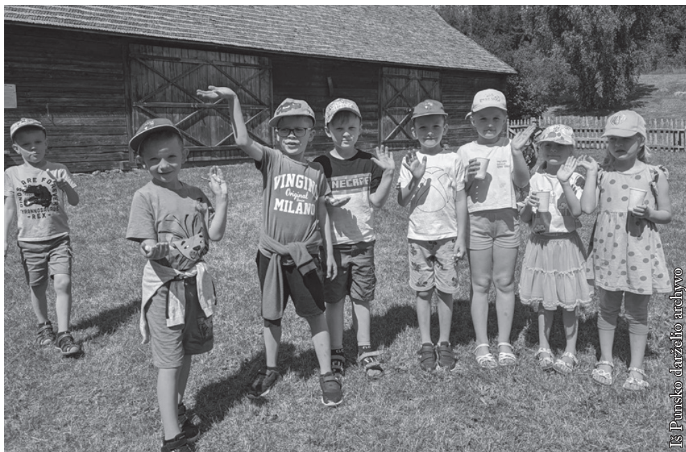
Iš Punsco darželio archyvo

pasirodė scenoje III vaikų sąskrydyje „Pasveikinkim mamytės“, kuris vyko Punsco kultūros namuose.