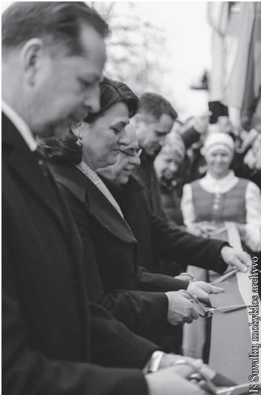
Iš Suvalkų mokyklos archyvo